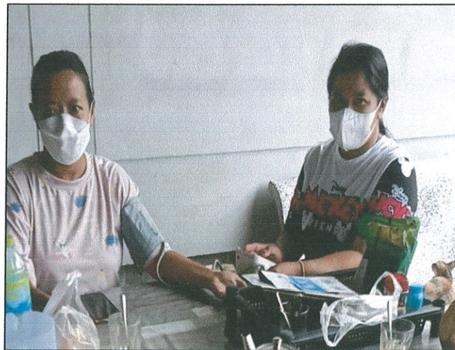
จับคู่ อสม. กับกลุ่มเสี่ยงโรคความดันโลหิต ติดตามตรวจความดันโลหิตประชาชนกลุ่มเสี่ยง