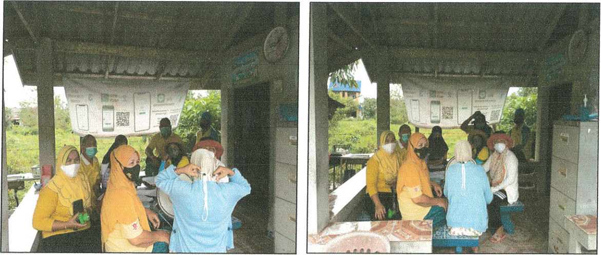
ชี้แจงโครงการแก่ อสม. 20 คน