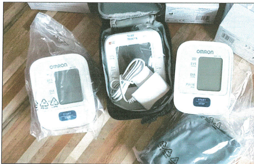
จัดซื้อเครื่องวัดความดันโลหิตแบบดิจิตอล จำนวน 3 เครื่อง สำหรับใช้ในการปฏิบัติงาน