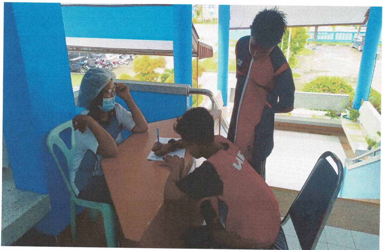
ลงทะเบียนเข้าร่วมโครงการ