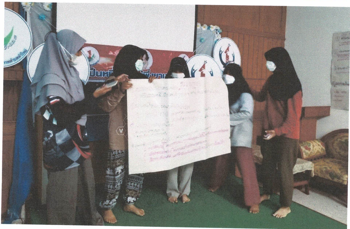
เวทีแลกเปลี่ยนรู้และถอดบทเรียนร่วมกัน