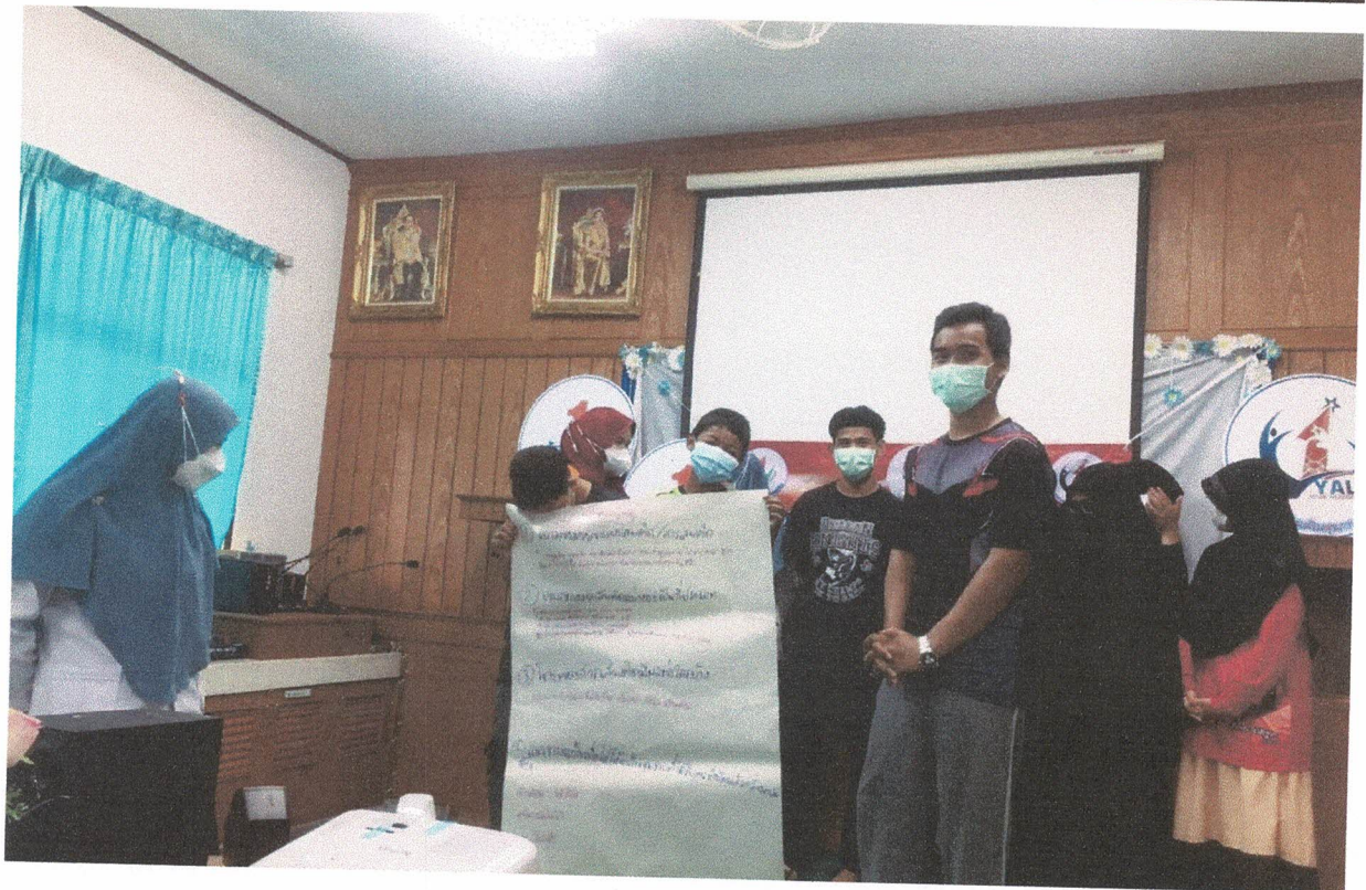
เวทีแลกเปลี่ยนรู้และถอดบทเรียนร่วมกัน