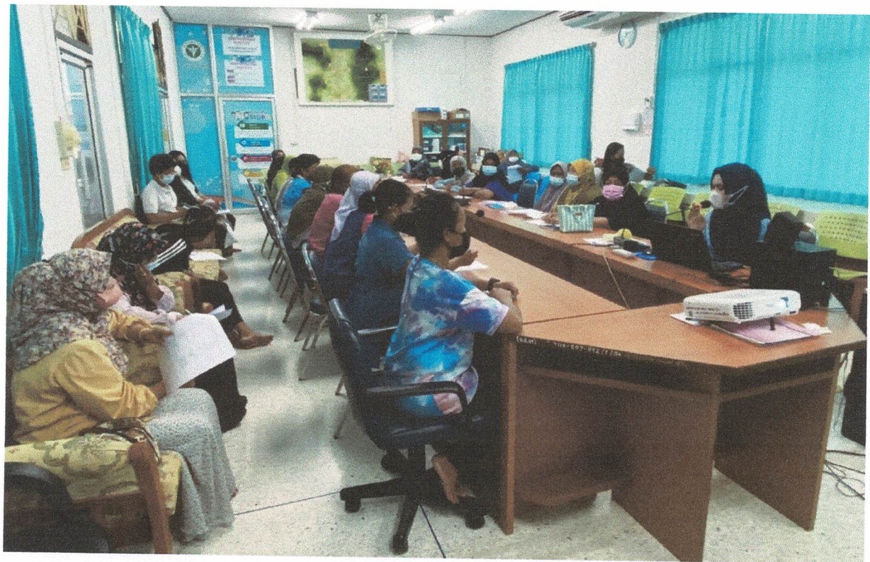
อบรมให้ความรู้แก่กลุ่มเป้าหมาย