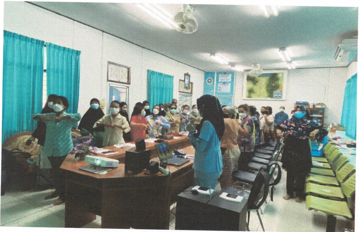
ฝึกออกกำลังกายท่ากายบริหารณี่เวช