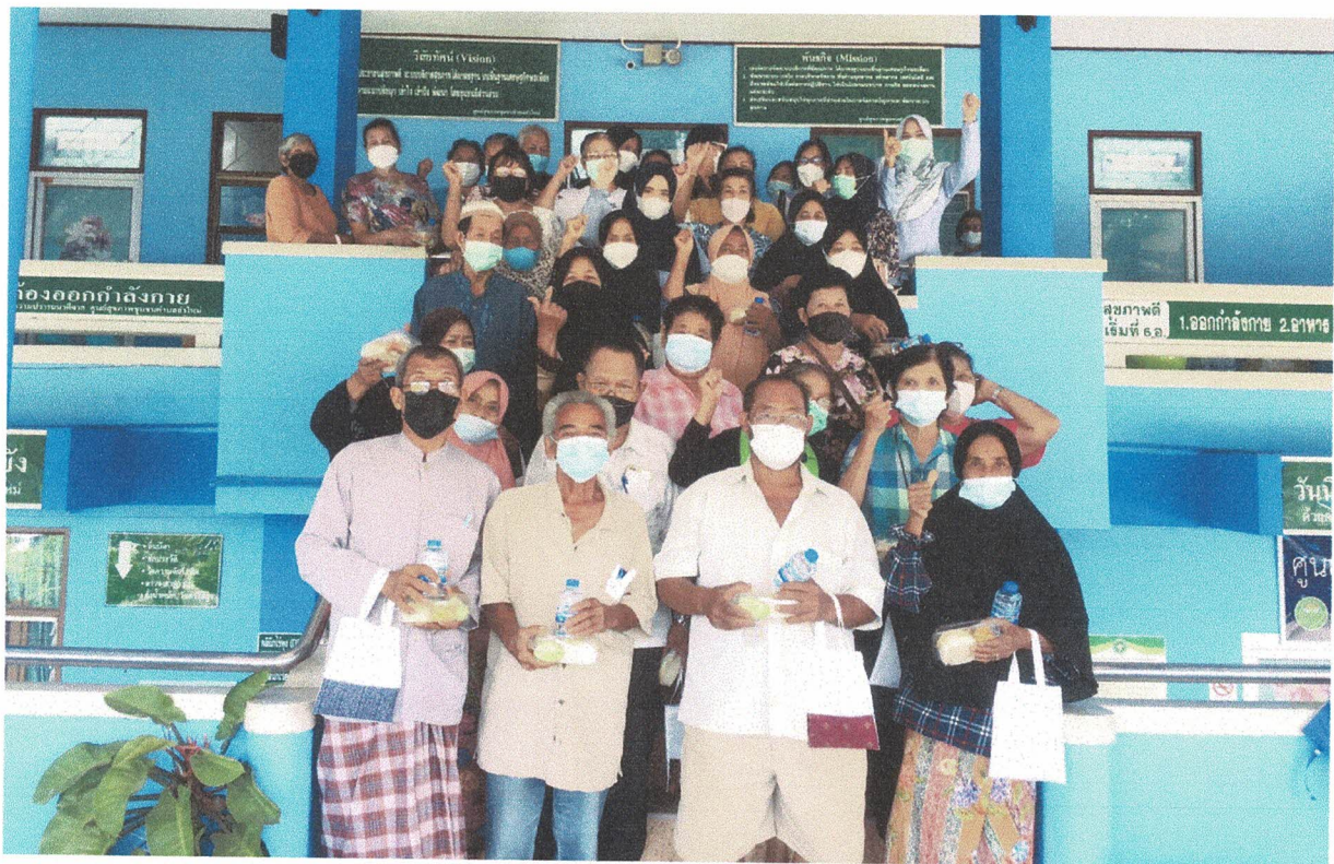
ร่วมถ่ายภาพที่ระลึก