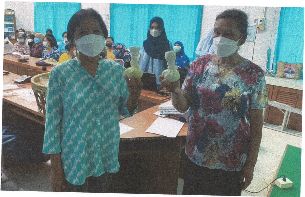
เรียนรู้การทำลูกประคบสมุนไพร สาธิต/พร้อมฝึกปฏิบัติ