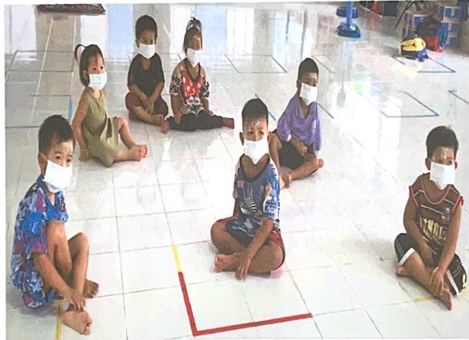
รณรงค์ให้นักเรียนสวมหน้ากากอนามัยเพื่อป้องกันโรคติดเชื้อไวรัสโคโรนา (COVID-๑๙)