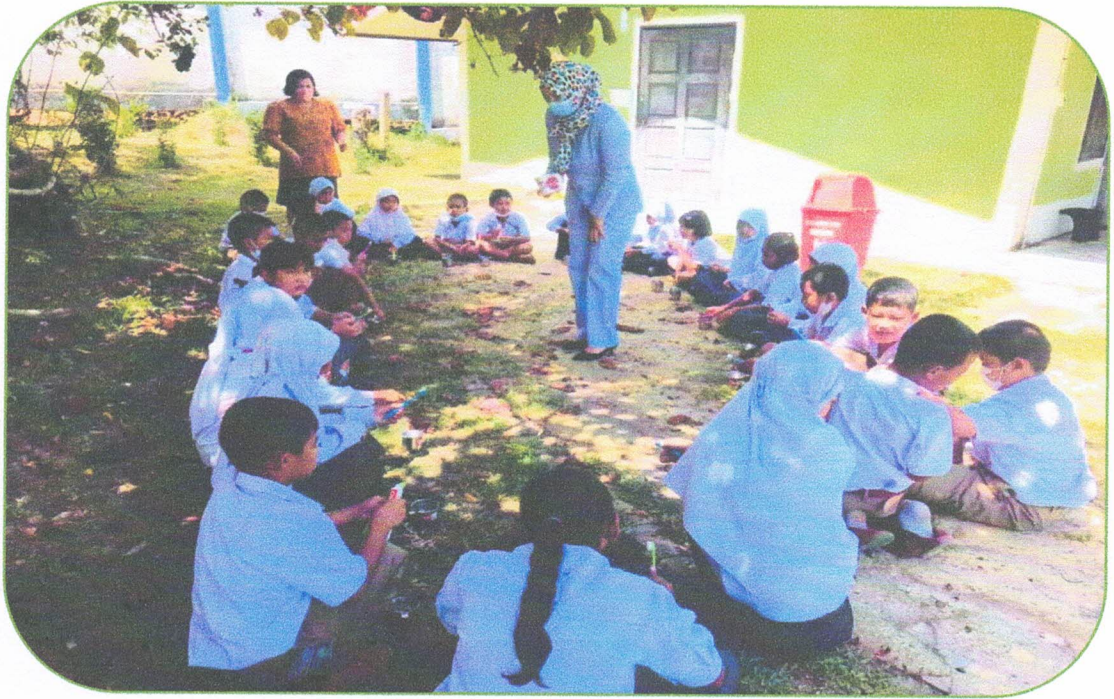
นักเรียนแปรงฟัน