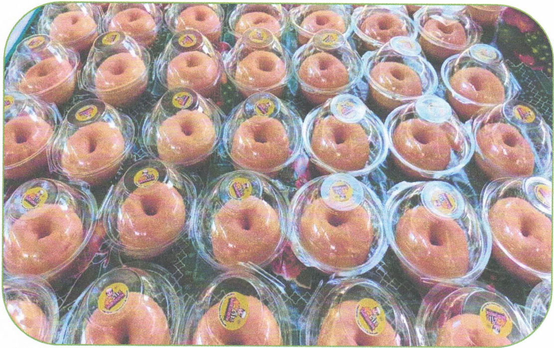
อาหารว่างสำหรับนักเรียน