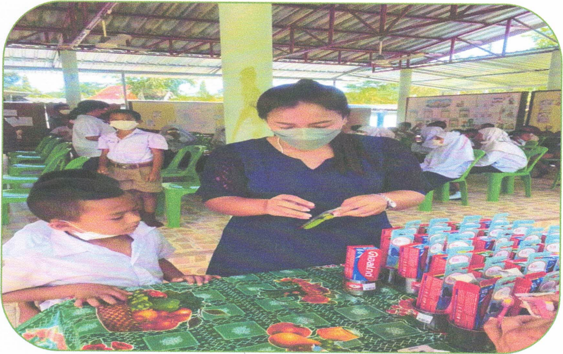
ครูแจกแปรงสีฟัน ยาสีฟันและแก้วน้ำให้นักเรียน