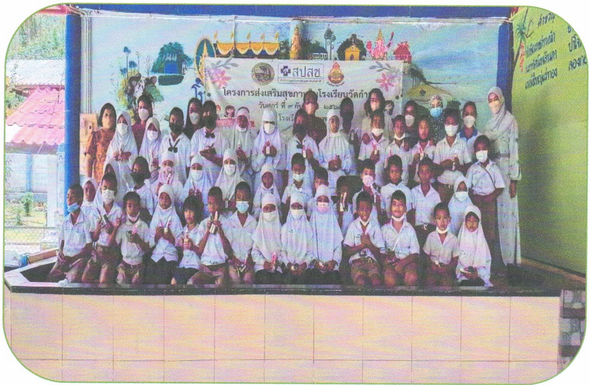
ถ่ายรูปพร้อมกัน