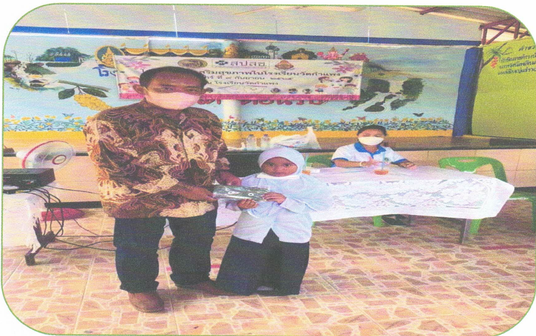
ผู้บริหารมอบของรางวัลสำหรับนักเรียนฟันสวย