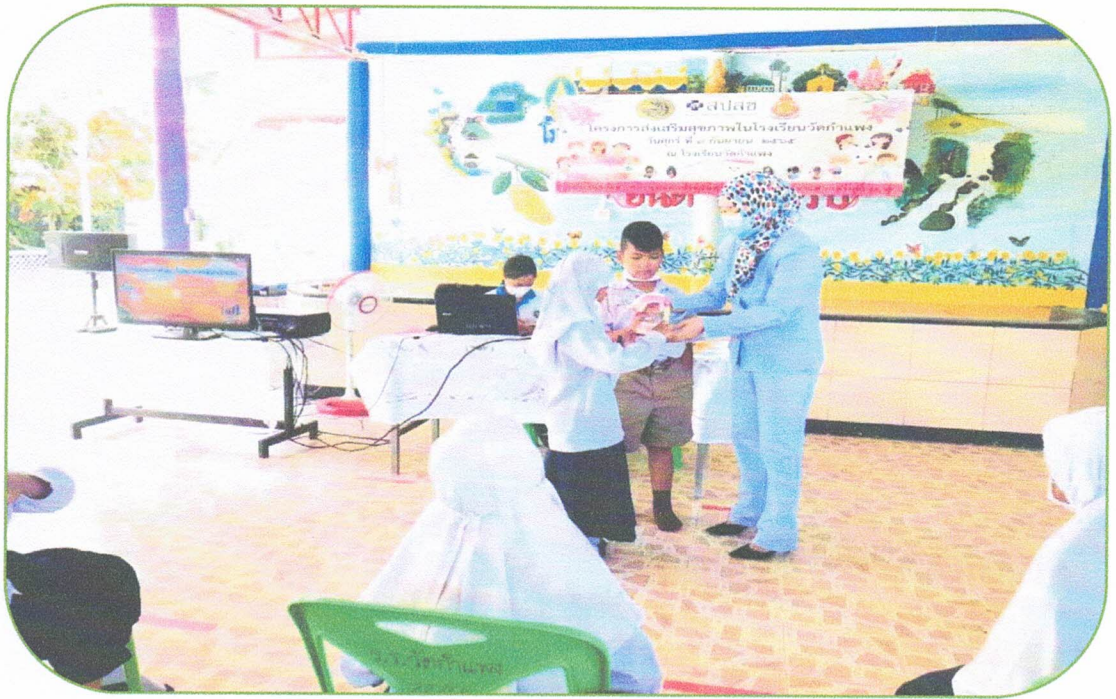
วิทยากรบรรยายให้ความรู้แก่นักเรียน