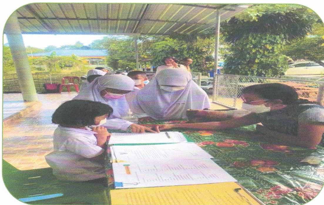
นักเรียนลงทะเบียน