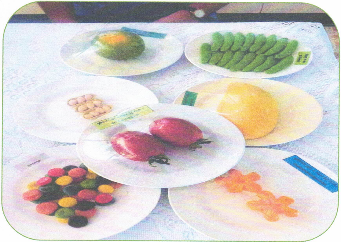
สื่อและอุปกรณ์ที่ใช้ในการอบรม