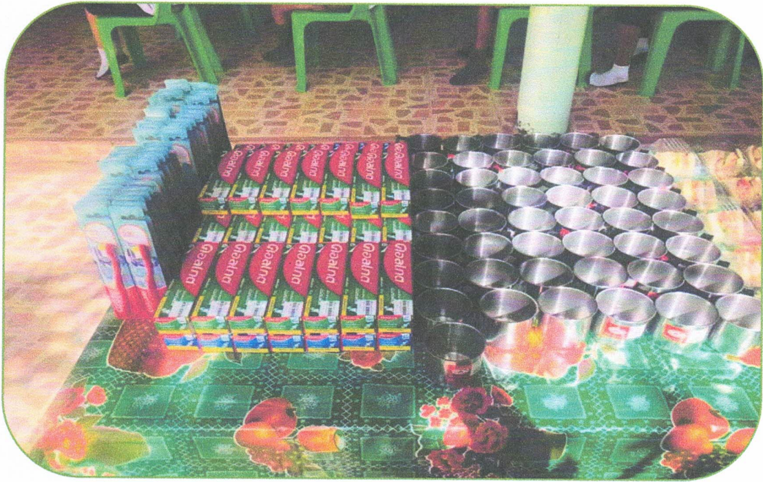
แปรงสีฟัน ยาสีฟัน แก้วน้ำที่ใช้แจกนักเรียน