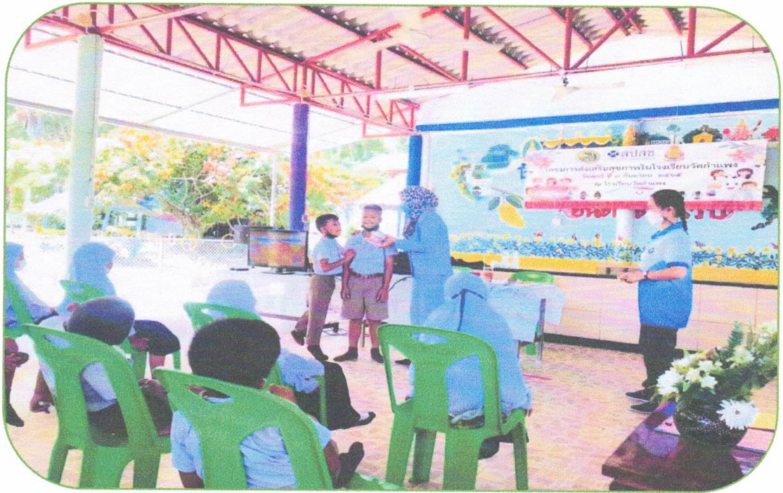
ป้ายไว้นิลโครงการ