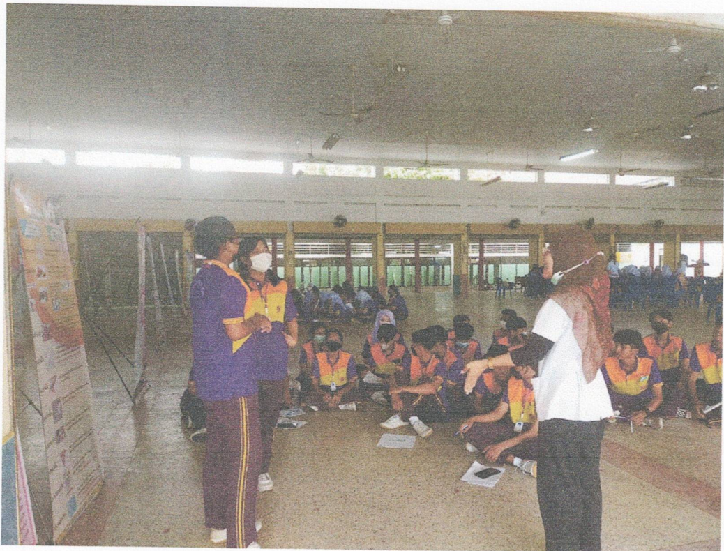
กิจกรรมฐานการเรียนรู้การสาธิตและฝึกปฏิบัติการให้คำปรึกษา