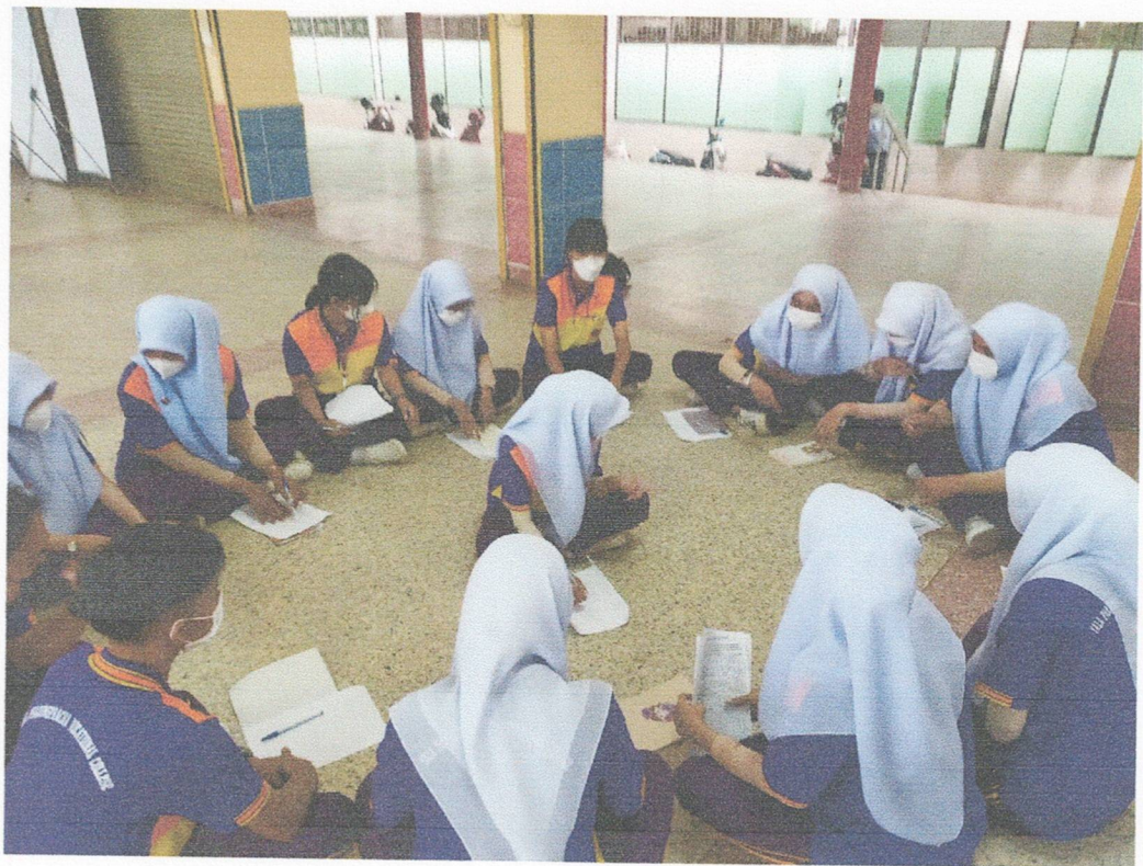
กิจกรรมฐานการเรียนรู้ กิจกรรม Super Teen Friend Corner กักกับการช่วยเพื่อน