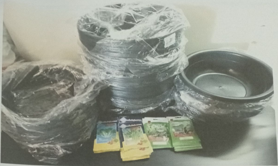
กิจกรรมการ เลี้ยงไส้เดือน และปลูกผัก