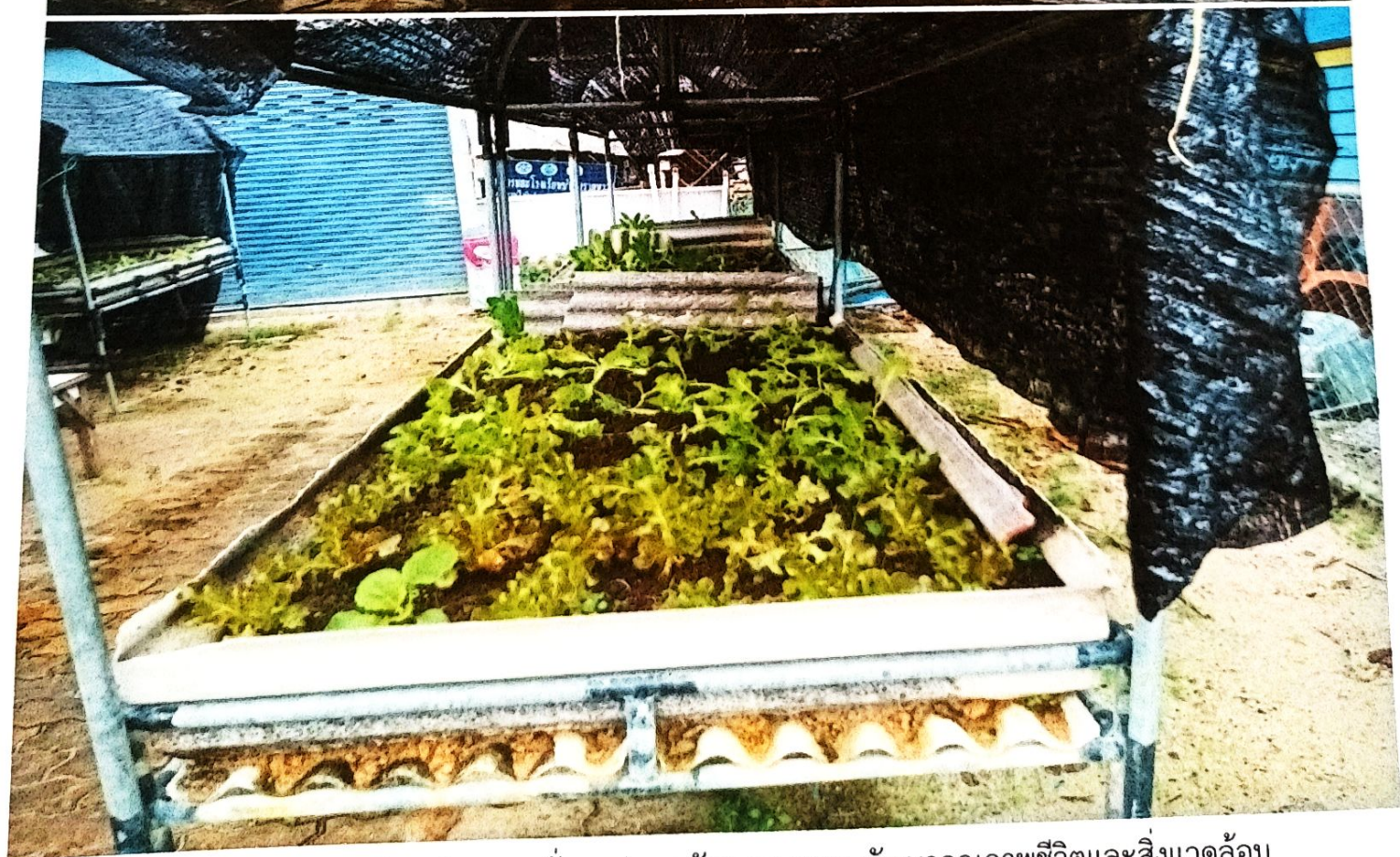
กิจกรรมการปลูกผัก เสริมความมั่นคงปลอดภัยทางอาหาร พัฒนาคุณภาพชีวิตและสิ่งแวดล้อม