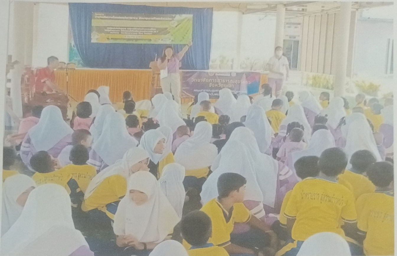
กิจกรรม อบรมสร้างความรู้ ความเข้าใจการบริโภคอาหารที่ปลอดภัยตามหลักโภชนาการ แก่นักเรียนและครูโรงเรียนบ้านทรายขาว

โครงการ การส่งเสริมความมั่นคงปลอดภัยทางอาหาร พัฒนาคุณภาพชีวิตและสิ่งแวดล้อม