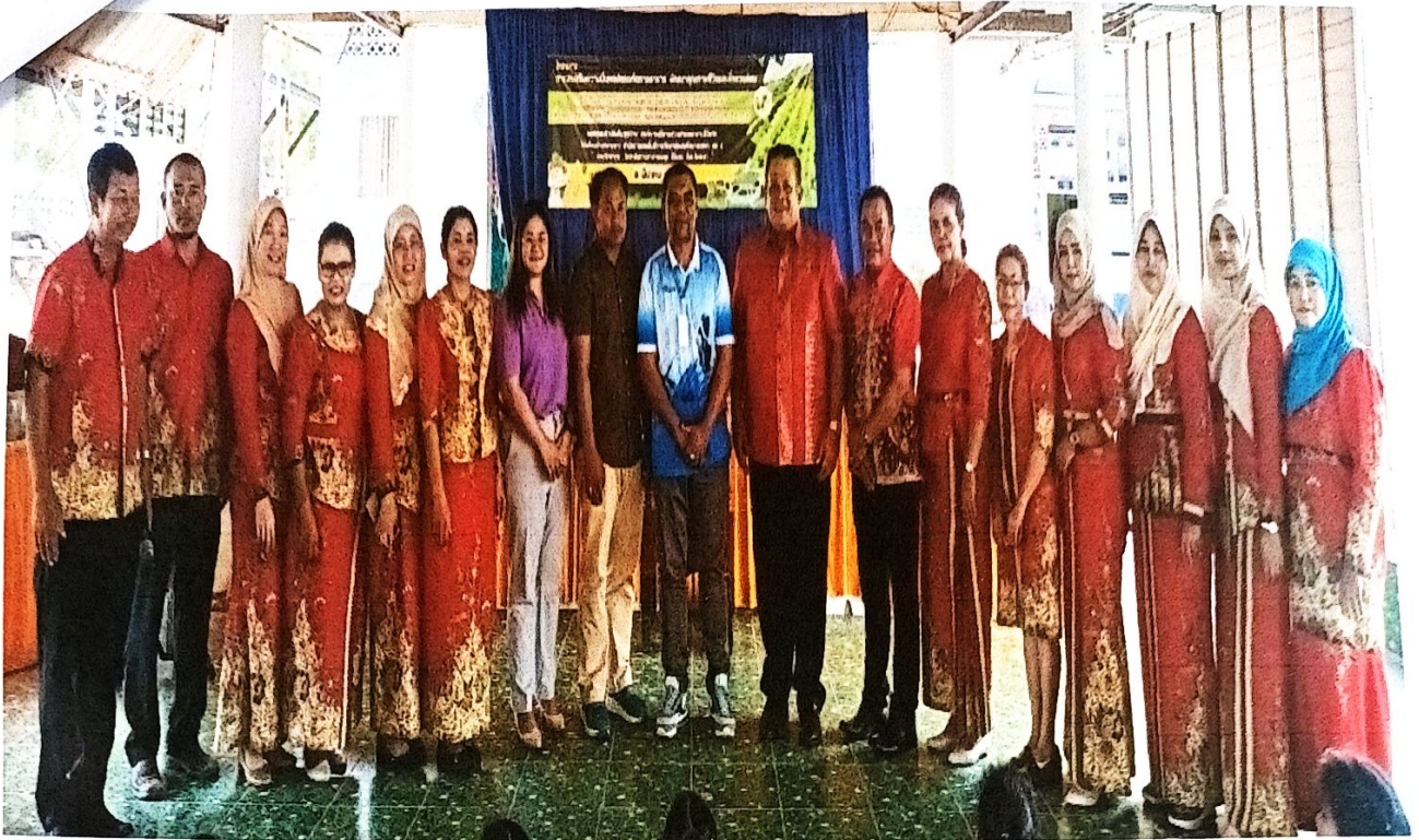
กิจกรรม อบรมสร้างความรู้ ความเข้าใจการบริโภคอาหารที่ปลอดภัยตามหลักโภชนาการ แก่นักเรียนและครูโรงเรียนบ้านทรายขาว