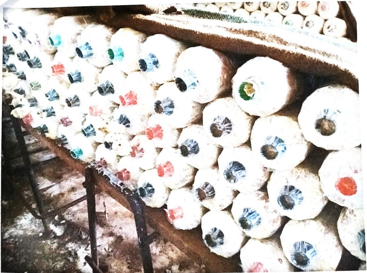
กิจกรรม การเพาะเห็ดนางฟ้า