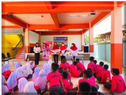
ฐานที่ ๓ ควันบุหรีมีพิช อย่าคิดลอง