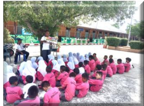
ฐานที่ ๔ กีฬาต้านยาเสพติด