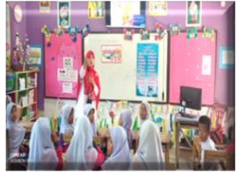
ฐานที่ ๒ โทษภัยของยาเสพติด