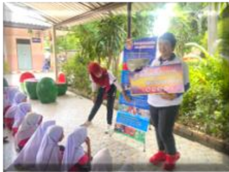
ฐานที่ ๑ เรียนรู้ประเภทของยาเสพติด