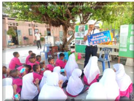
ฐานที่ ๕ อยู่อย่างไรให้ห่างไกลยาเสพติด