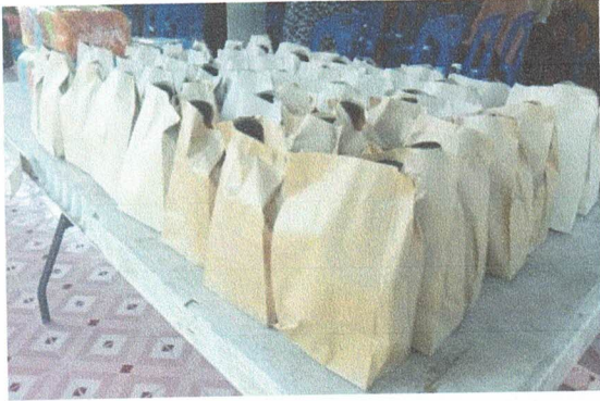
อาหารว่างและเครื่องดื่มภาคเช้า