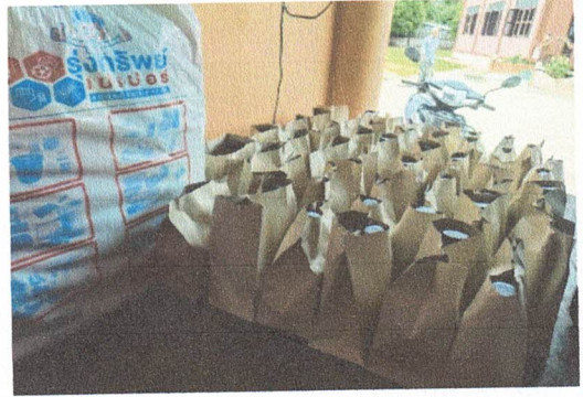
อาหารว่างและเครื่องดื่มภาคบ่าย