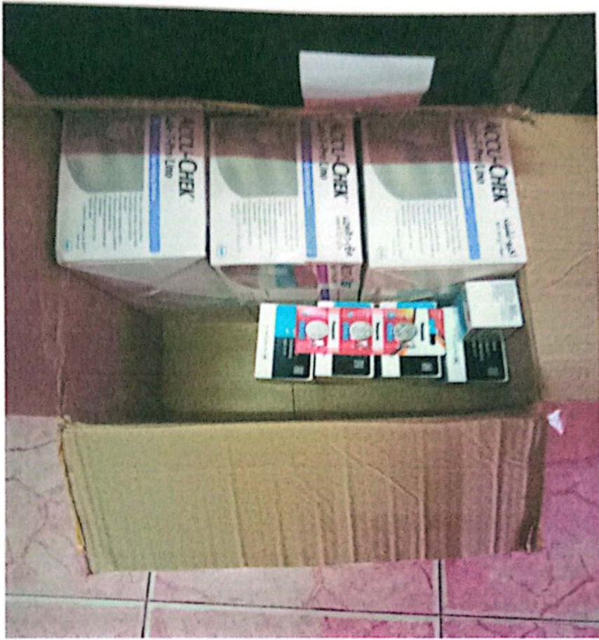
ภาพแถบตรวจระดับน้ำตาลในเลือด ซีเอ็มเจอะปลายนิ้ว โรคความดันโลหิตสูงและเบาหวานในชุมชน