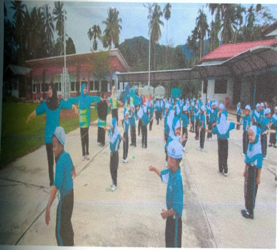
กิจกรรมที่ ๔ : กิจกรรมส่งเสริมการเคลื่อนไหวและออกกำลังกาย