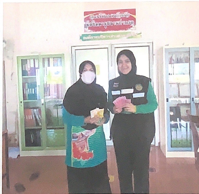
แจกทรายอะเบท โลชั่นทาแก้นุง และสเปรย์กำจัดยุงให้กับศูนย์พัฒนาเด็กเล็ก