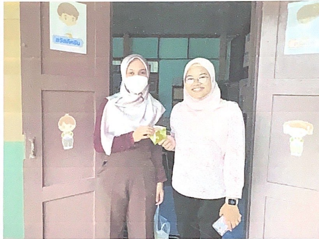
แจกทรายอะเบท โลชั่นทากันยุง ให้กับศูนย์เด็กพิเศษ