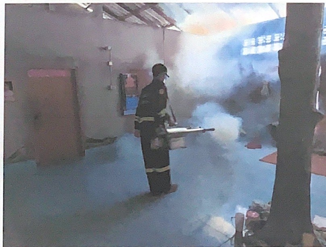
พ่นสารเคมีกำจัดยุงลายบ้านผู้ป่วยไข้เลือดออกและบริเวณรัศมี ๑๐๐ เมตร