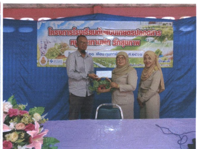
มอบกระเช้าที่ระลึก