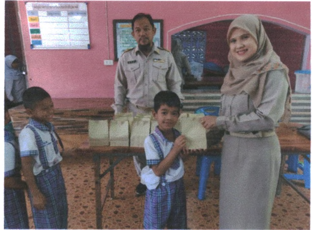
รับอาหารว่างและเครื่องดื่ม