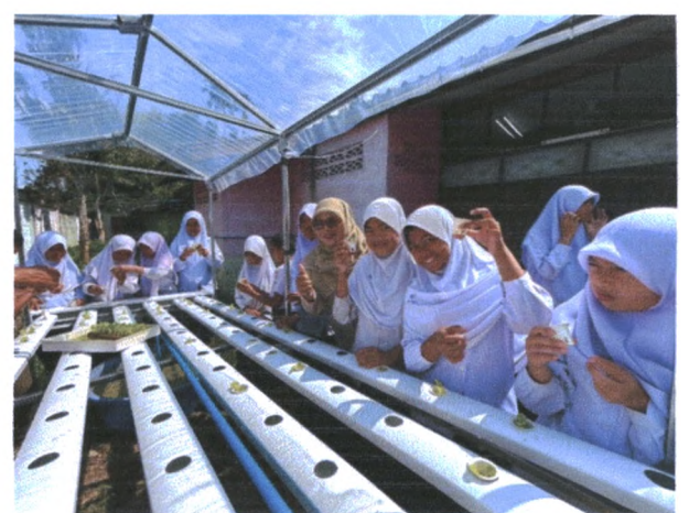
วิทยากรบรรยายในหัวข้อ “ปลูกผักไฮโดรโปนิคส์ ไร้สารพิษ”