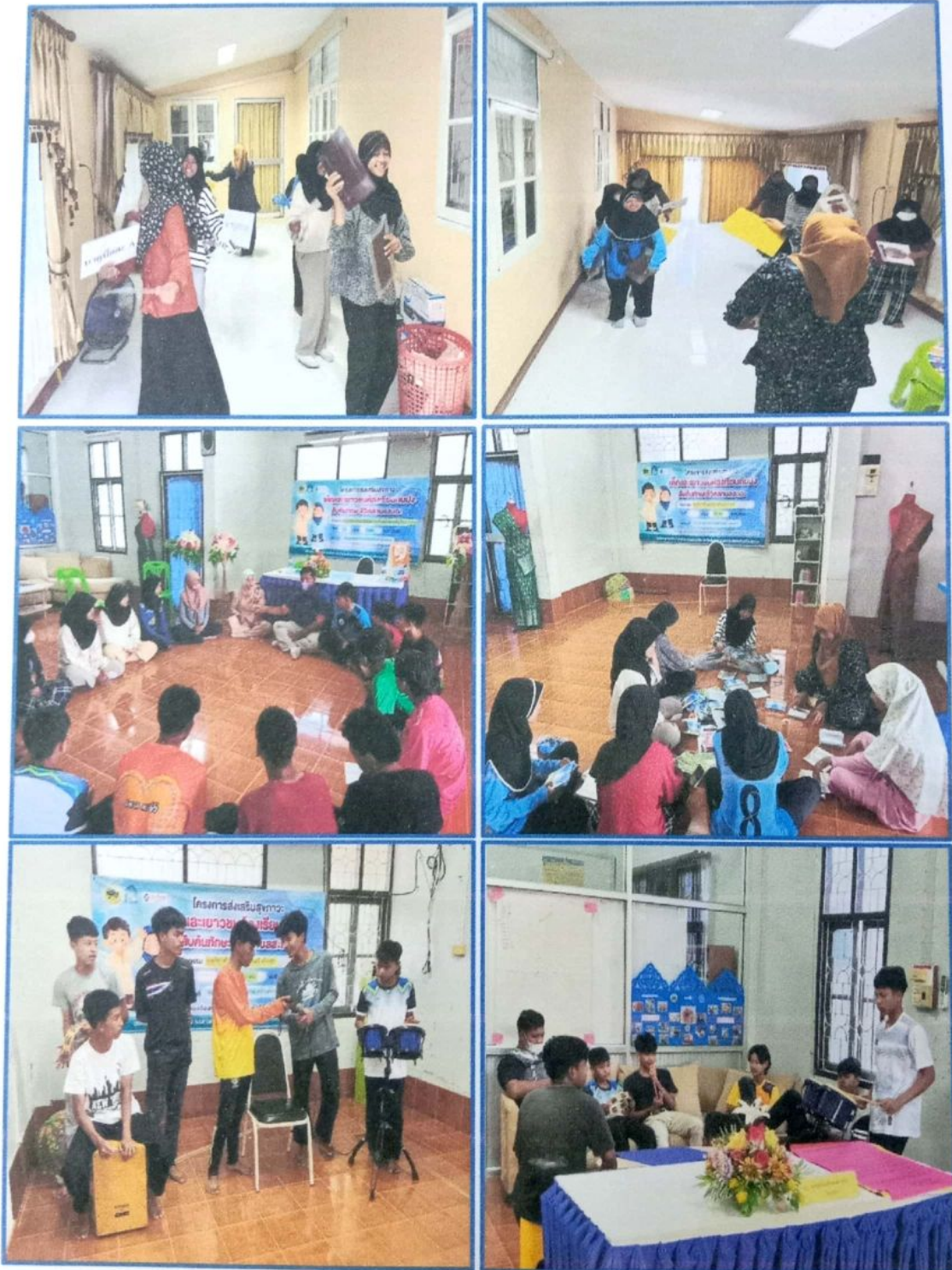
ภาพที่ ๑๙ - ๒๔ ภาพกิจกรรมกลุ่มกิจกรรมเพื่อใช้เวลาให้เกิดประโยชน์ การรวมตัวอย่างสร้างสรรค์ภายใต้กิจกรรมการรำดาลีกีปัส การขับร้องเพลง โดยมีจิตอาสาครูนอกระบบการศึกษาเป็นพี่เลี้ยง