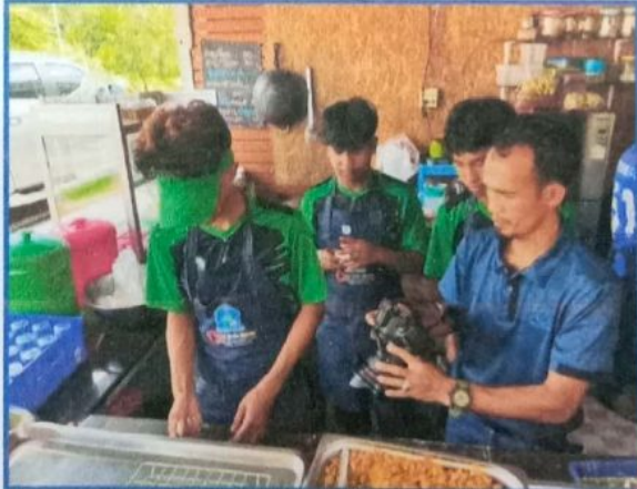
ภาพที่ ๓๑-๓๗ ภาพกิจกรรมการหนุนเสริมปัจจัยอื่นในเรื่องของการนำเด็กกลุ่มเสียงเข้าระบบการศึกษาของ ศูนย์ส่งเสริมการเรียนรู้ (กศน.เดิม) การฝึกอาชีพ การทำกิจกรรมจิตอาสา การฝึกทำอาหาร ช่วยเสริมสร้าง พัฒนาศักยภาพ การใช้เวลาว่างในทางสร้างสรรค์ และปลอดภัย เกิดกลไกพี่เลี้ยง ครอบครัวยุวมชน