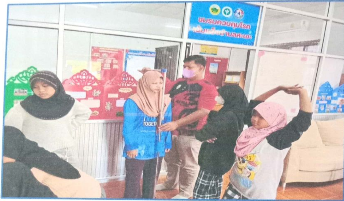
ภาพที่ ๗ กิจกรรมการคัดกรองสุขภาพของเด็กและเยาวชน การวัดน้ำหนัก ส่วนสูงเพื่อหาค่า BMI

โครงการส่งเสริมสุขภาพเด็กและเยาวชนห้องเรียนกัมปงสืบค้นทักษะชีวิต ประจำปี ๒๕๖๖ กิจกรรม เสริมพลังใจ รักสุขภาพ วัน จันทร์ ที่ ๖ เดือน มีนาคม พ.ศ.๒๕๖๖ ณ ห้องประชุมองค์การบริหารส่วนตำบลสะเอะ (ตึกเก่า) อ.กรงปินัง จ.ยะลา