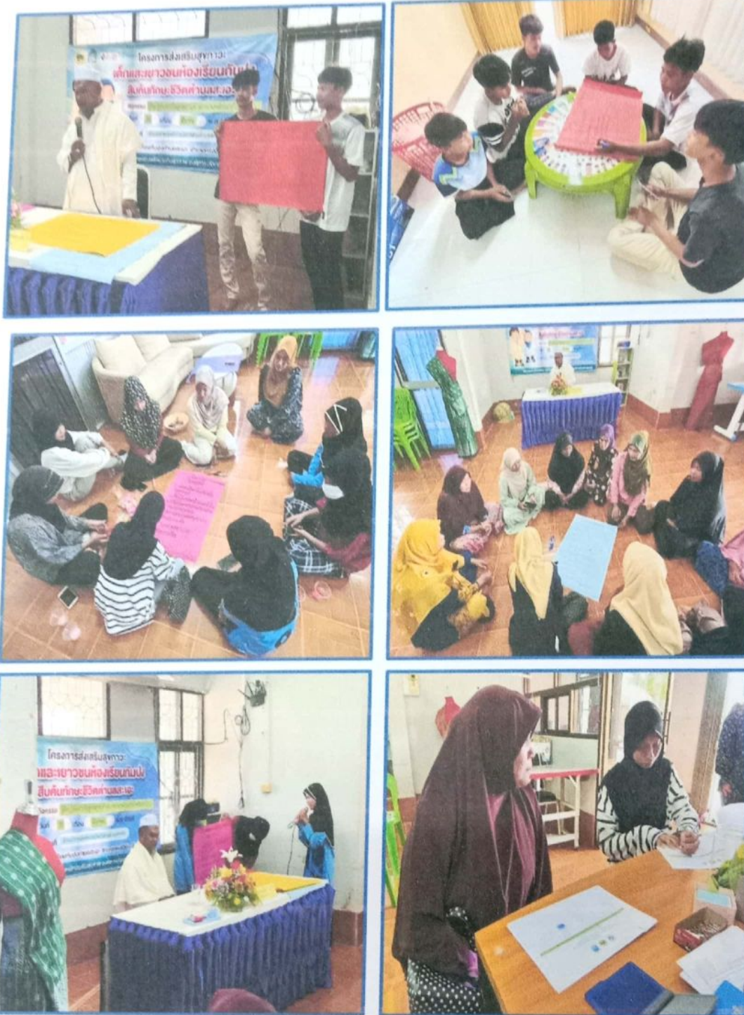
ภาพที่ ๑๓ - ๑๘ ภาพกิจกรรมกลุ่มเพื่อให้เด็กและเยาวชนและผู้ปกครองถอดข้อมูลปัญหาระหว่างเด็กกับผู้ปกครองตลอดจนการสร้างข้อตกลงร่วมกันเพื่อสร้างความรัก ความเข้าใจและป้องกันปัญหา ยาเสพติด