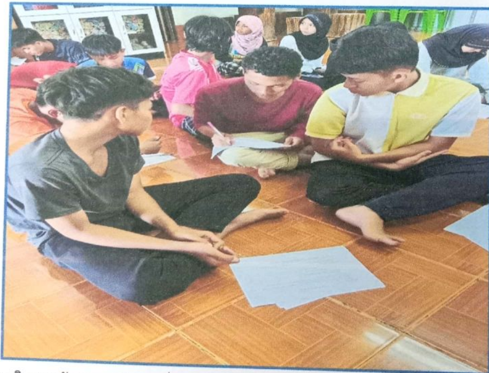
ภาพที่ ๘ กิจกรรมคัดกรองพฤติกรรมเสี่ยงของวัยรุ่น มีวัตถุประสงค์เพื่อรับรู้ข้อมูลภาพรวมและข้อมูลรายบุคคลของเด็กและเยาวชนเกี่ยวกับพฤติกรรมเสี่ยงสุขภาพ ให้สามารถวิเคราะห์ช่วยเหลือรายกรณี