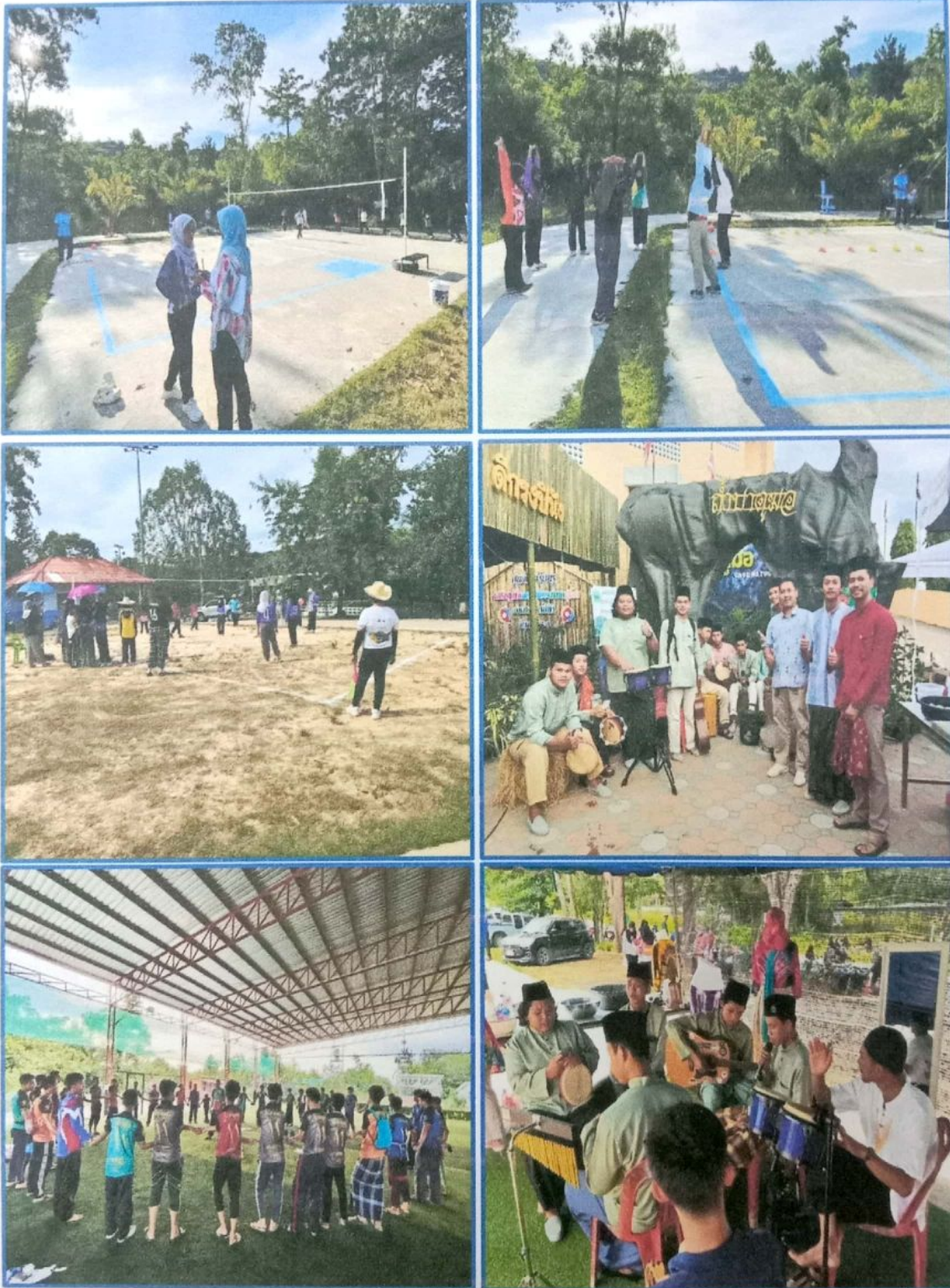
ภาพที่ ๒๕ - ๓๐ ภาพกิจกรรมกลุ่มกิจกรรมเพื่อใช้เวลาให้เกิดประโยชน์ การรวมตัวอย่างสร้างสรรค์ภายใต้กิจกรรมกีฬาดนตรีและการส่งเสริมให้มีพื้นที่ในการแสดงออก ช่วยส่งเสริมสุขภาพด้านสุขภาพและสังคม