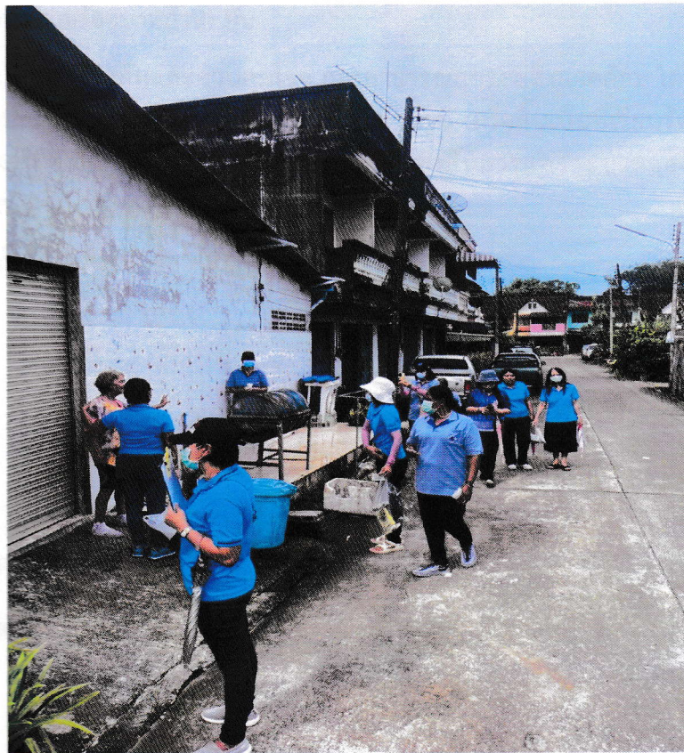
กิจกรรมรณรงค์การป้องกันโรคฉี่หนูและการปรับปรุงสุขาภิบาลสิ่งแวดล้อมในชุมชน