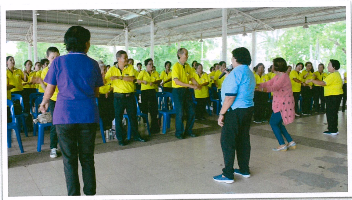
กิจกรรมบริหารสมอง