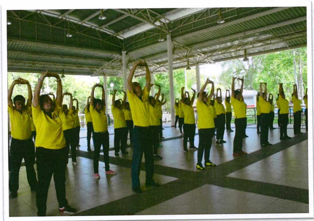
ออกกำลังกาย