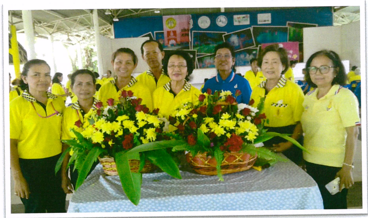
การจัดดอกไม้ด้วยจิต