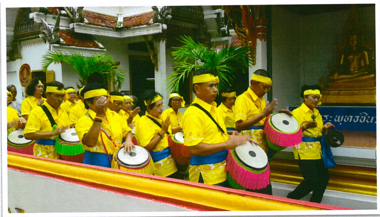
เข้าร่วมกิจกรรมงานบุญงานบวชของชุมชน