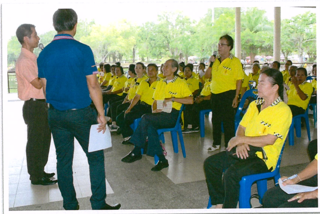
กฎหมายในชีวิตประจำวัน