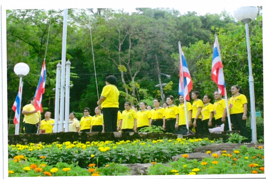
เข้าแถวเคารพธงชาติ