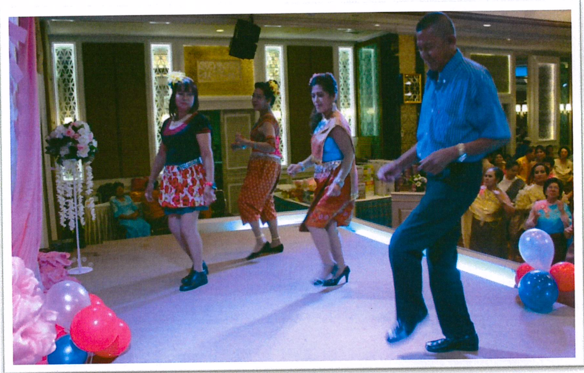
การร่วมกิจกรรมทางสังคม