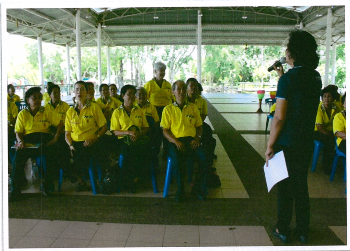
สิทธิผู้สูงอายุและช่องทางติดต่อขอใช้สิทธิ