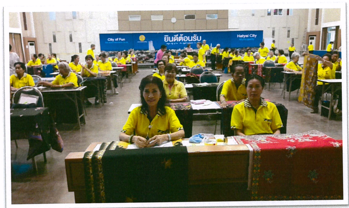
เรียนพันผ้าถุงสีกากเพชร