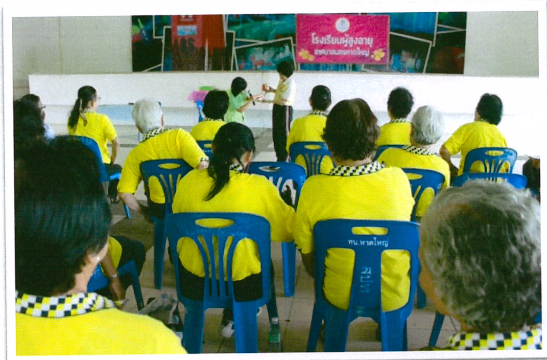
การดูแลสุขภาพช่องปาก