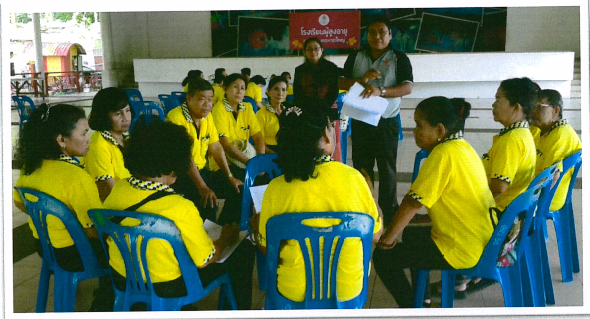
การทำพินัยกรรม