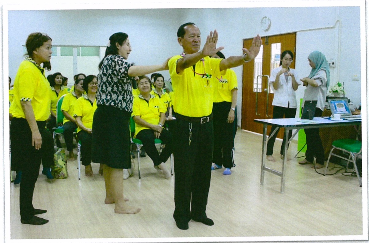
การจัดสมดุร่างกายด้วยหลักกนิเวศศาสตร์