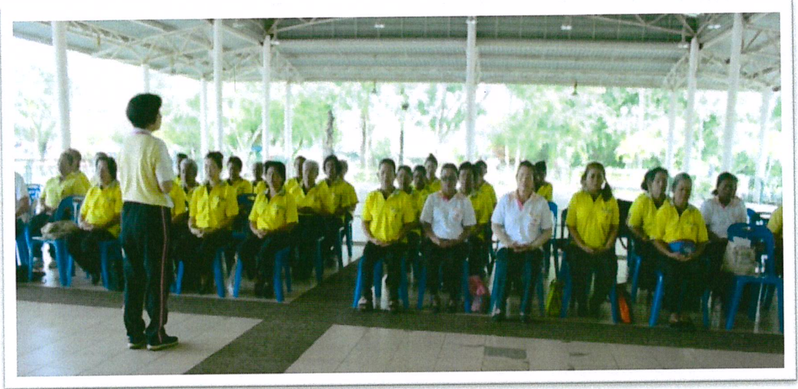
นั่งสมาธิ