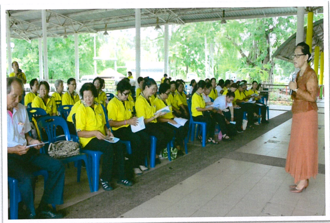
ภาษาอังกฤษสำหรับผู้สูงอายุ