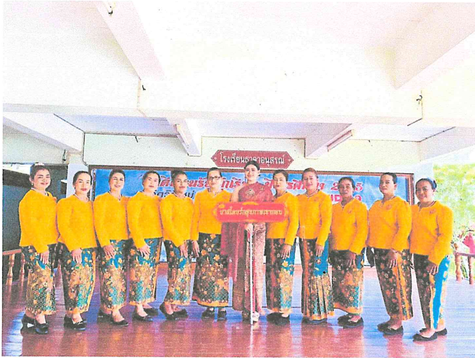
ร่วมงานกีฬาหมู่บ้านเทศบาลกอบ