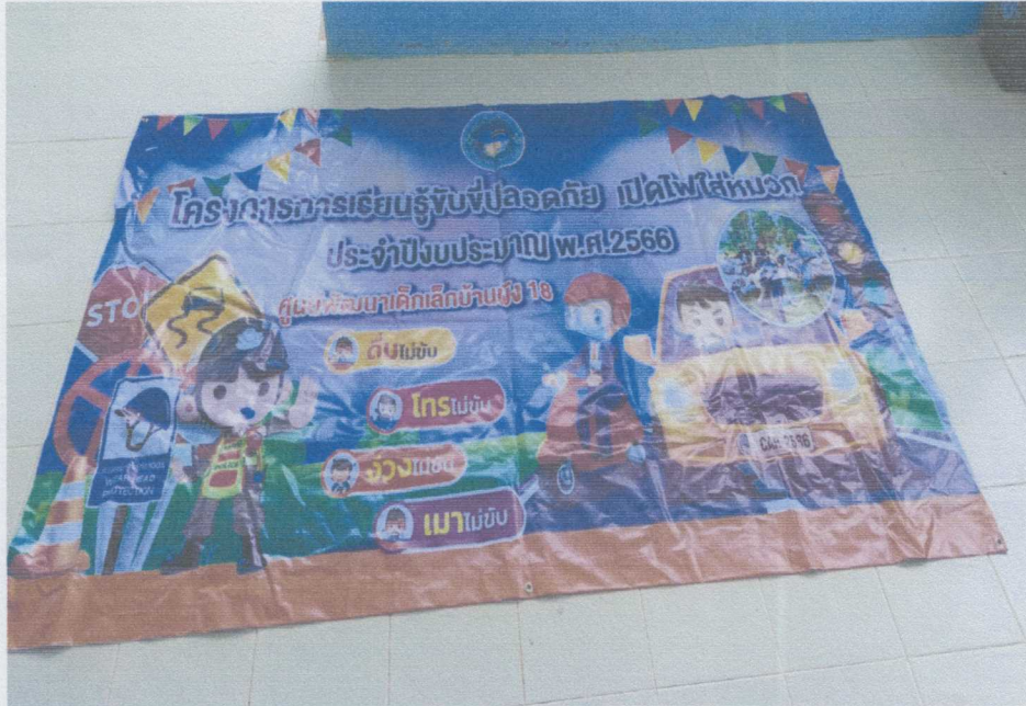
ภาพไวเนลประชาสัมพันธ์โครงการฯ ขนาด ๑.๔ x ๒.๕ เมตร

ภาพประกอบตามโครงการการเรียนรู้ขับขี่ปลอดภัย เปิดไฟใส่หมวก ศูนย์พัฒนาเด็กเล็กบ้านผึ่ง ๑๘ ประจำปีงบประมาณ พ.ศ. ๒๕๖๖