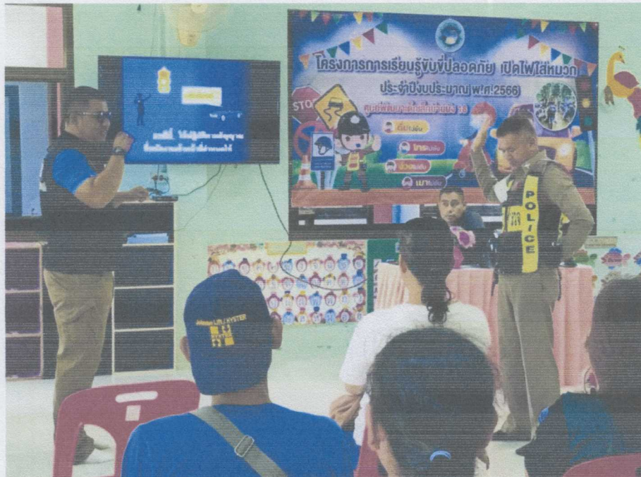
นำป้ายไวเนลมาใช้ประชาสัมพันธ์โครงการฯ