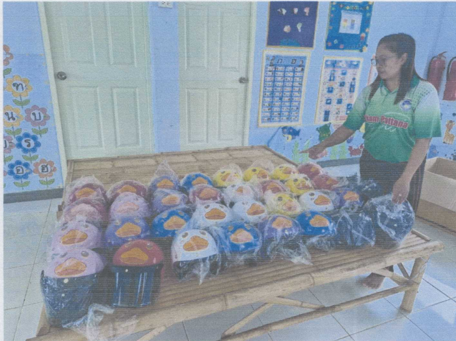
ภาพหมวกนิรภัยแบบเต็มใบสำหรับเด็ก ผ่านมาตรฐานผลิตภัณฑ์ (มอก.) จำนวน ๓๐ ใบ