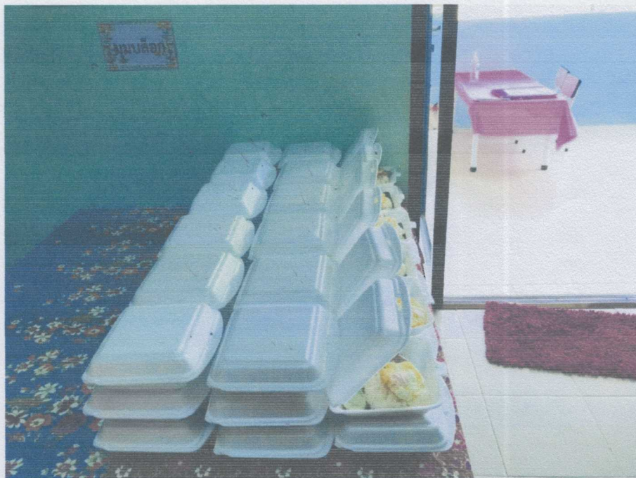
ภาพอาหารกลางวัน จำนวน ๔๘ ชุด