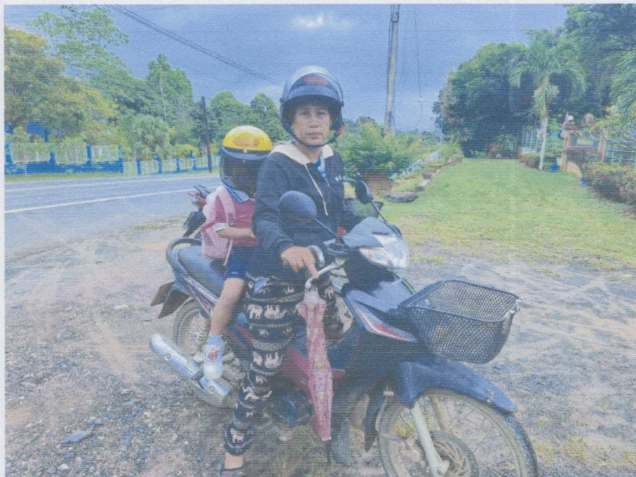
ภาพเด็กนำหมวกนิรภัยไปใช้