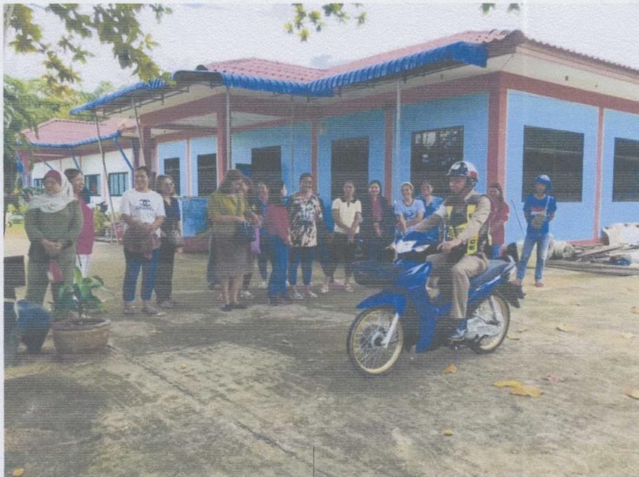
วิทยากรอบรมให้ความรู้ ภาคปฏิบัติเกี่ยวกับระเบียบกฎหมาย และมาตรการต่างๆ ในการเดินทางด้วยความปลอดภัย