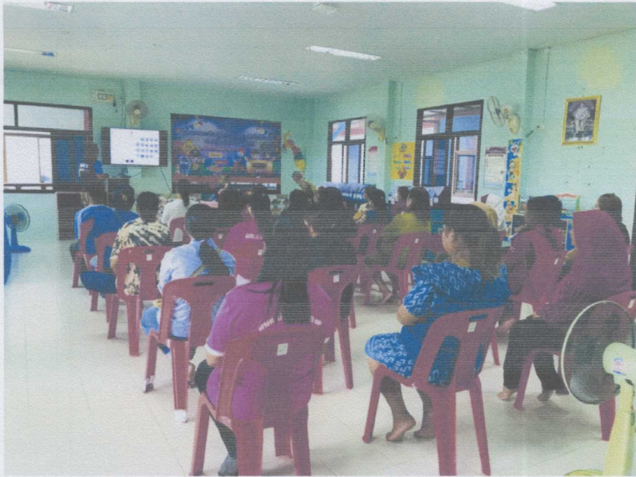
วิทยากรอบรมให้ความรู้ ภาคทฤษฎีเกี่ยวกับระเบียบกฎหมาย และมาตรการต่างๆ ในการเดินทางด้วยความปลอดภัย