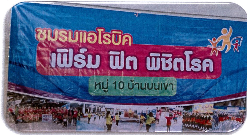
ประธานกล่าวเปิดโครงการออกกำลังกายเพื่อสุขภาพเฟิร์ม ฟิต พิชิตโรค ด้วยการเดินแอโรบิก ม.๑๐