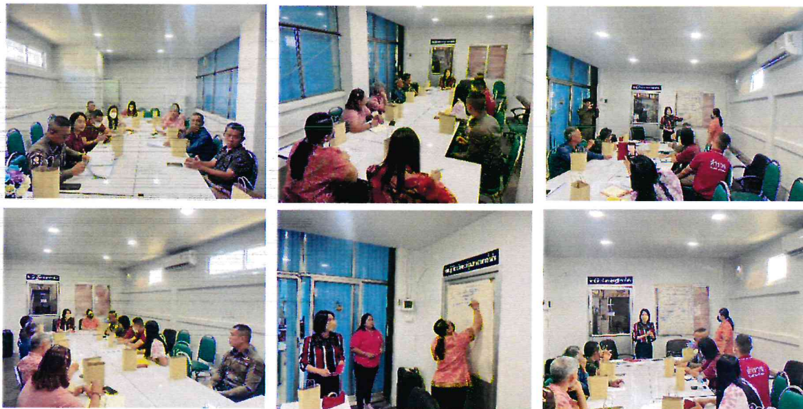
ภาพการประชุม เมื่อ ๒๐ มิถุนายน ๒๕๖๖ ห้องประชุมสำนักสาธารณสุขและสิ่งแวดล้อม

กิจกรรมที่ ๒ กิจกรรมตรวจคัดกรองสารเสพติดในปัสสาวะสำหรับผู้เข้ารับการอบรม จำนวน ๕๐ คน ผลการตรวจเป็นลบ ซึ่งจะมีการดำเนินการในทุกสัปดาห์ ๆ ละ ๒ ครั้ง