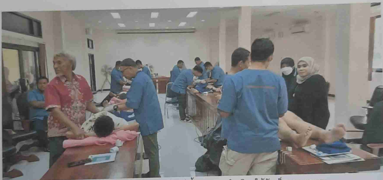
เจ้าหน้าที่สาธารณสุขของสมาคมจันทร์เสี้ยวฯ ขณะทำคลินิกให้กับเด็กและเยาวชน