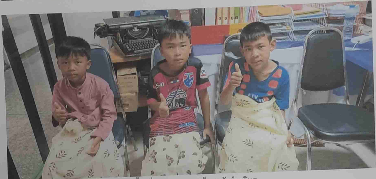
พักฟื้นเพื่อดูอาการแทรกซ้อนหลังทำขลิบฯ