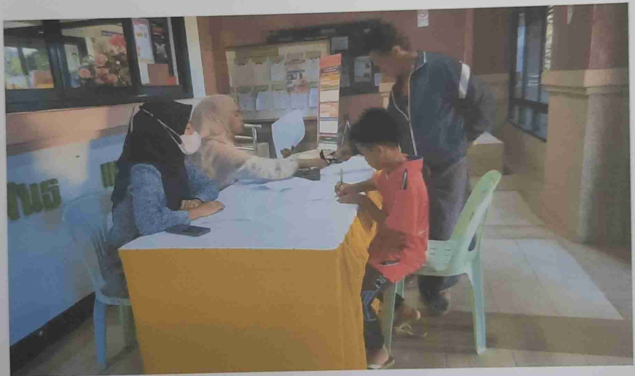
เด็กและผู้ปกครองลงทะเบียนก่อนเข้าอบรม