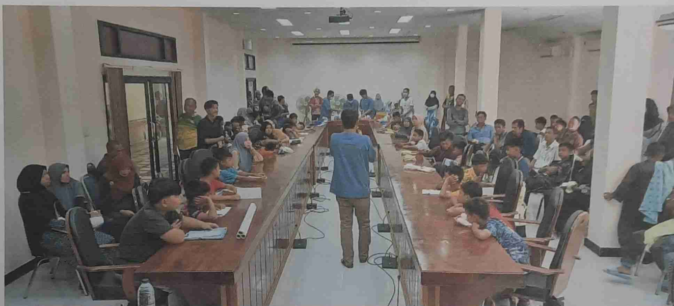
วิทยากรให้ความรู้เรื่องการป้องกันและควบคุมโรคติดต่อและขั้นตอนการขลิบรวมไปถึงการปฏิบัติตัวหลังการขลิบ