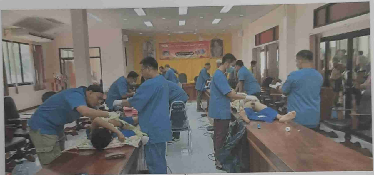
เจ้าหน้าที่สาธารณสุขของสมาคมจันทร์เสี้ยวฯ ขณะทำขลิบฯให้กับเด็กและเยาวชน