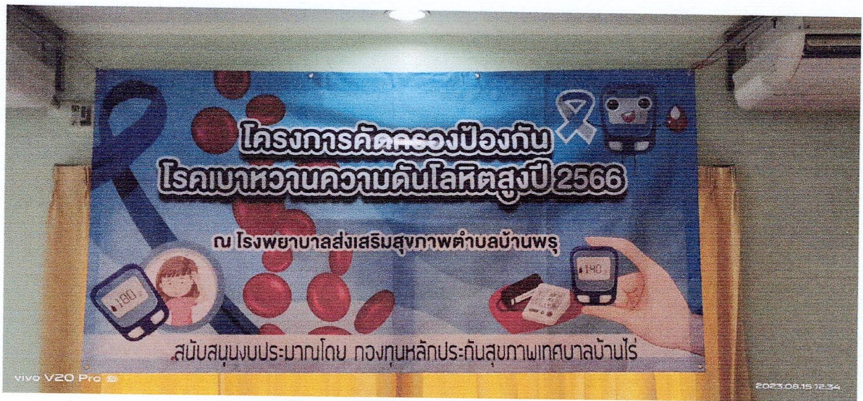
ภาพไว้นิลโครงการฯ