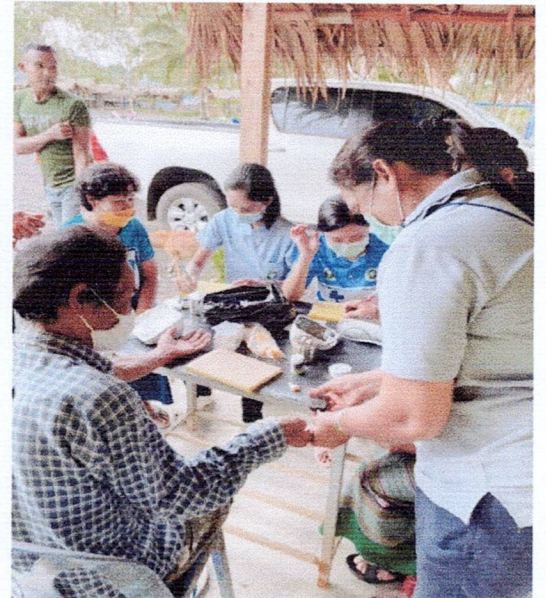
กิจกรรมตรวจคัดกรองโรคเบาหวานและโรคความดันโลหิตสูง