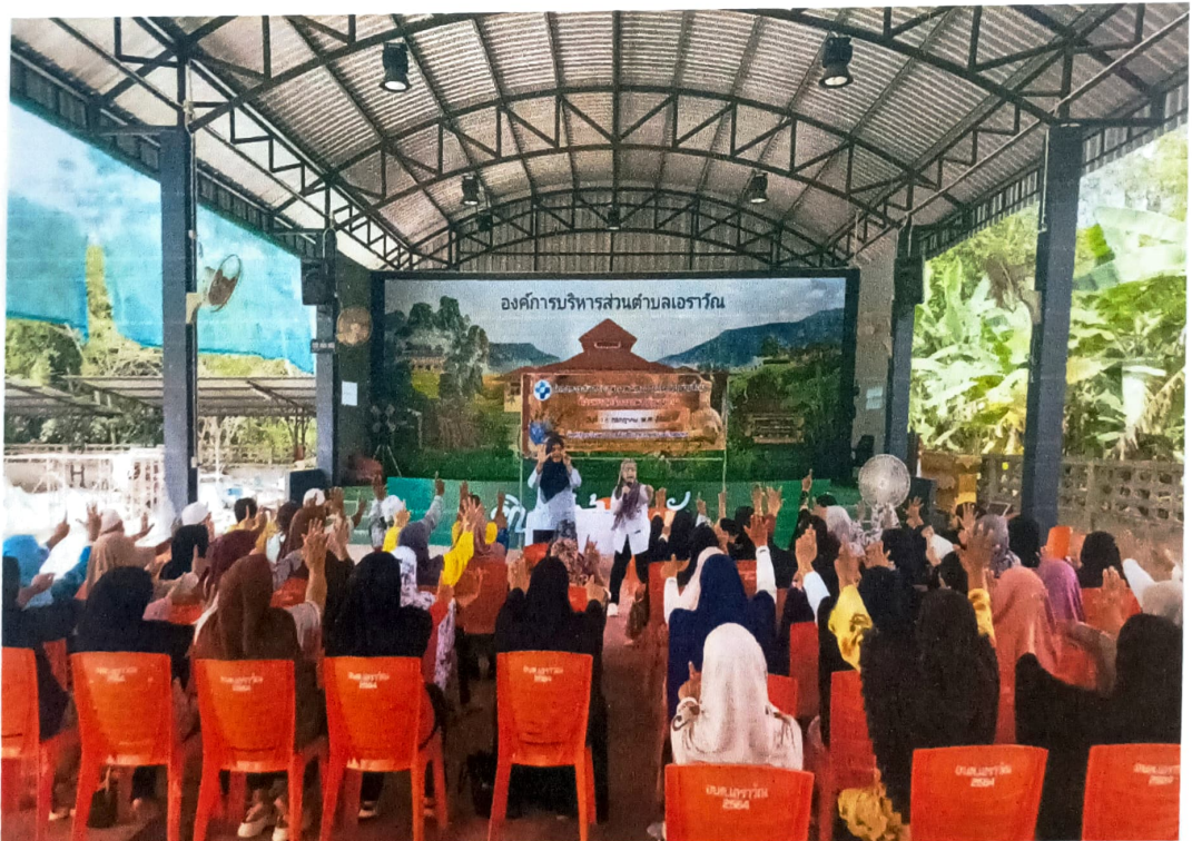
วิทยากรสอนทำกายบริหารพิชิตข้อเข่าเสื่อมในผู้สูงอายุ