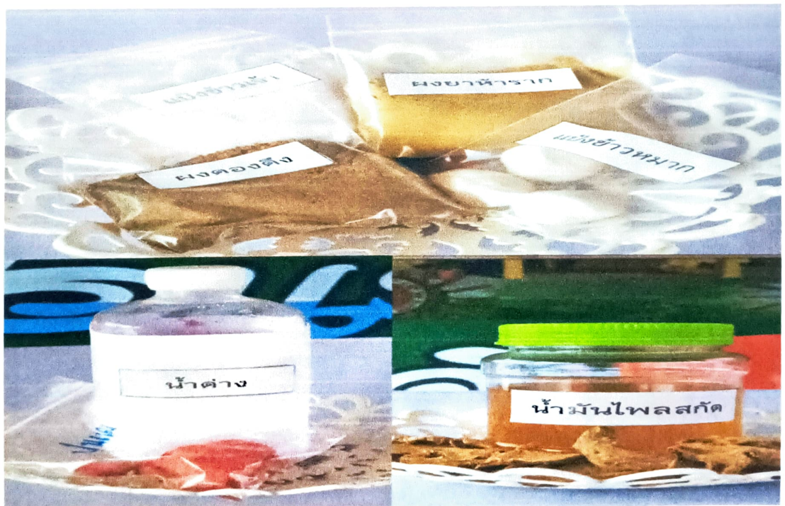
โครงการส่งเสริมสุขภาพผู้สูงอายุโรคข้อเข่าเสื่อมด้วยศาสตร์การแพทย์แผนไทย