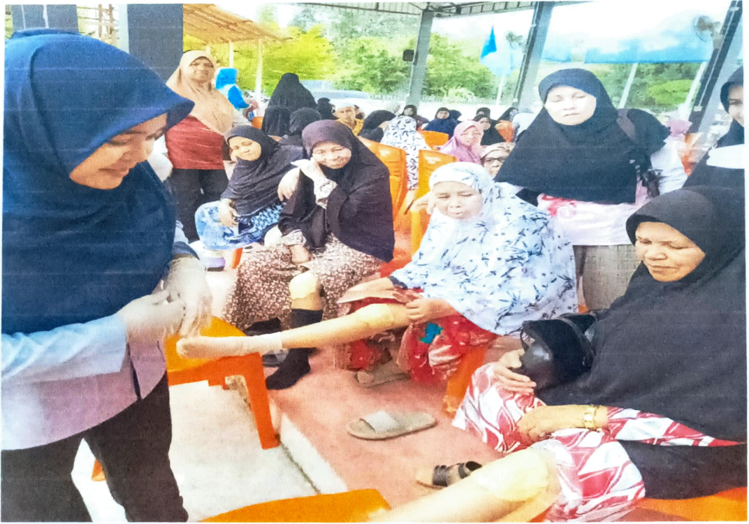
สาธิตการทำยาพอกเข้าสมุนไพรและทำหัตถการพอกเข้าในผู้สูงอายุ