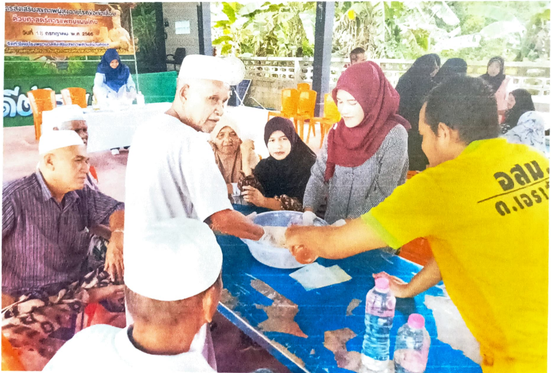
สาธิตการทำยาพอกเข้าสมุนไพรและทำหัตถการพอกเข้าในผู้สูงอายุ