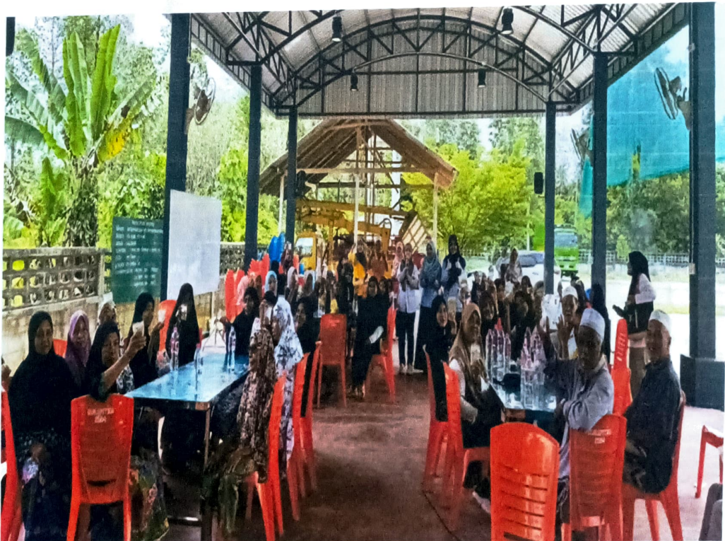
แจกยาพอกเข้าสมุนไพรมแก่ผู้เข้าร่วมโครงการ