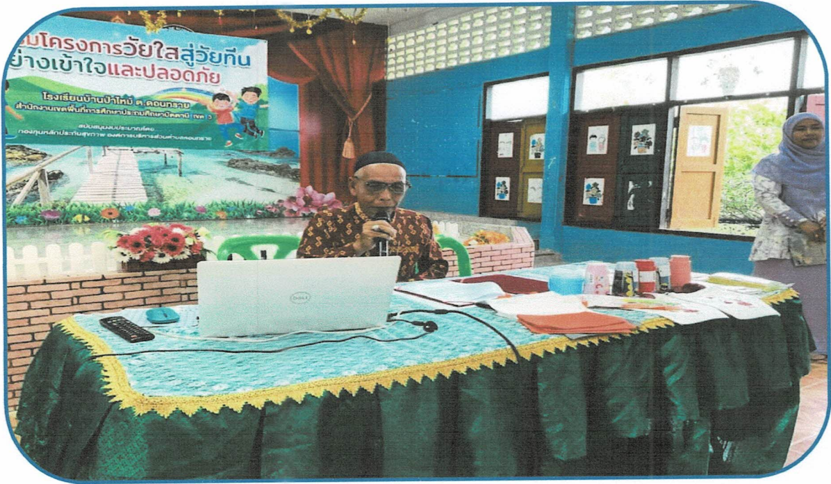
ภาพประกอบการจัดกิจกรรมโครงการวัยใสสู้วัยทึบอย่างเข้าใจและปลอดภัย