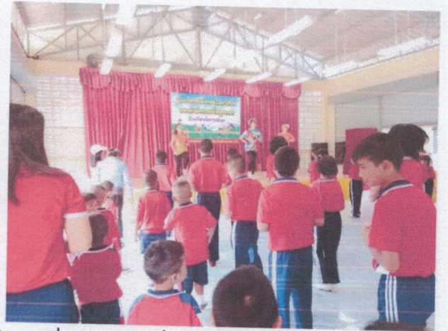
กิจกรรมกระตุ้นด้วยกิจกรรมทางกาย ให้มีความตื่นตัว พร้อมทั้งจะเรียนรู้