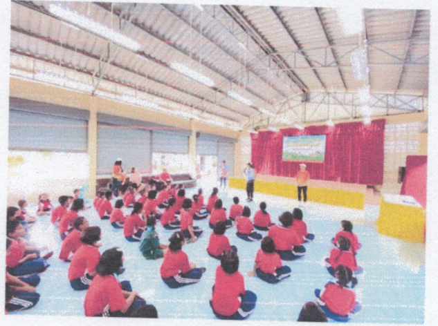
ให้ความรู้การออกกำลังกาย โดยผ่านดนตรีกระตุ้นเพื่อสร้างสุนทรีภาพ