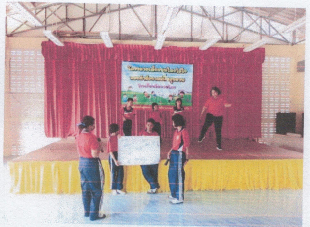
ถอดบทเรียน การออกกำลังกาย