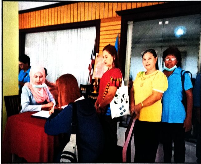
ภาพที่ ๑ ผู้เข้าร่วมอบรมเซ็นชื่อลงทะเบียน โครงการเฝ้าระวัง ควบคุมและป้องกันการแพร่ระบาดของโรคฉี่หนู (Leptospirosis)

โครงการเฝ้าระวัง ควบคุมและป้องกันการแพร่ระบาดของโรคฉี่หนู (Leptospirosis) วันที่ ๑๕ สิงหาคม ๒๕๖๖