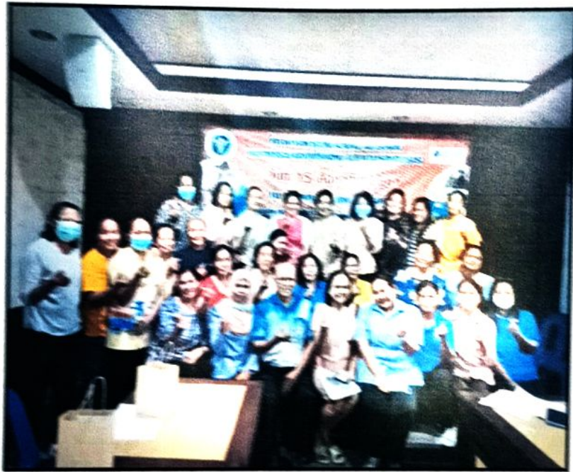
ภาพที่ ๗ ผู้เข้าร่วมโครงการและวิทยากรร่วมถ่ายภาพหลังเสร็จสิ้นกิจกรรม