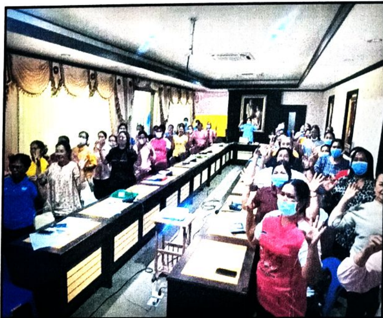
ภาพที่ ๖ ผู้เข้าร่วมโครงการรับร่วมทำกิจกรรมนันทนาการ โครงการเฝ้าระวัง ควบคุมและป้องกันการแพร่ระบาดของโรคฉี่หนู (Leptospirosis)