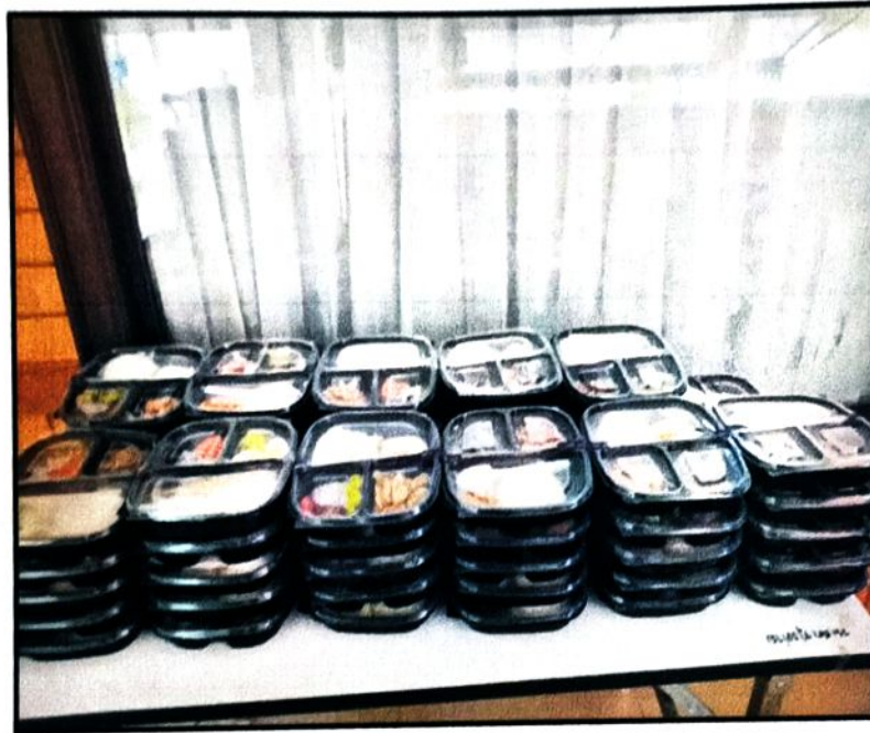
ภาพที่ ๙ อาหารกลางวัน โครงการเฝ้าระวัง ควบคุมและป้องกันการแพร่ระบาดของโรคฉี่หนู (Leptospirosis)