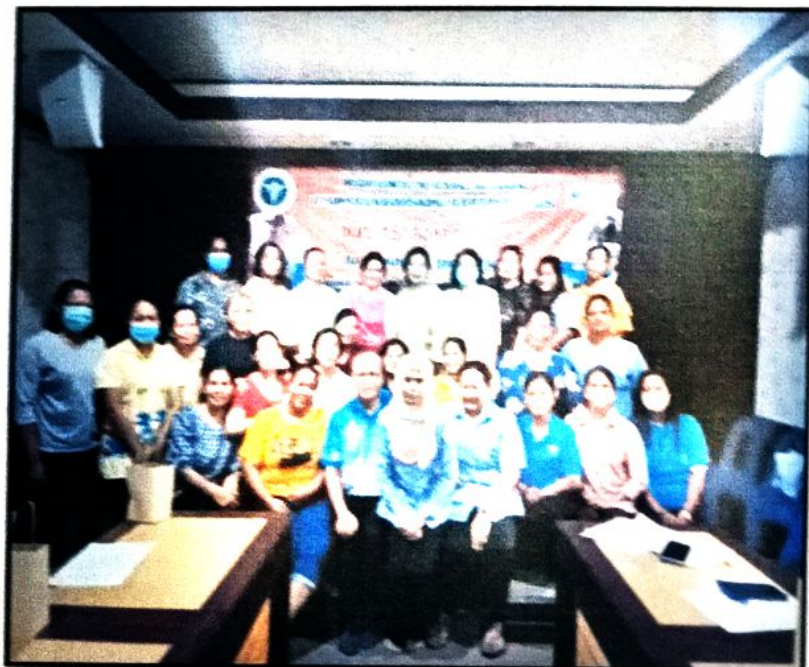
ภาพที่ ๘ ร่วมถ่ายภาพหลังเสร็จสิ้นกิจกรรม