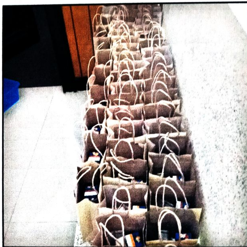
ภาพที่ ๑๐ อาหารว่างและเครื่องดื่ม โครงการเฝ้าระวัง ควบคุมและป้องกันการแพร่ระบาดของโรคฉี่หนู (Leptospirosis)