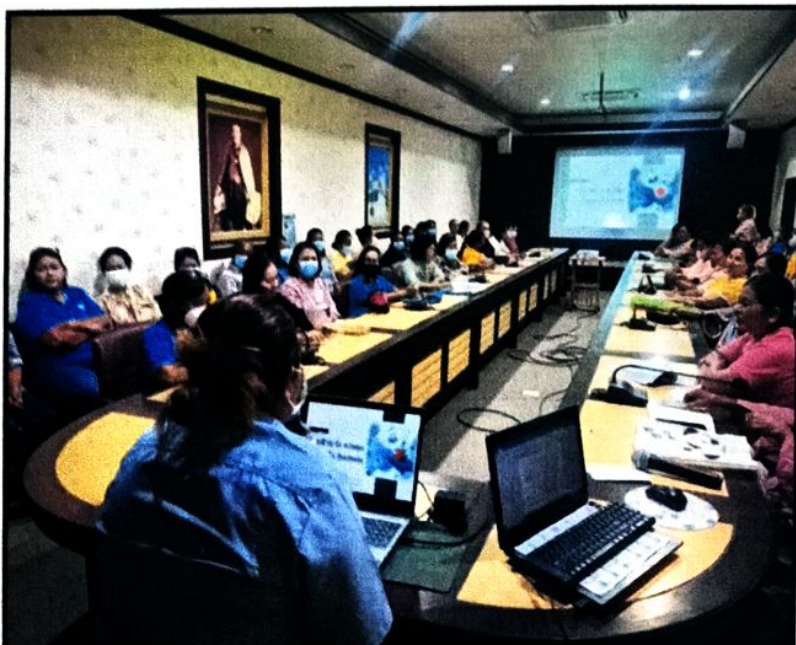
ภาพที่ ๔ ผู้เข้าร่วมโครงการรับฟังการบรรยายให้ความรู้ เรื่องเฝ้าระวัง ควบคุมและป้องกันการแพร่ระบาดของโรคฉี่หนู (Leptospirosis)