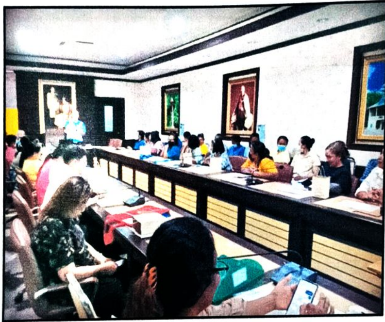
ภาพที่ ๕ ผู้เข้าร่วมโครงการรับฟังการบรรยายให้ความรู้ เรื่องเฝ้าระวัง ควบคุมและป้องกันการแพร่ระบาดของโรคฉี่หนู (Leptospirosis)