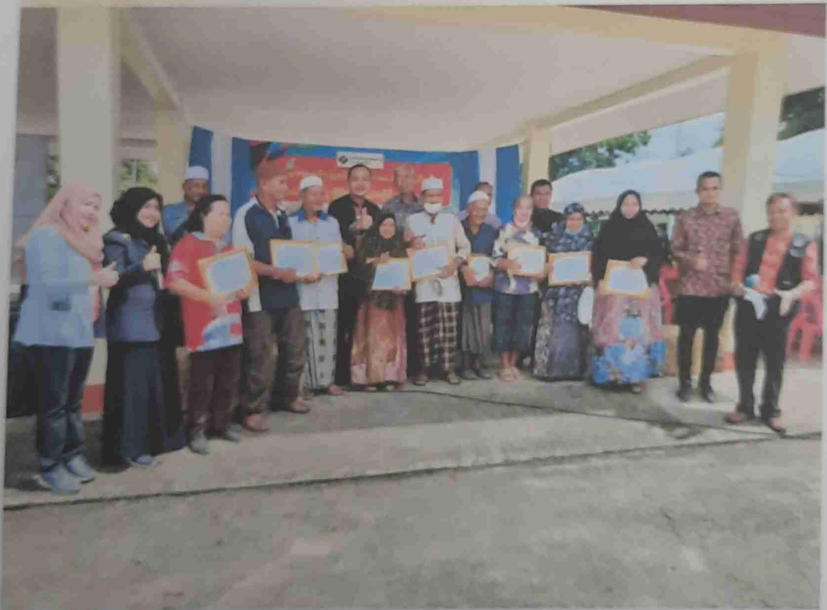
มอบประกาศนียบัตรแก่ผู้สูงอายุดีเด่น