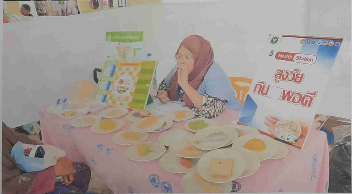
ประเมินคัดกรอง ๙ ด้านและให้ความรู้เรื่องโภชนาการ