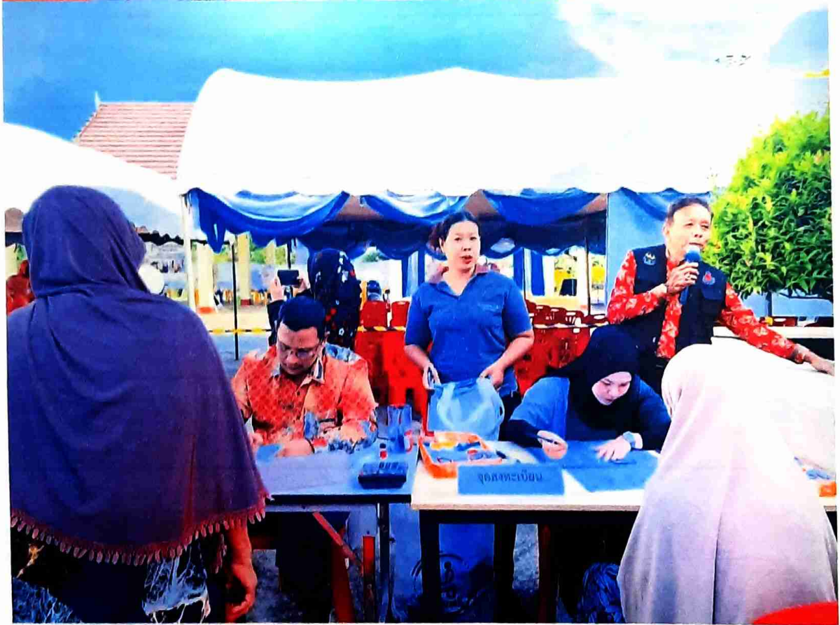
ลงทะเบียนผู้เข้าร่วมโครงการ