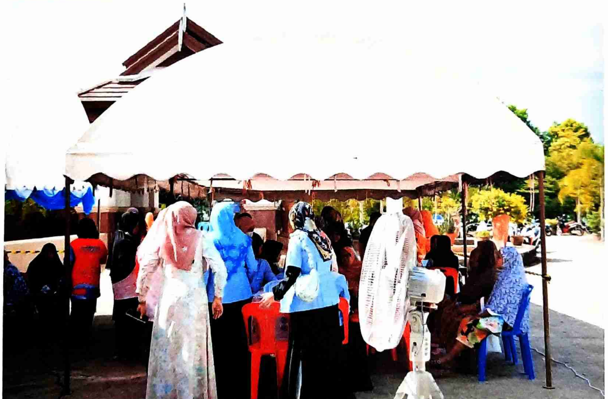
มอบประกาศนียบัตรแก่ผู้สูงอายุดีเด่น