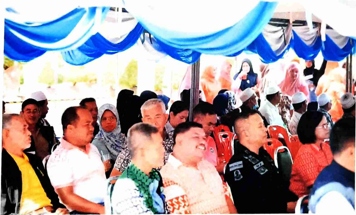
บรรยายกากระหว่างการดำเนินงาน