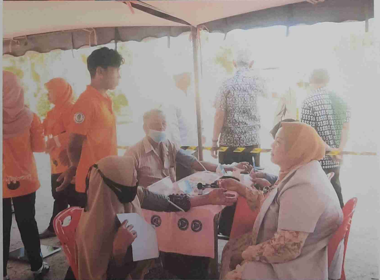
ตรวจสอบสัญญาฉบับเพื่อประเมินภาวะสุขภาพ