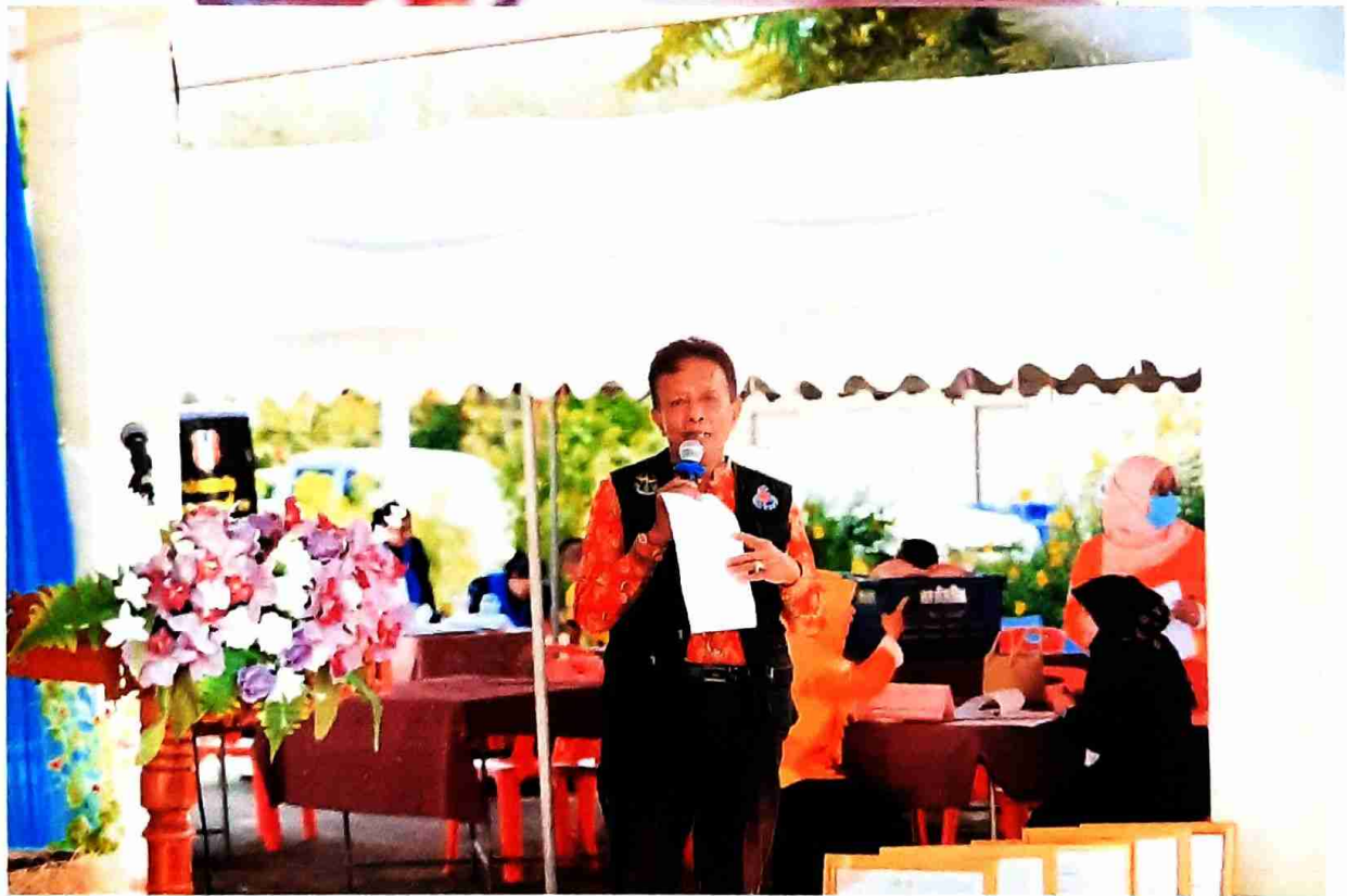
บรรยายให้ความรู้ในเรื่องการดูแลตนเองของผู้สูงอายุ