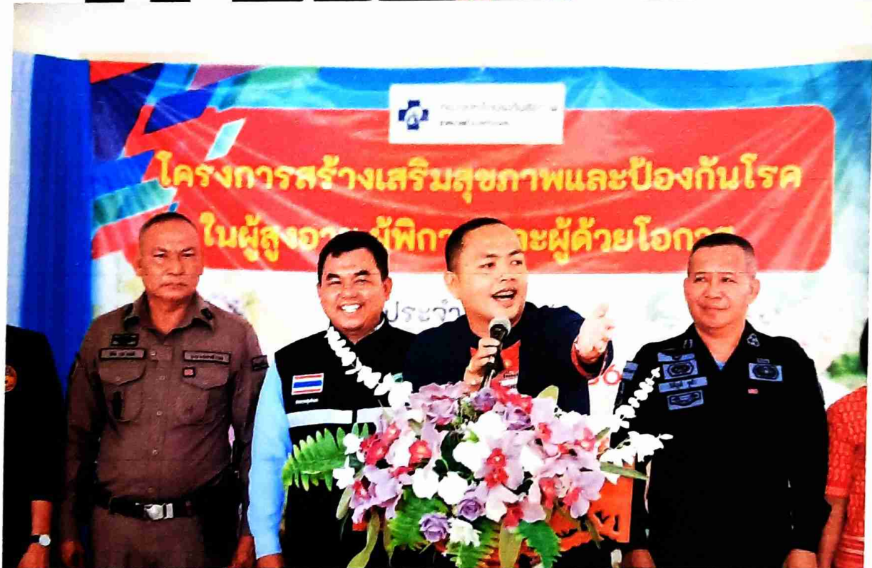
กล่าวรายงานและกล่าวเปิดกิจกรรมโครงการ