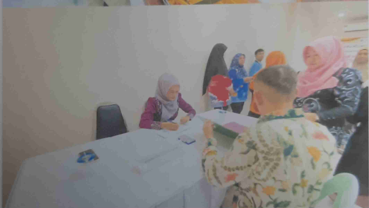
ลงทะเบียนเข้าร่วมกิจกรรมโครงการ