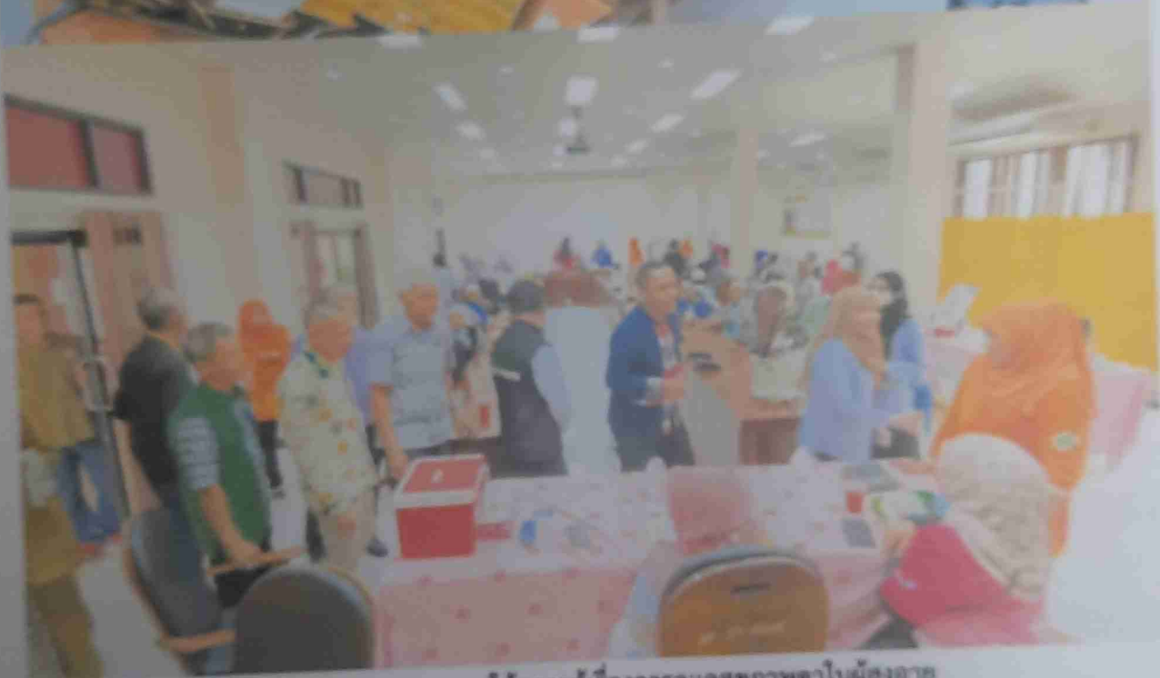
บรรยากาศการบรรยายให้ความรู้เรื่องการดูแลสุขภาพตาในผู้สูงอายุ