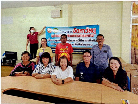
ภาพการจัดซื้อวัสดุ อุปกรณ์ ครุภัณฑ์ทางการแพทย์เพื่อการดูแลสุขภาพผู้สูงอายุที่มีภาวะพึ่งพิง และบุคคลอื่นที่มีภาวะพึ่งพิง