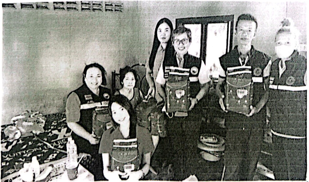
ลาเนาถูกต้อง / นครินทร์ เกษรินทร์ บางลาเนาวิรัตน์ เดชวิรัตน์