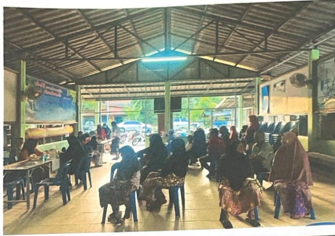
ภาพโครงการคัดกรองโรคเบาหวานและความดันโลหิตสูง โดย อสม.ปี ๒๕๖๖