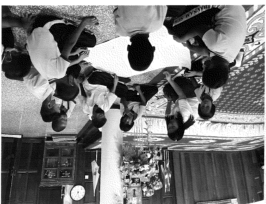
ក្រុមការងារ រៀនសូត្រ ក្នុងបន្ទប់សិក្សាសាលា