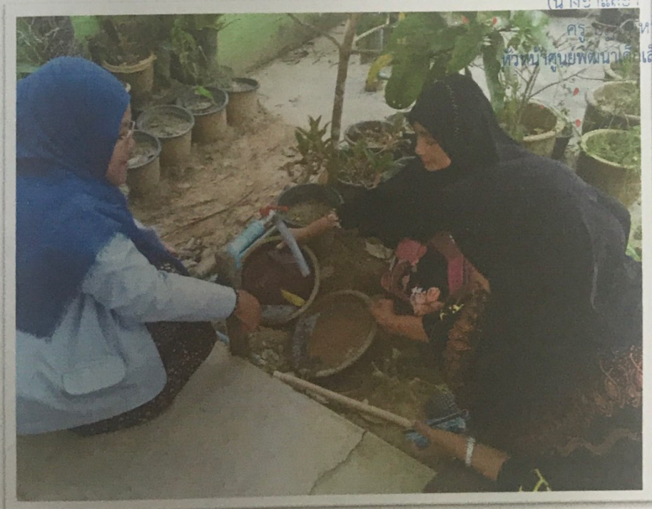
เจ้าหน้าที่ รพ.สต. กวระ ให้ความรู้กับผู้ปกครองวิธีการกำจัดแหล่งเพาะพันธุ์ยุง