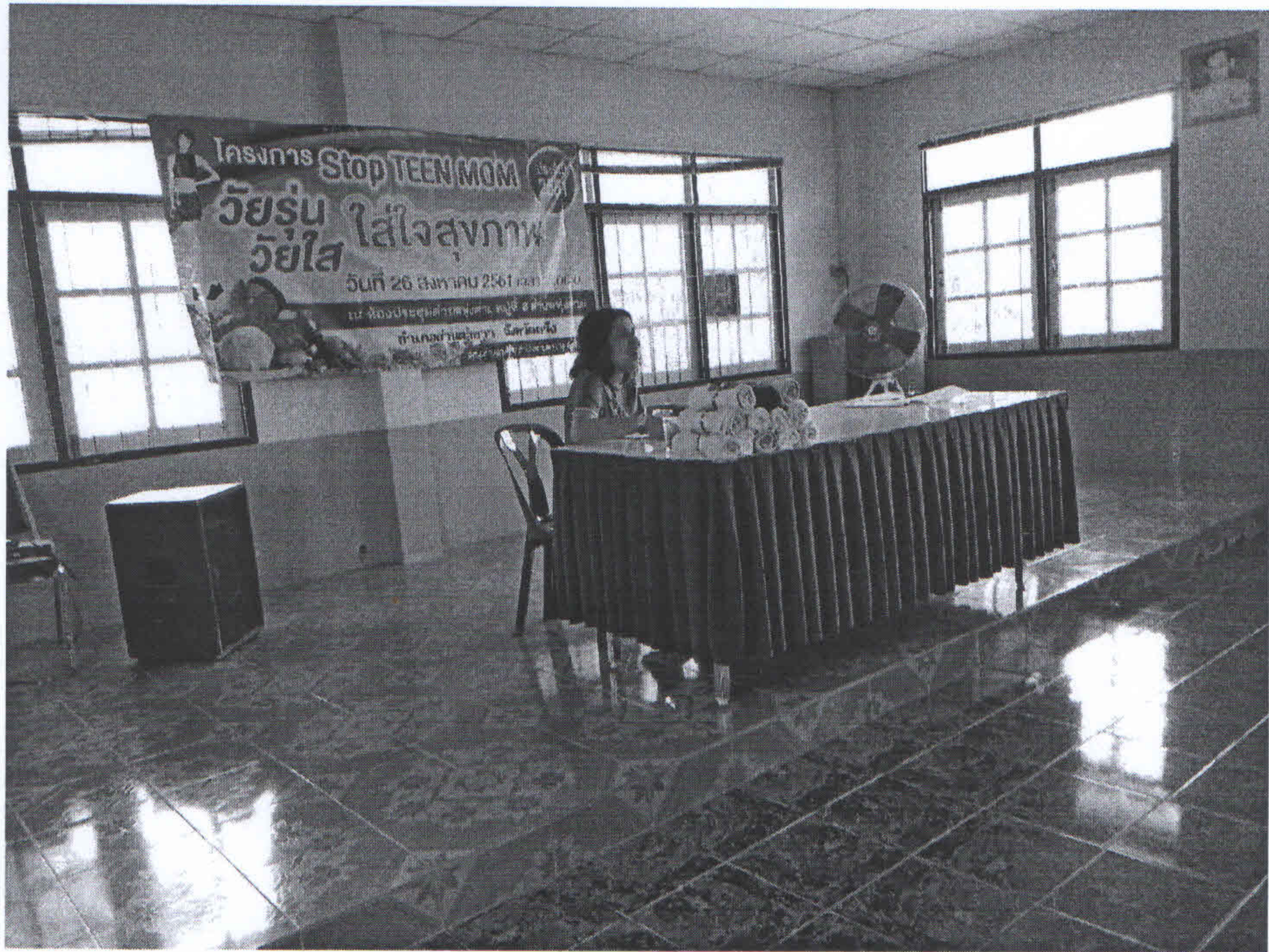
วิทยากรให้ความรู้เรื่องวัยรุ่น ไร้ใจ ไร้ใจสุขภาพ