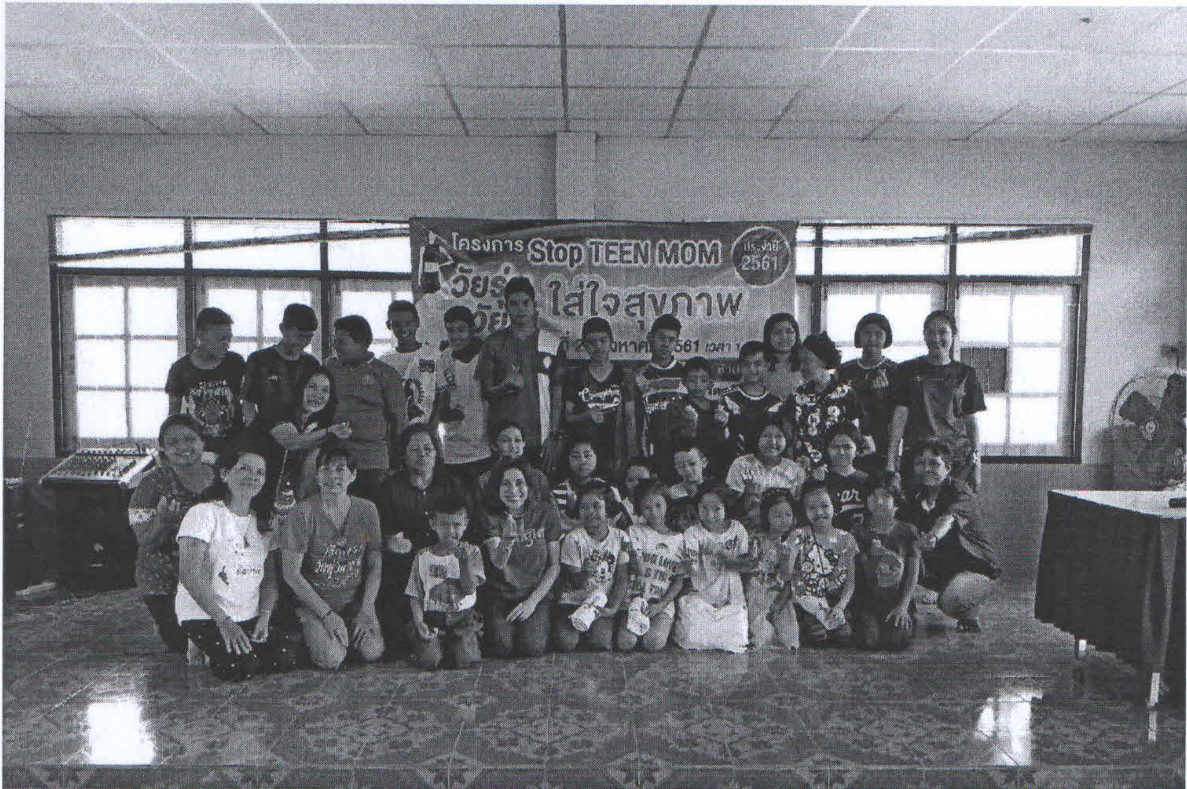
ผู้เข้าร่วมอบรมรับฟังความรู้เรื่องวัยรุ่น วัยใส ใส่ใจสุขภาพ