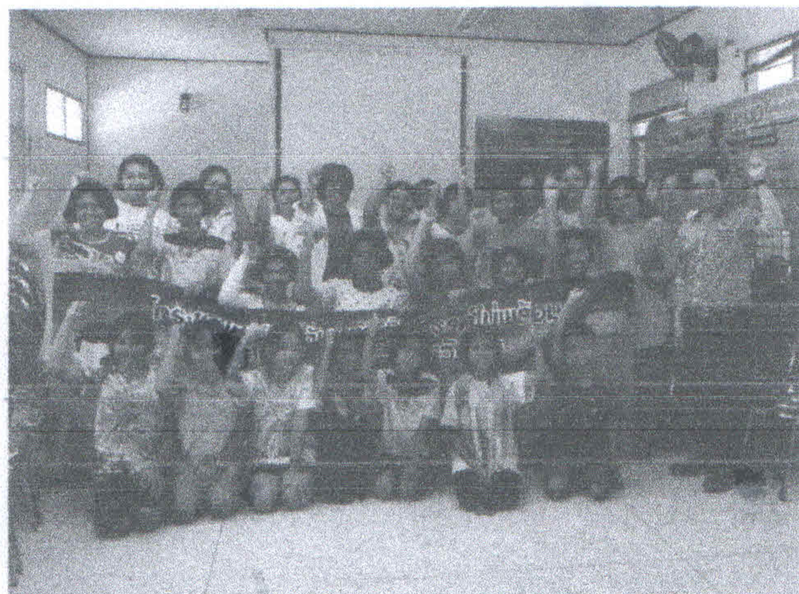
วันที่ 3 อบรมให้ความรู้และทำความเข้าใจแก่เด็กและเยาวชนร่วมกับผู้ปกครอง(วันที่ 8 กันยายน 2561)