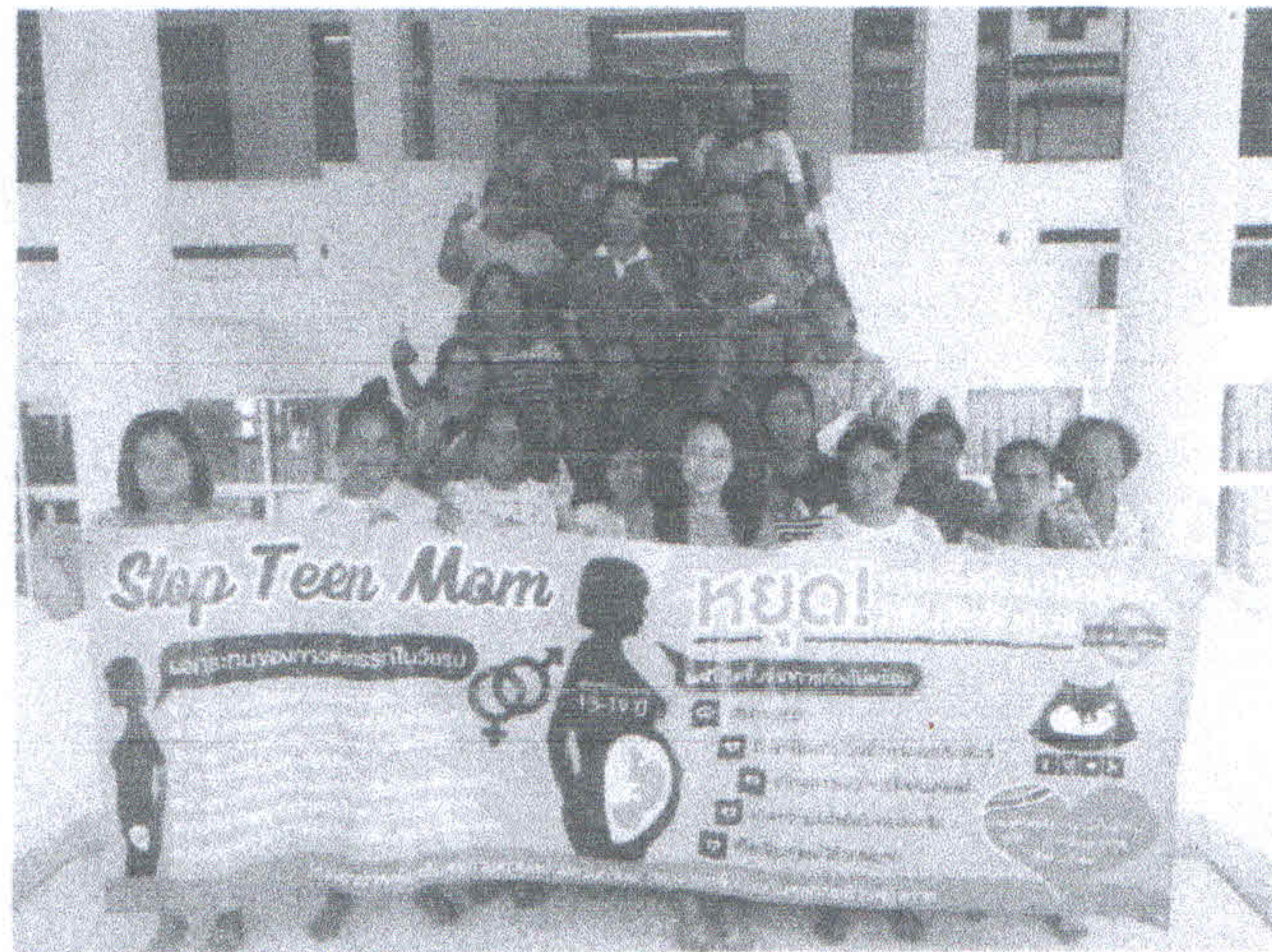
วันที่ 2 อบรมให้ความรู้แก่ผู้ปกครอง (วันที่ 7 กันยายน 2561)