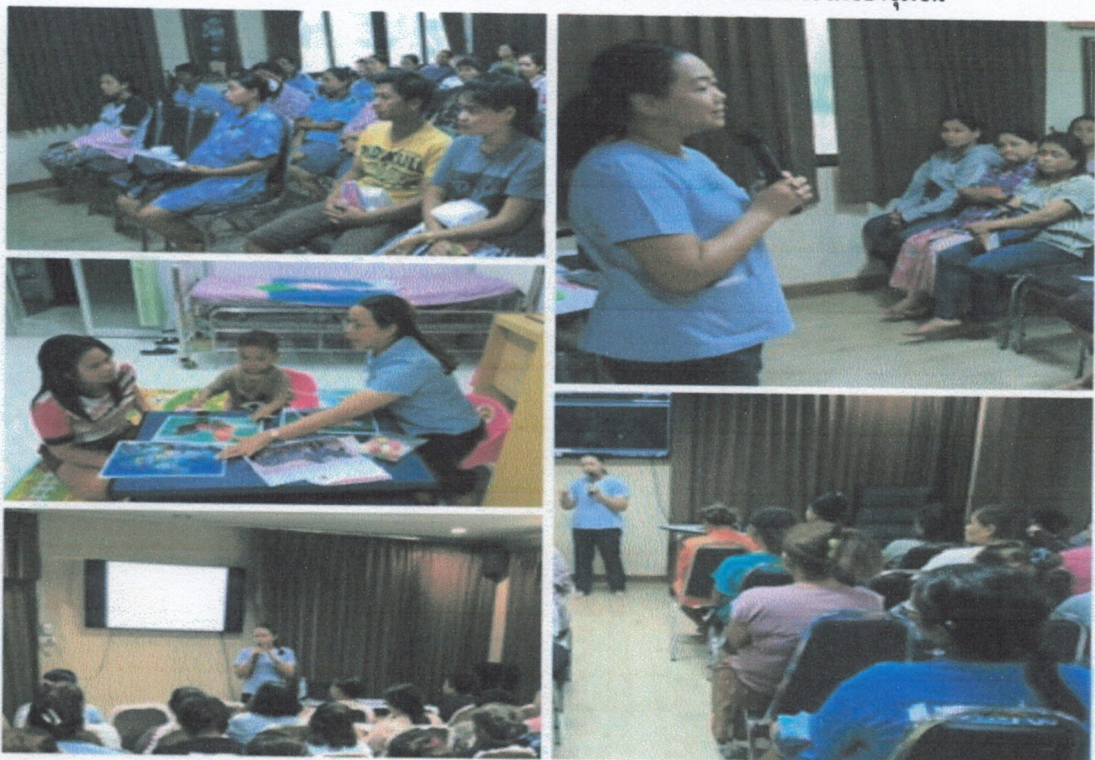
ภาพกิจกรรมโครงการส่งเสริมพัฒนาการเด็ก ๐-๕ ปี โดยการมีส่วนร่วมของชุมชน