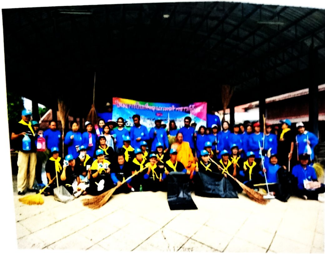
พวกเรา ร่วมสร้างสรรค์สังคม ทำความดีใจได้ทุก