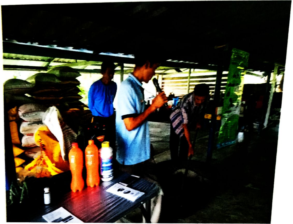
เข้าฐานศึกษาเรียนรู้การปลูกผักอินทรีย์เพื่อสุขภาพ