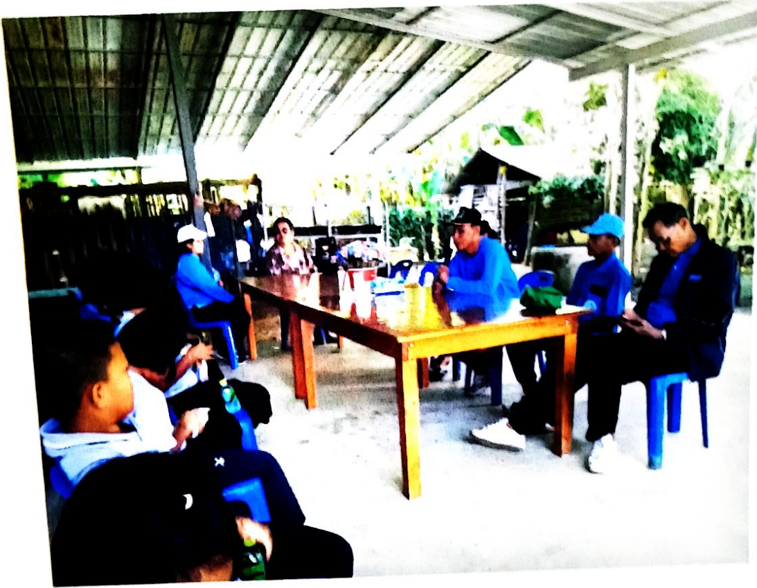
เข้าฐานเรียนรู้สารความสุขภาพ