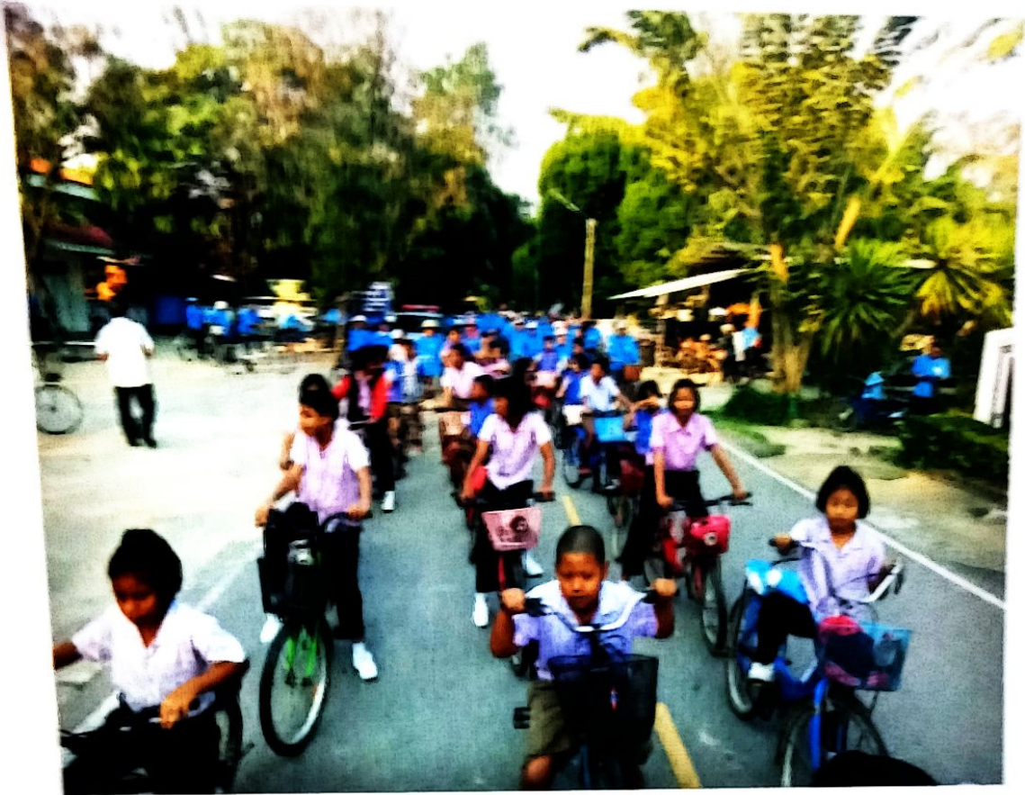
ນັກ ນັກ ນັກ ໄປສູ່ສູນ