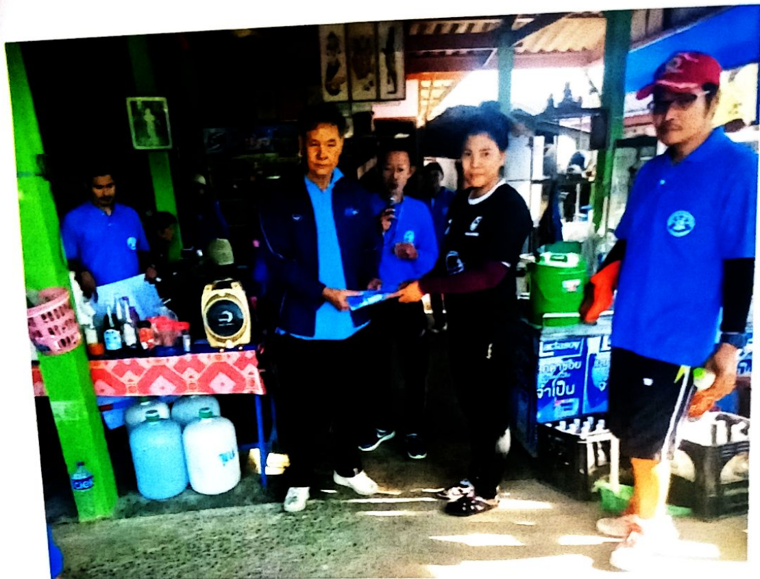
พวกเราไปเยี่ยมชมแหล่งเรียนรู้กันทุกแหล่งของตำบลบ้านในคง