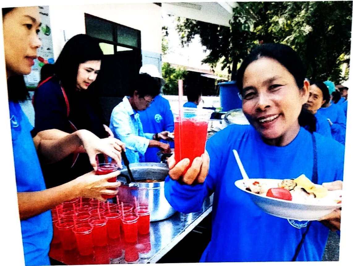
ตลอดปีงบประมาณ เราเป็นด้วยกัน เราสร้างสรรค์สังคมด้วยกัน เรากินด้วยกัน เพื่อส่งเสริมสุขภาพกาย และสุขภาพใจ