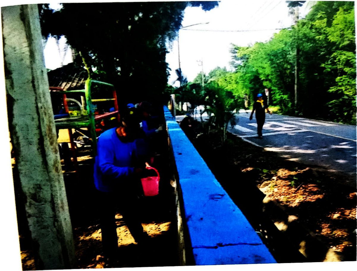
เพื่อสังคม เพื่อชุมชน เพื่อส่วนรวม พวกเราชาวปิ่น สุ์ สุ์