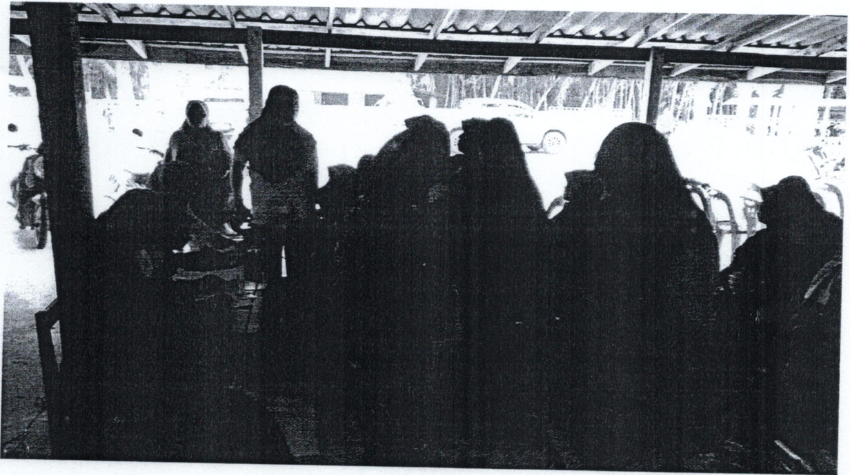
1.กิจกรรม อบรมให้ความรู้เรื่อง อาหาร อารมณ์