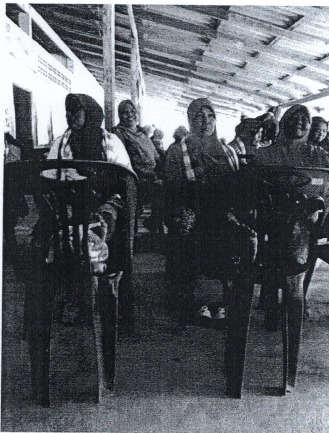
5. กิจกรรมประเมินภาวะเข้าเสื่อม และพอกเข้าด้วยสมุนไพรแก่ผู้เข้าร่วมกิจกรรม