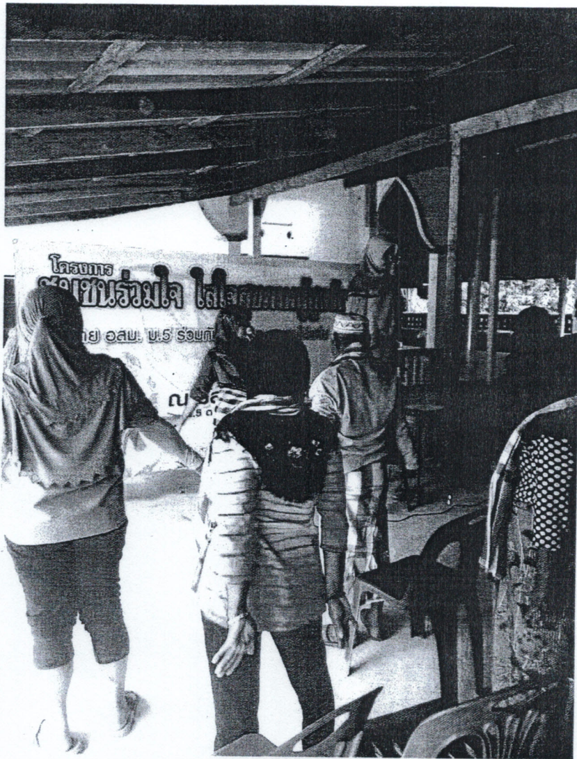
3.กิจกรรมสาธิตการออกกำลังกายโดยวิธี มณีเวช