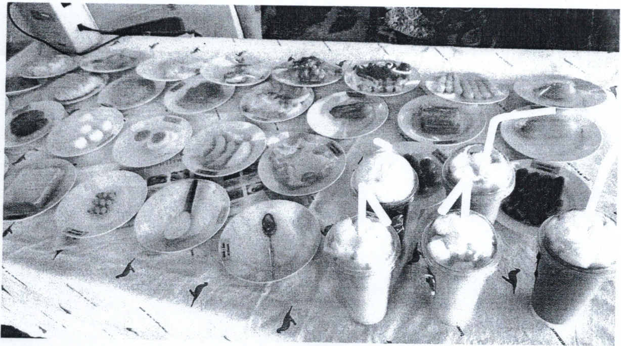
โมเดลสาธิตอาหารสำหรับผู้สูงอายุที่สามารถรับประทานได้ในแต่ละมื้อ