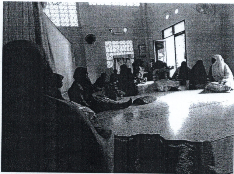
4. กิจกรรมให้ความรู้การใช้ชีวิตในวัยสูงอายุตามหลักศาสนาอิสลาม