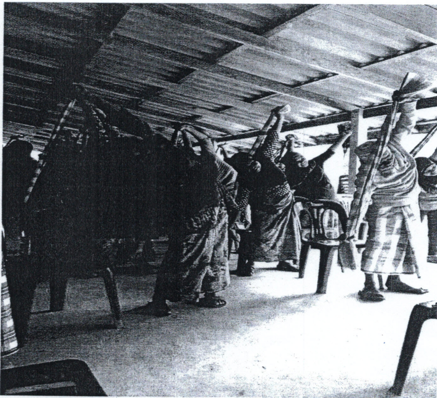
2. กิจกรรมสาธิตการออกกำลังกายด้วยผ้าขาวม้า