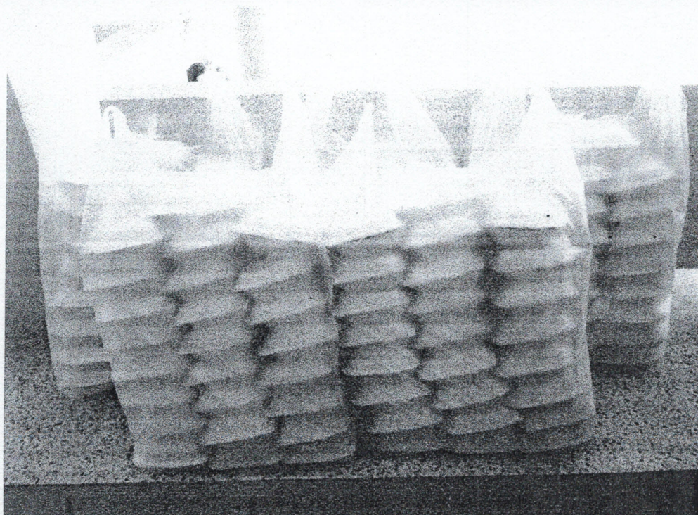
อาหารว่างและเครื่องดื่ม