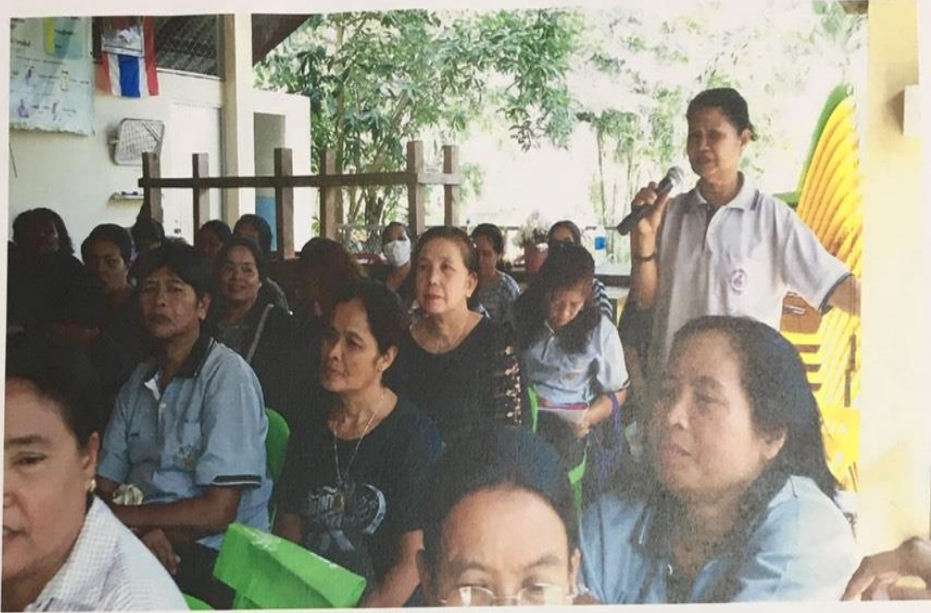
ภาพกิจกรรมโครงการคนคลองหลายทางไกลมะเร็งปากมดลูก