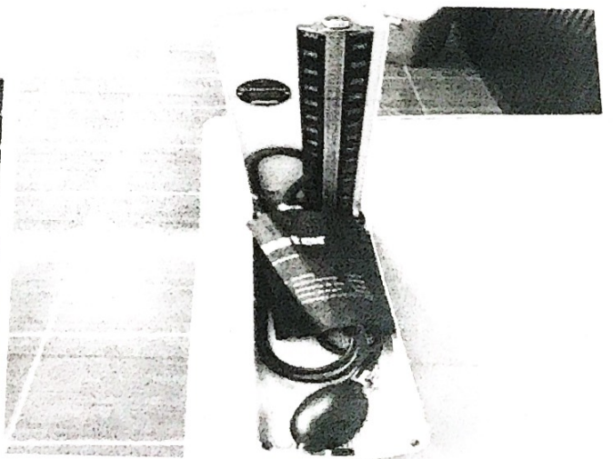
การติดตามประเมินการเฝ้าระวังพฤติกรรมสุขภาพในกลุ่มเสี่ยงและจัดซื้อเครื่องวัดความดันแบบปรอท