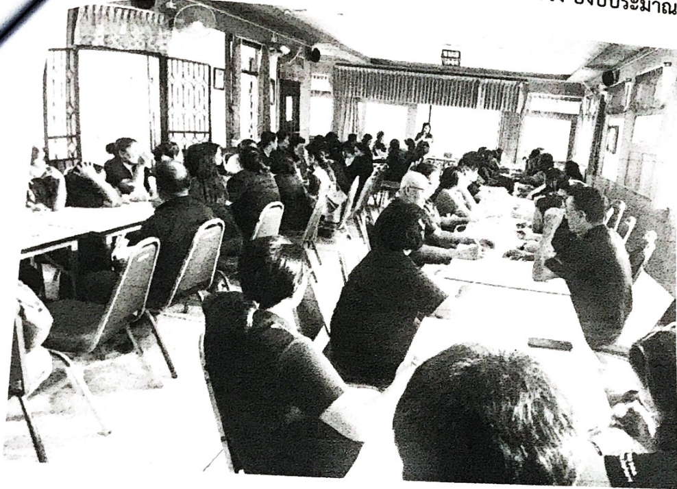
กิจกรรมอบรมให้ความรู้ปรับเปลี่ยนพฤติกรรมสุขภาพประชาชนกลุ่มเสี่ยงโรคเรื้อรัง

กิจกรรมปรับเปลี่ยนพฤติกรรมสุขภาพประชาชนกลุ่มเสี่ยงโรคเรื้อรัง ปีงบประมาณ 2562