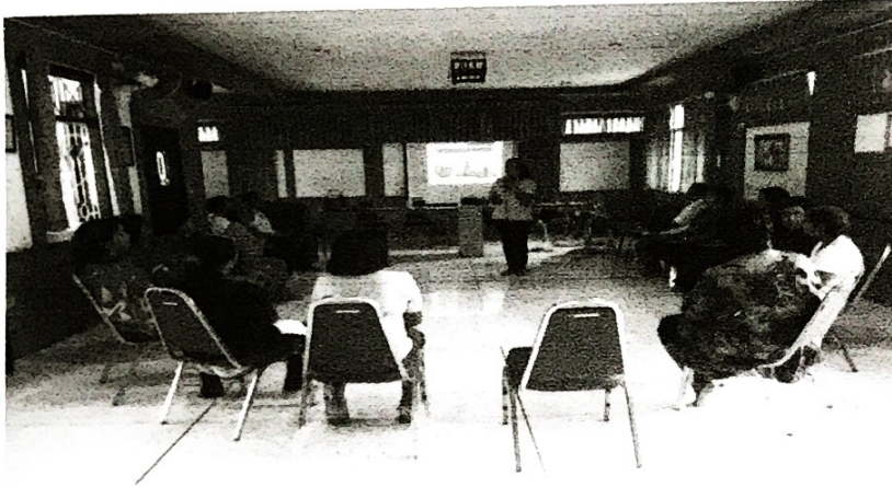
กิจกรรมอบรมให้ความรู้แก่กลุ่มเสี่ยงโรคซึมเศร้า