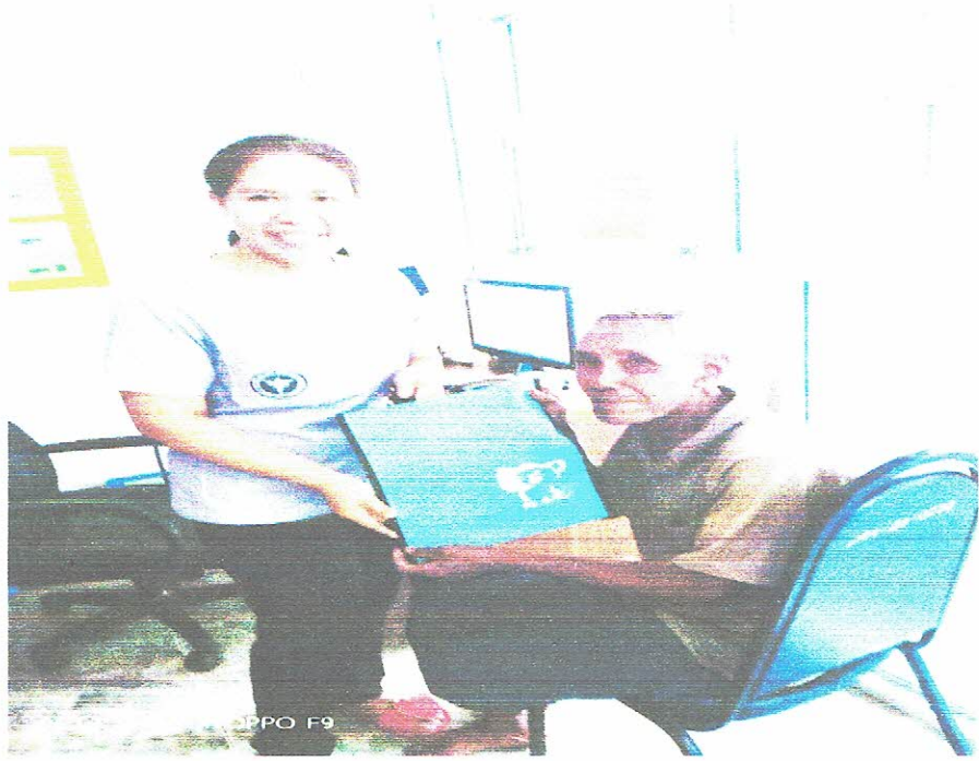
๔. ติดตามเยี่ยมบ้านทุกเดือน ประเมินอาการและเสริมสร้างกำลังใจแก่ผู้มีภาวะแทรกซ้อน