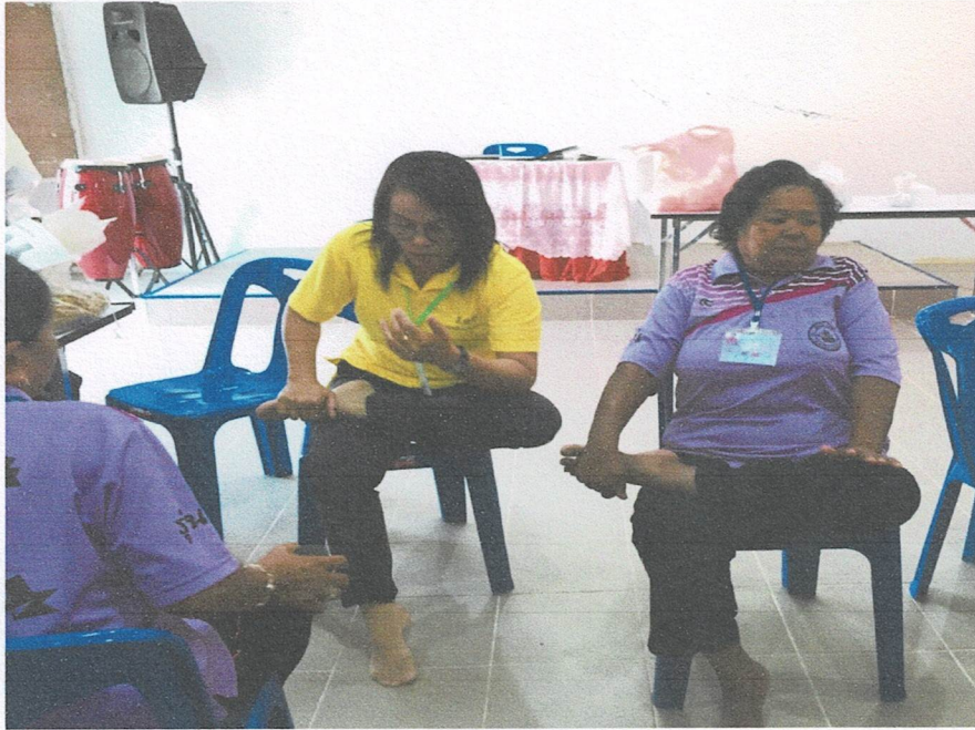
กิจกรรมสอนการดูแลสุขภาพด้านกายานามัยด้วยท่ามณีเวช