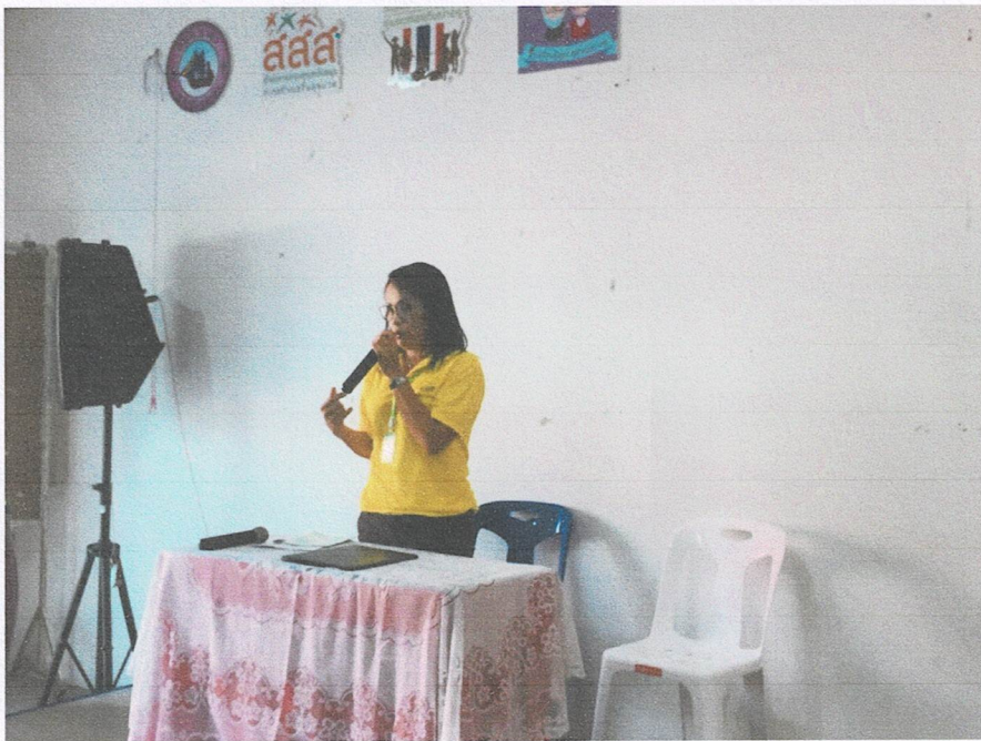
กิจกรรมบรรยายพิเศษหัวข้อ “ธรรมานามัยกับการดูแลสุขภาพด้วยการแพทย์แผนไทยแบบองค์รวม”