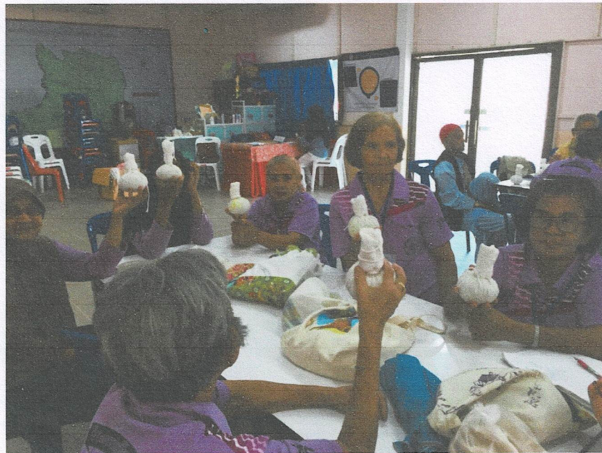
กิจกรรมตรวจวิเคราะห์ธาตุเจ้าเรือนและจุดอ่อนของสุขภาพในแต่ละธาตุ และฝึกสุขภาพจิต สุขภาพใจที่ดี