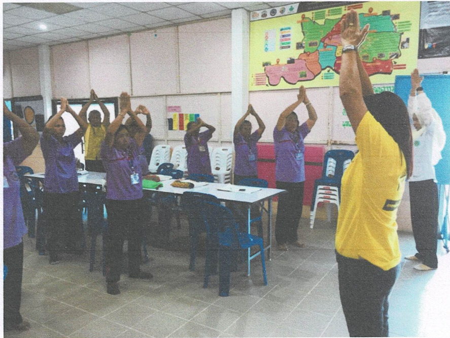
ร่วมแลกเปลี่ยนรู้เรื่อง “ศาสตร์การดูแลรักษาสุขภาพผู้สูงอายุด้วยการแพทย์แผนไทยแบบองค์รวมตามหลัก ธรรมานามัย”