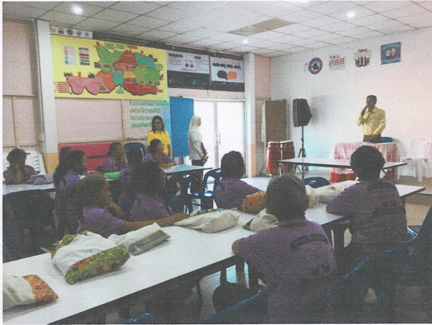
เปิดพิธีโดยรองนายกองค์การบริหารส่วนตำบลบาละ