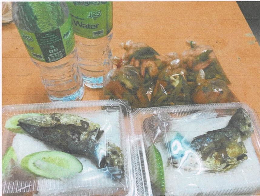
อาหารกลางวัน