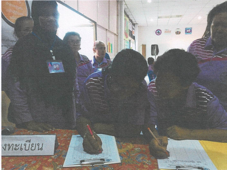
ลงทะเบียนเข้าร่วมกิจกรรมฯ