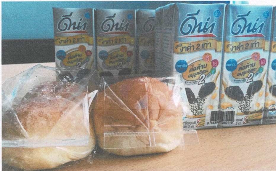
อาหารว่างและเครื่องดื่ม