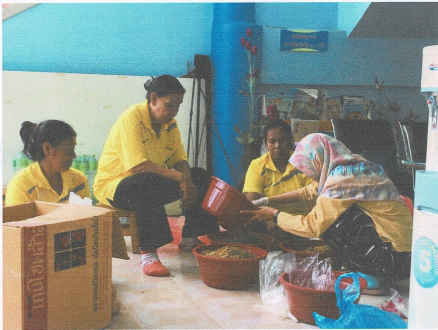
เตรียมอุปกรณ์การทำลูกประคบก่อนดำเนินโครงการ