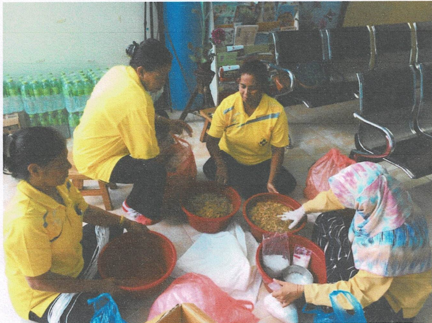
เตรียมอุปกรณ์การทำลูกประคบก่อนดำเนินโครงการ