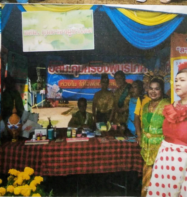
ชุมชนรณรงค์สุขภาพ ของชุมชนและหน่วยงานเครือข่าย