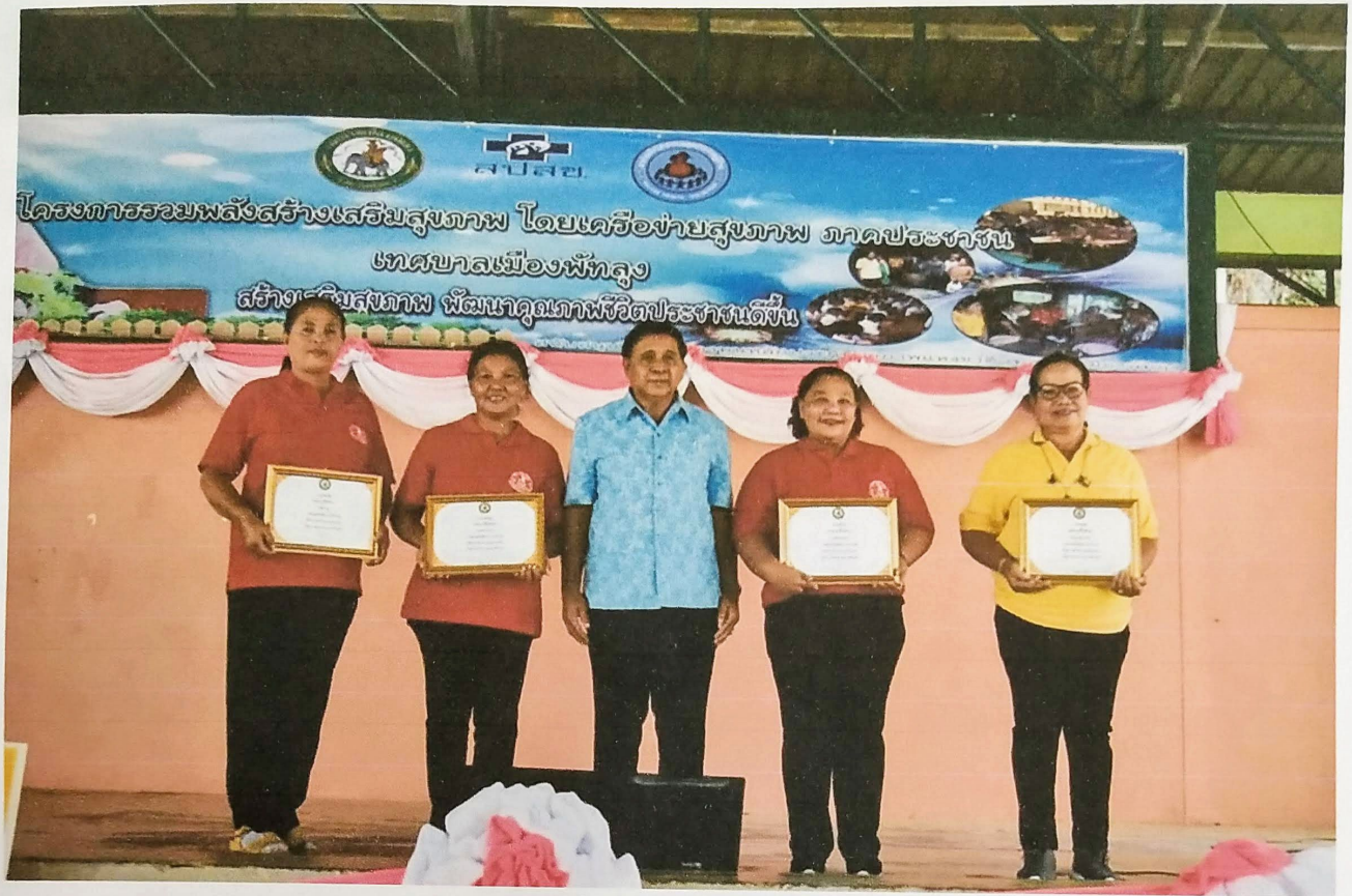
ประกาศนียบัตรชุมชนปลอด โรคไข้เลือดออก