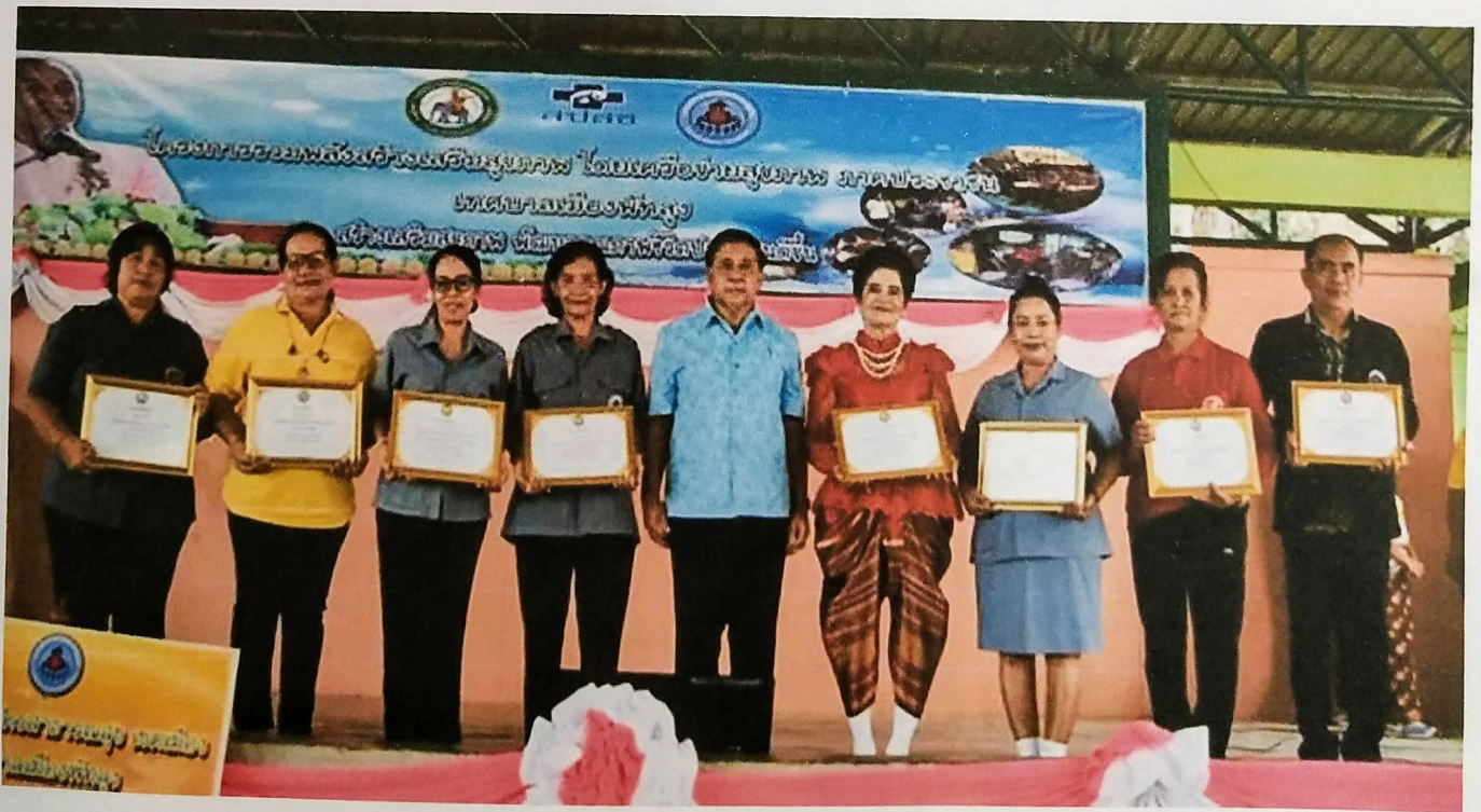
ประกาศนียบัตร อสม.ดีเด่นเทศบาลเมืองพัทลุง