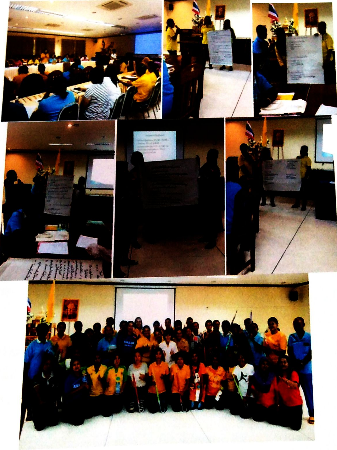
กิจกรรมการแลกเปลี่ยนเรียนรู้ของ อสม. ที่รพ. ครั้งที่ 2