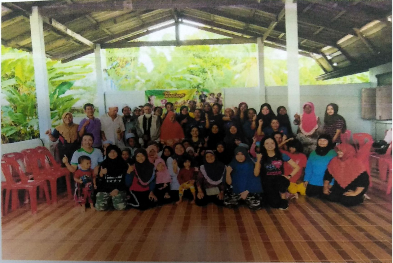
ภาพกิจกรรมโครงการ ๓ กลุ่มวัยใส่ใจสุขภาพ รัชการออกกำลังกาย