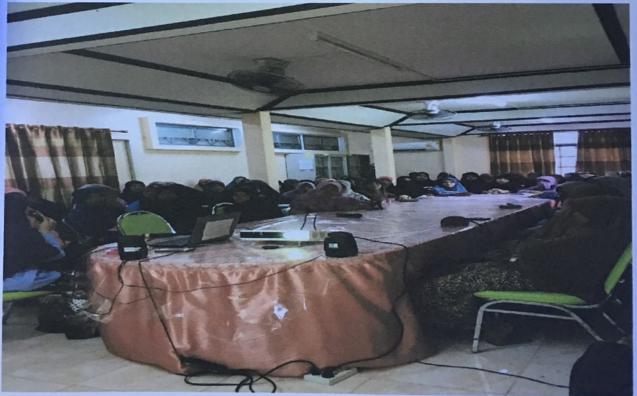
ขอบคุณทุกคนที่ตั้งใจฟังนะคะ