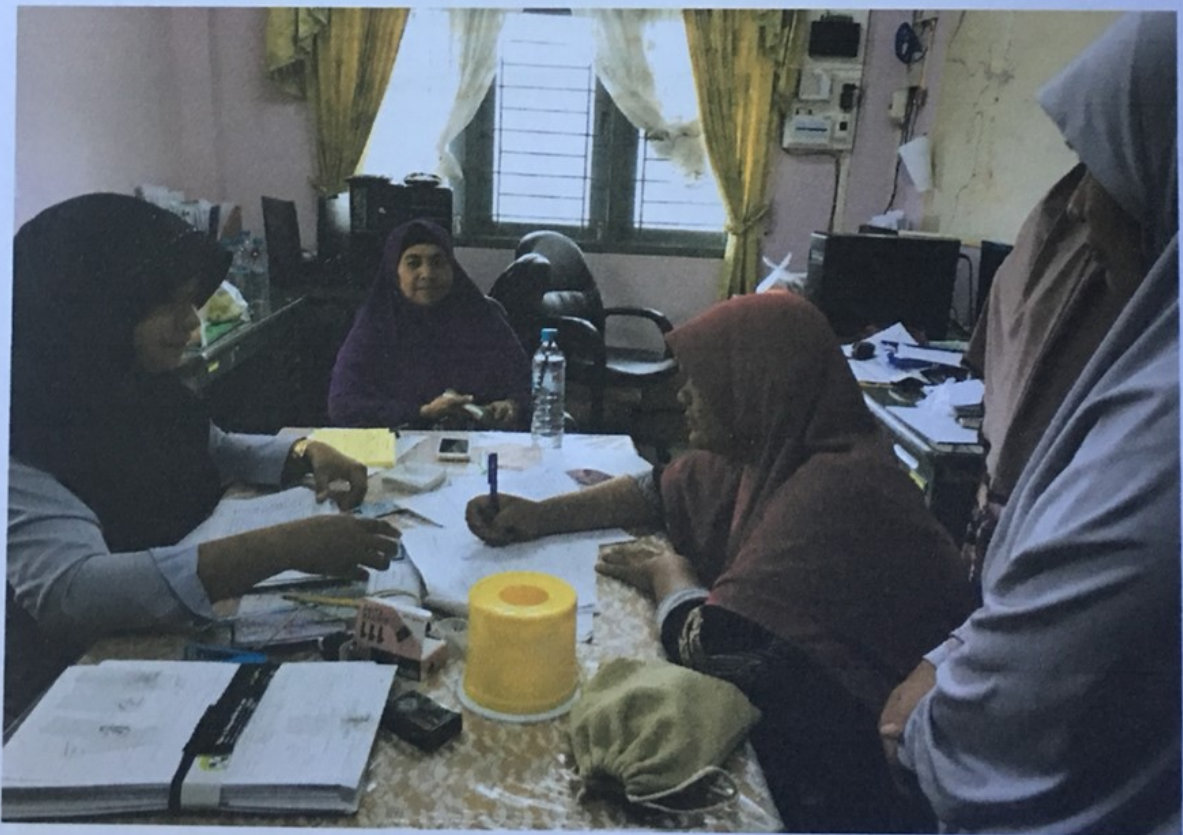
ลงทะเบียนก่อนเข้ารับการอบรมและตรวจมะเร็งปากมดลูก