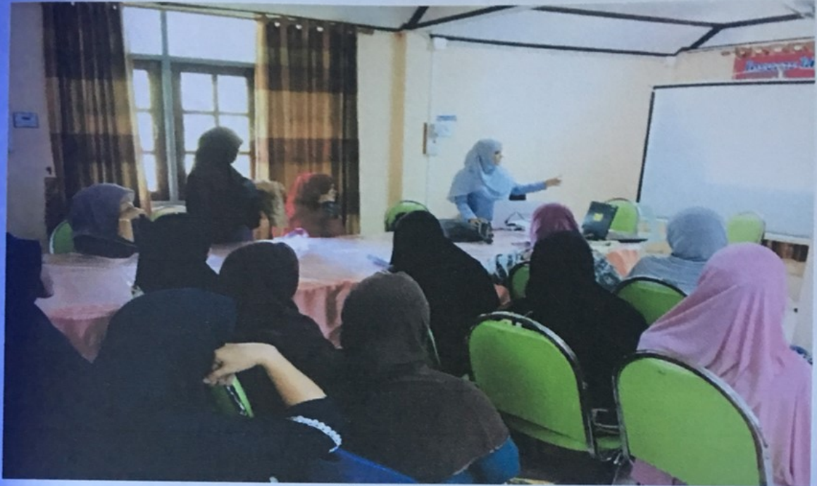
วิทยากรให้ความรู้แก่ผู้เข้ารับการอบรม