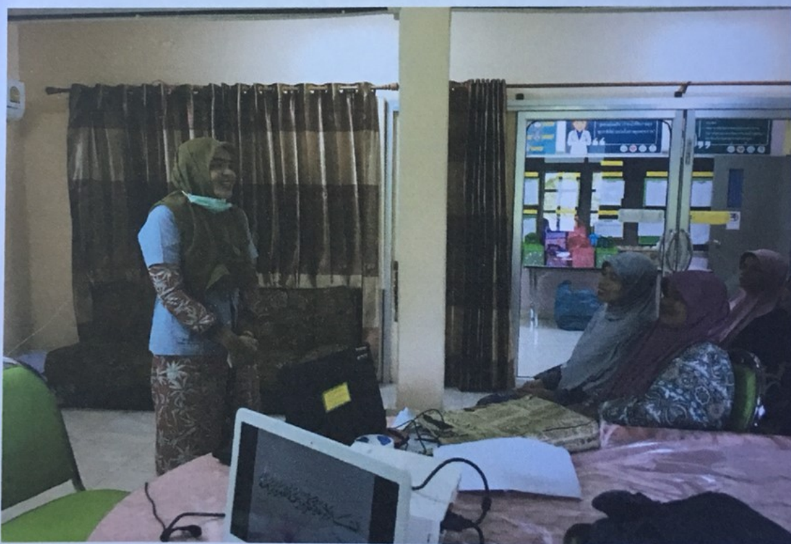
เจ้าหน้าที่ตรวจมะเร็งปากมดลูกมาร่วมพูดคุยร่วมแลกเปลี่ยน