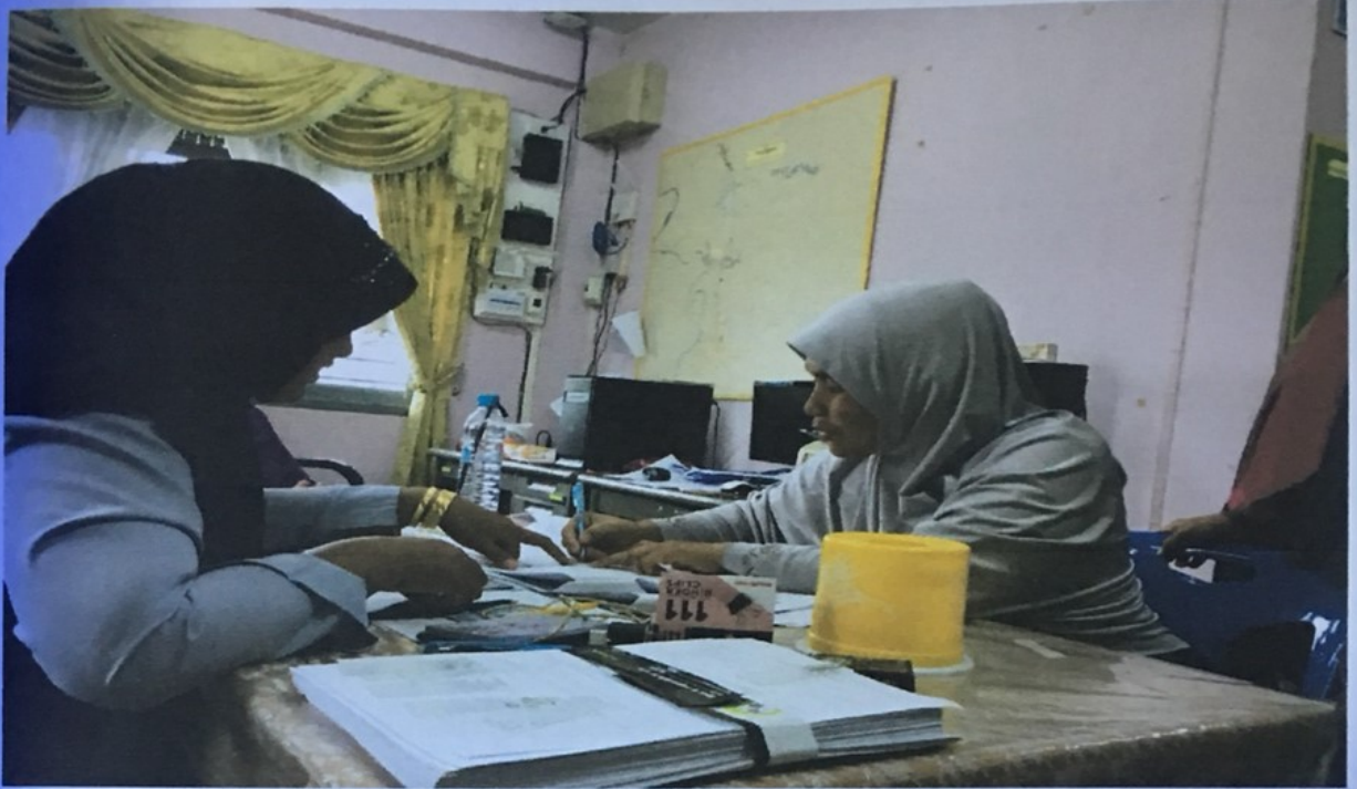
ลงทะเบียนก่อนเข้ารับการอบรมและตรวจมะเร็งปากมดลูก