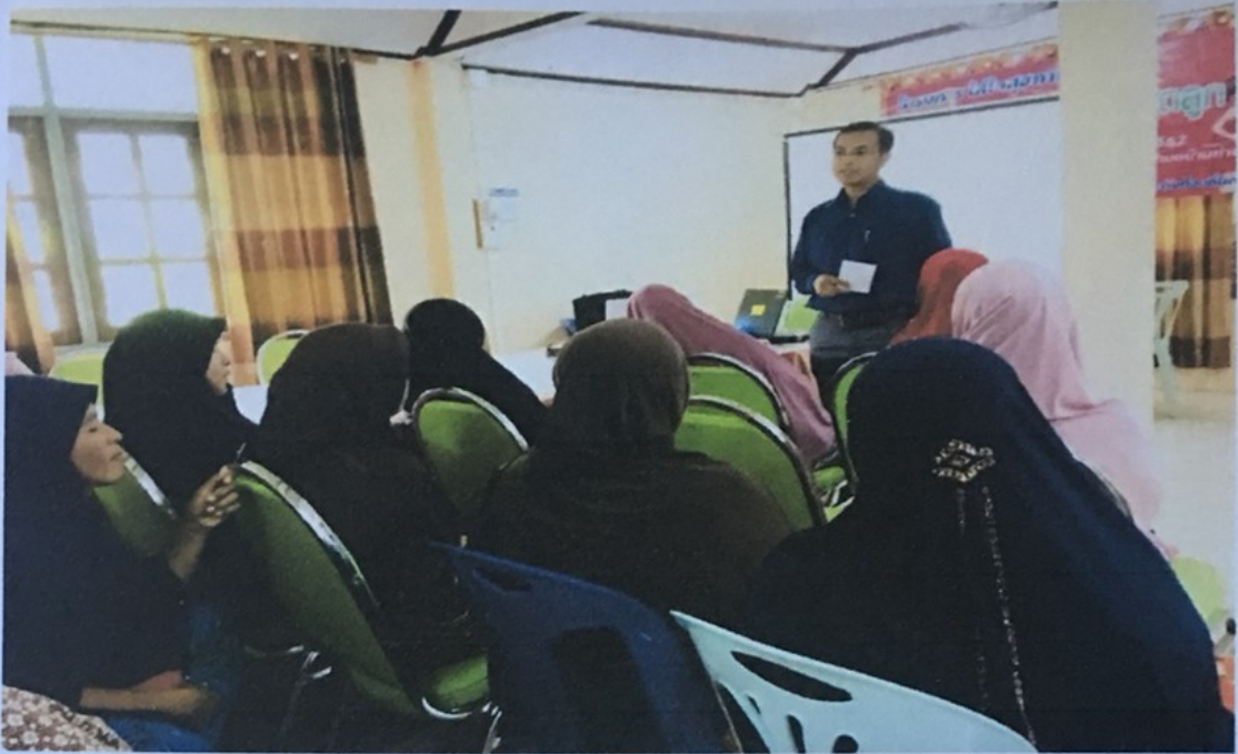
ท่านสาธารณสุขอำเภอร่วมพบปะพูดคุยกับผู้เข้ารับการอบรม