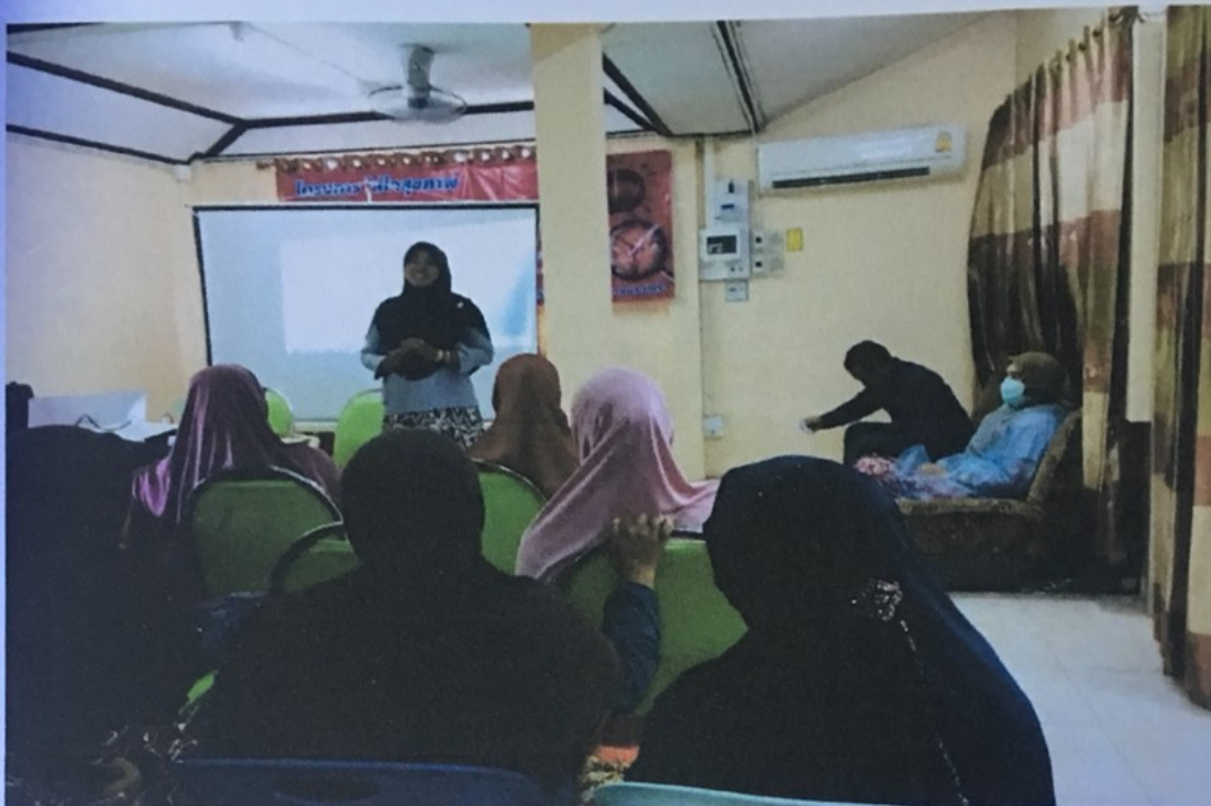
เจ้าหน้าที่ผู้รับผิดชอบโครงการกล่าวเปิดพิธี