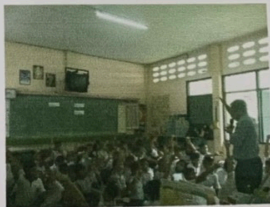
ให้ความรู้แก่นักเรียน ร.ร.วัดท่าข้าม