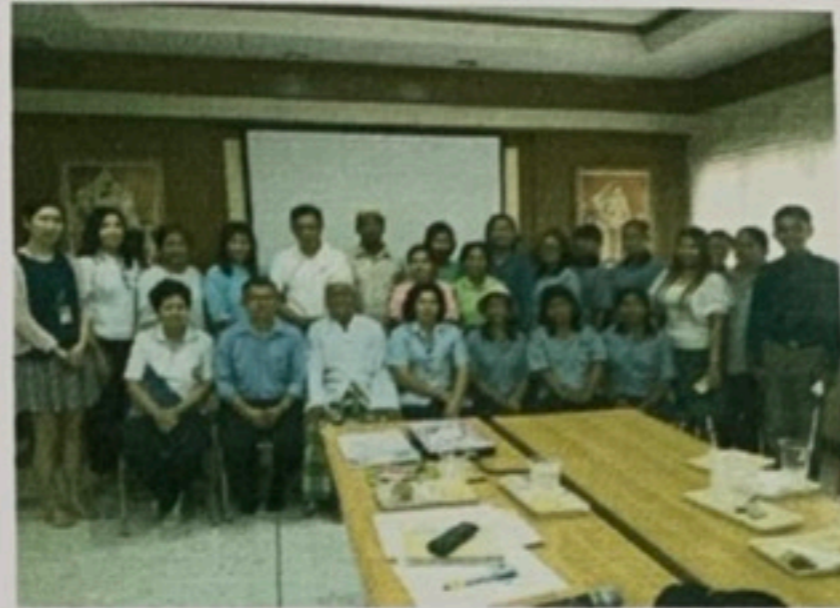
อบรมแกนนำอสม.และเครือข่ายตำบลท่าข้าม