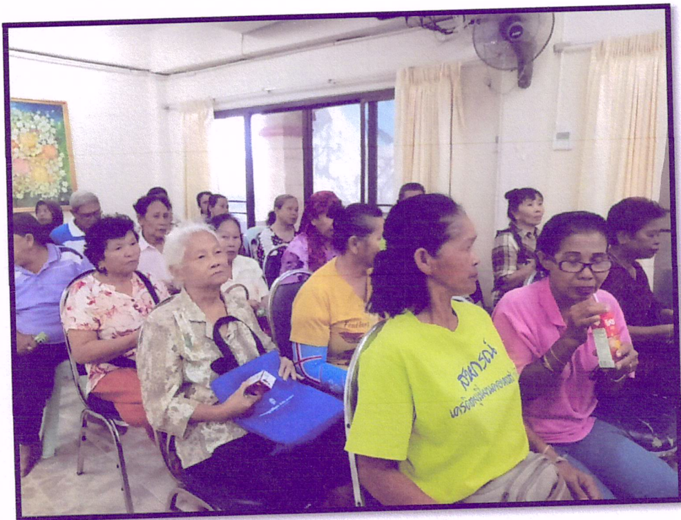
ภาพที่ 6 จัดอบรมปรับเปลี่ยนพฤติกรรมตามหลัก 3 อ. 2 ส.