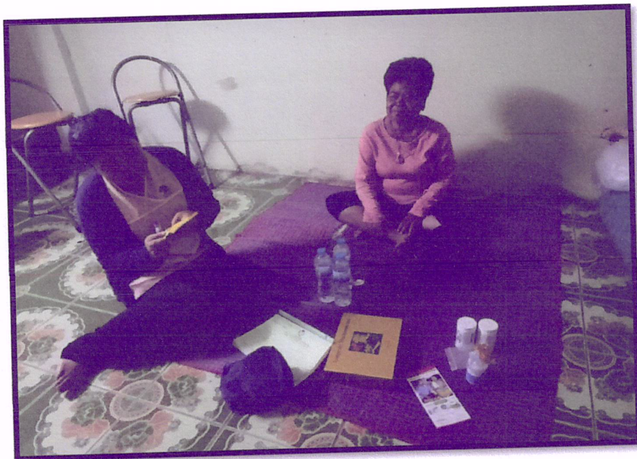
ภาพที่ 2 ติดตามเยี่ยมบ้านผู้เข้าร่วมโครงการ(สาขารัตนอุทิศ)