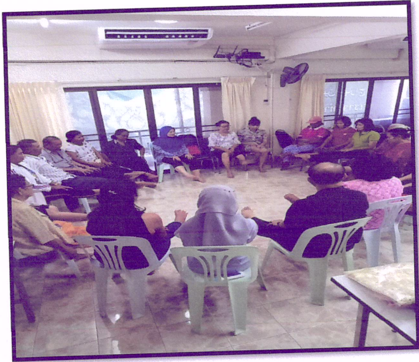
ภาพที่ 1 จัดอบรมปรับเปลี่ยนพฤติกรรมตามหลัก 3 อ. 2 ส.

กิจกรรมครั้งที่ 2 จัดอบรมเชิงปฏิบัติการเพื่อปรับเปลี่ยนพฤติกรรมในประชาชนกลุ่มเสี่ยง ครั้งที่ 2 วันที่ 27 สิงหาคม 2562 ณ ห้องประชุมคลินิกชุมชนอบอุ่นนายแพทย์เกรียงศักดิ์ สาขารัตน อุทิศ จำนวน 60 คน