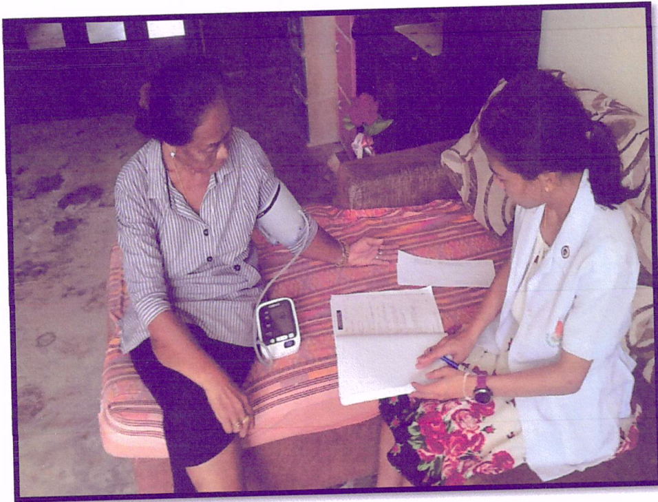
ภาพที่ 3 ติดตามเยี่ยมบ้านผู้เข้าร่วมโครงการ(สาขารัตนอุทิศ)