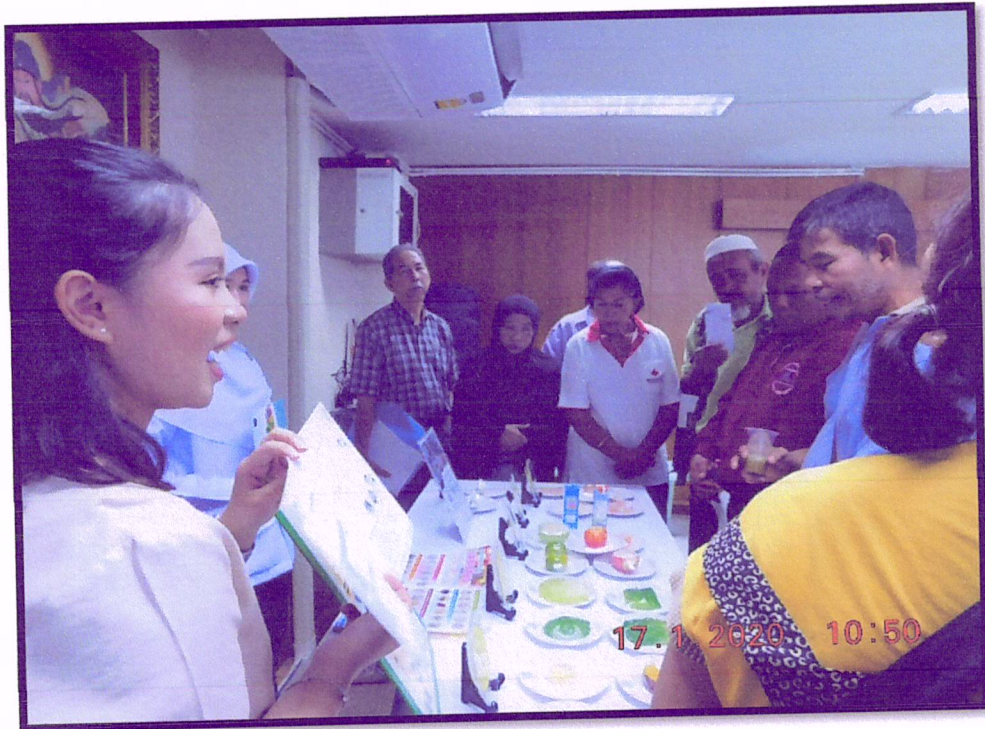
ภาพที่ 3 จัดอบรมปรับเปลี่ยนพฤติกรรมตามหลัก 3 อ. 2 ส. (สาขาหาดใหญ่)