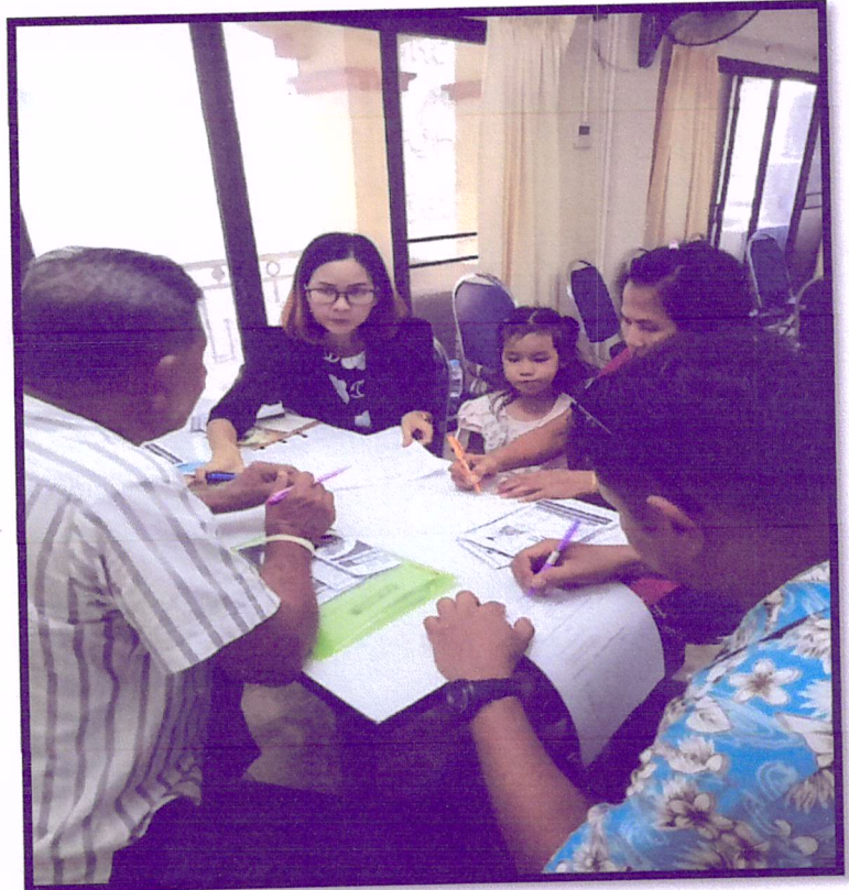
ภาพที่ 3 จัดอบรมปรับเปลี่ยนพฤติกรรมตามหลัก 3 อ. 2 ส. (สาขารัตนอุทิศ)