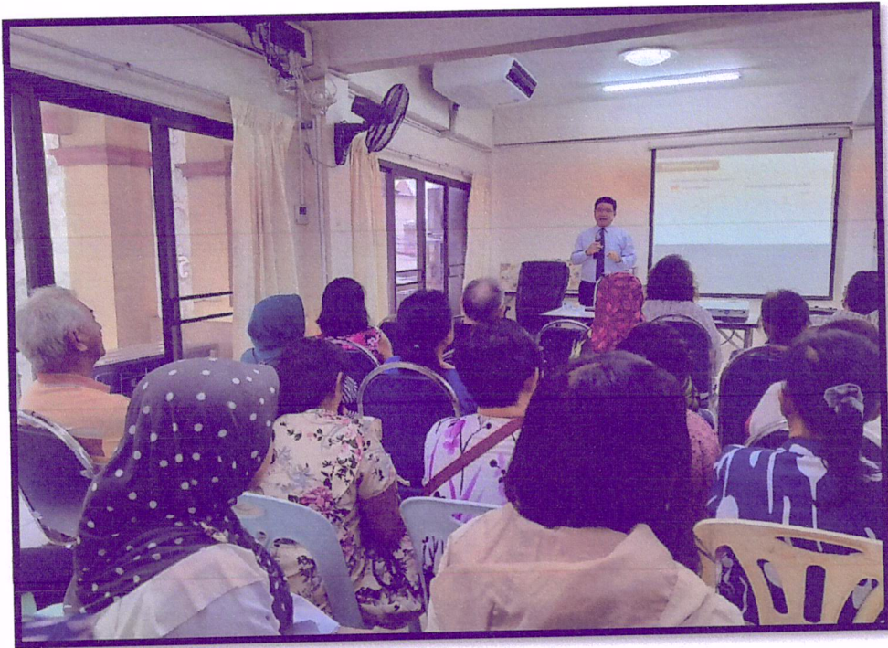
ภาพที่ 1 จัดอบรมเรื่องสมุนไพรเพื่อสุขภาพ

กิจกรรมครั้งที่ 4 จัดอบรมเชิงปฏิบัติการเพื่อปรับเปลี่ยนพฤติกรรมในประชาชนกลุ่มเสี่ยง ครั้งที่ 3 วันที่ 22 พฤศจิกายน 2562 ณ ห้องประชุมคลินิกชุมชนอบอุ่นนายแพทย์เกรียงศักดิ์ สาขา รัตนอุทิศ จำนวน 60 คน