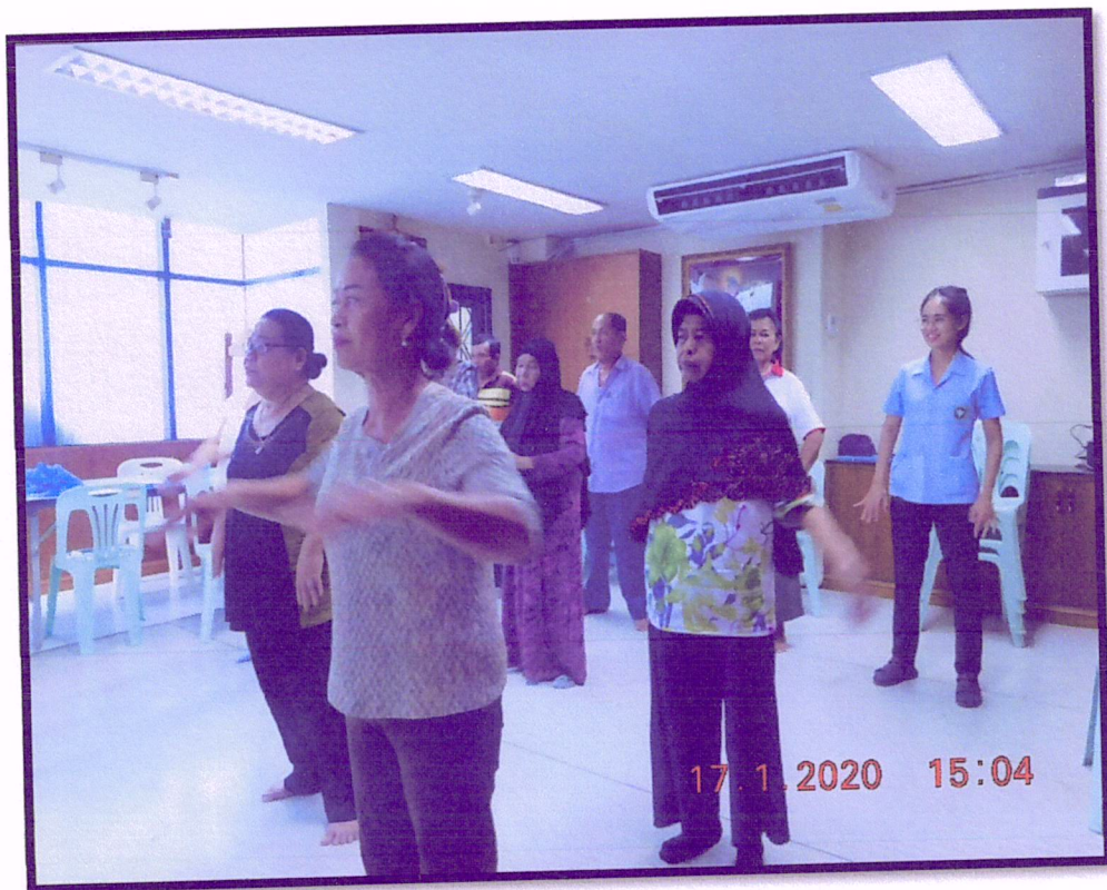
ภาพที่ 4 จัดอบรมปรับเปลี่ยนพฤติกรรมตามหลัก 3 อ. 2 ส. (สาขาหาดใหญ่)