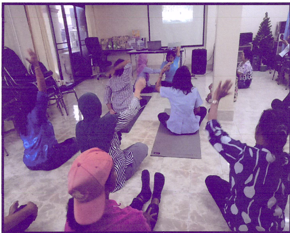
ภาพที่ 3 จัดอบรมและฝึกปฏิบัติการทำโยคะ