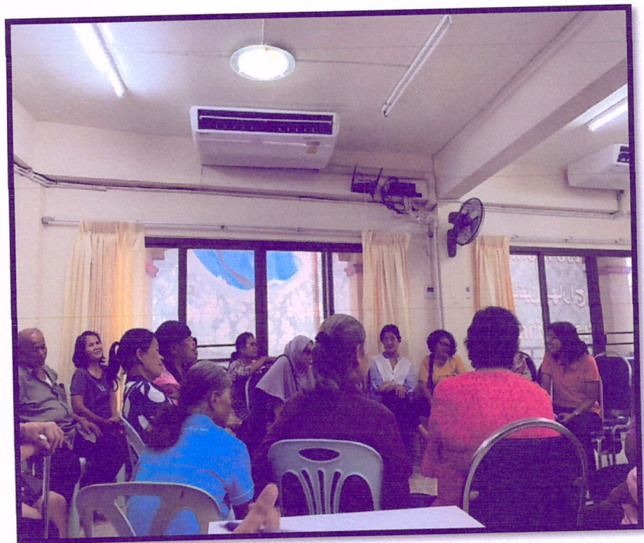
ภาพที่ 4 แลกเปลี่ยนเรียนรู้ ตามหลัก 3 อ. 2 ส.