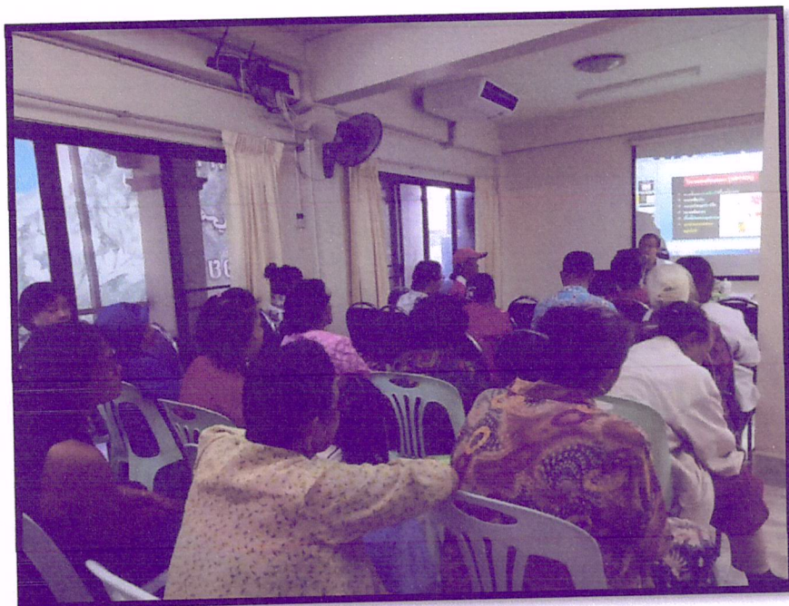
ภาพที่ 1 จัดอบรมปรับเปลี่ยนพฤติกรรมผู้ที่มีภาวะเสี่ยงต่อโรคหัวใจและหลอดเลือด (สาขารัตนอุทิศ)

กิจกรรมครั้งที่ 1 จัดอบรมเชิงปฏิบัติการเพื่อปรับเปลี่ยนพฤติกรรมในประชาชนกลุ่มเสี่ยง ครั้งที่ 1 วันที่ 16 มิถุนายน 2562 ณ ห้องประชุมคลินิกชุมชนอบอุ่นนายแพทย์เกรียงศักดิ์ สาขา รัตนอุทิศและสาขาหาดใหญ่ใน จำนวน 60 คน