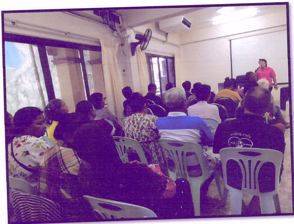
ภาพที่ 2 จัดอบรมปรับเปลี่ยนพฤติกรรมตามหลัก 3 อ. 2 ส.