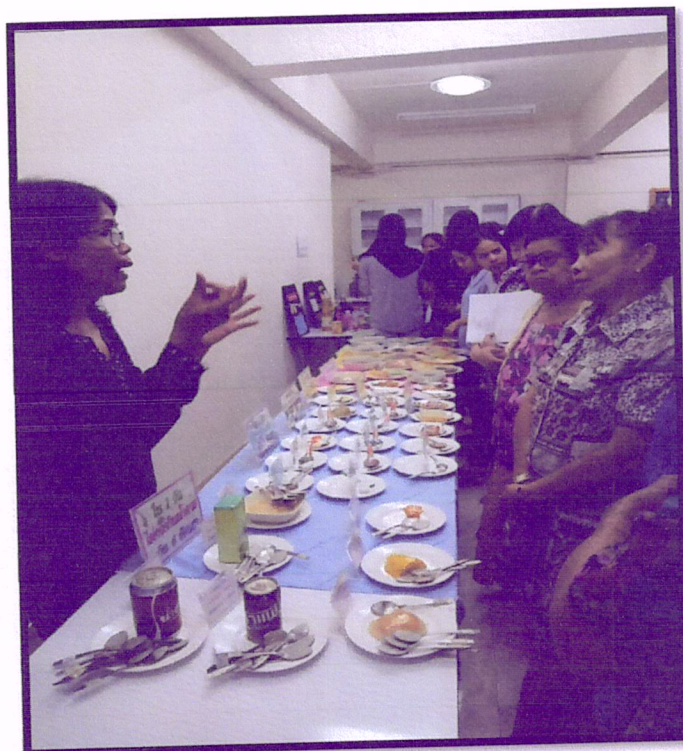
ภาพที่ 2 จัดอบรมปรับเปลี่ยนพฤติกรรมตามหลัก 3 อ. 2 ส. (สาขารัตนอุทิศ)