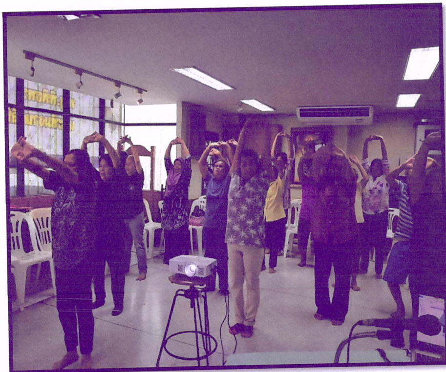
ภาพที่ 7 จัดอบรมปรับเปลี่ยนพฤติกรรมตามหลัก 3 อ. 2 ส. (สาขาหาดใหญ่ไน)