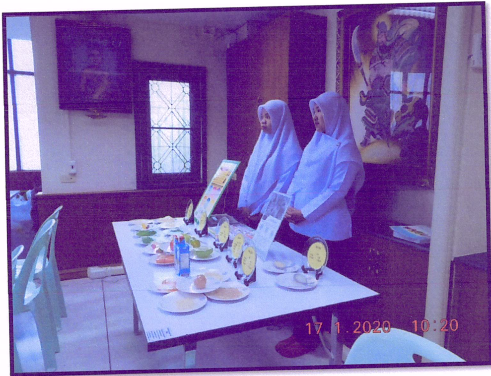
ภาพที่ 5 จัดอบรมปรับเปลี่ยนพฤติกรรมตามหลัก 3 อ. 2 ส. (สาขาหาดใหญ่)