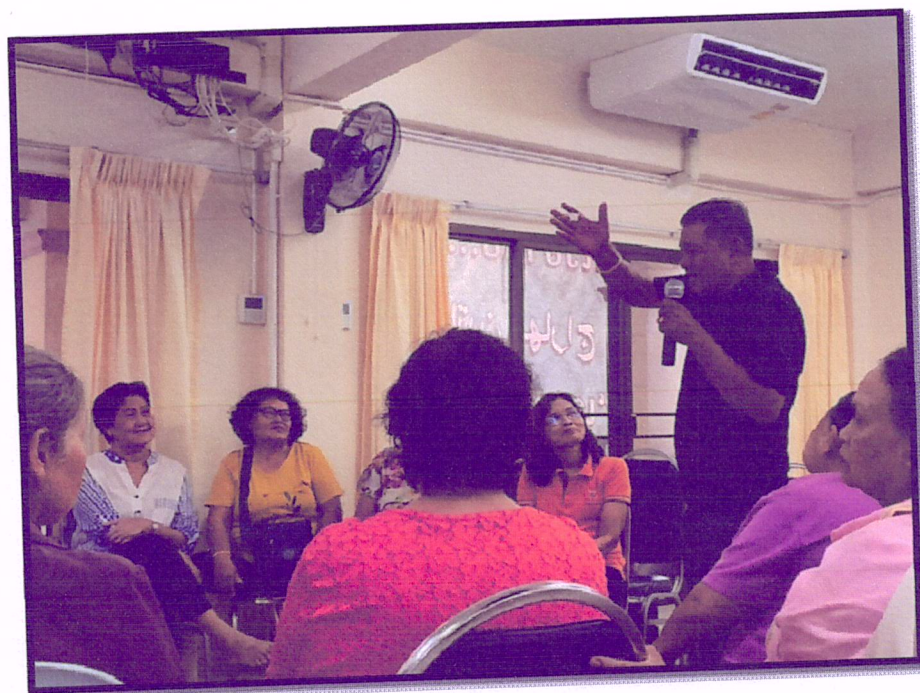
ภาพที่ 2 แลกเปลี่ยนเรียนรู้ตามหลัก 3 อ. 2 ส.