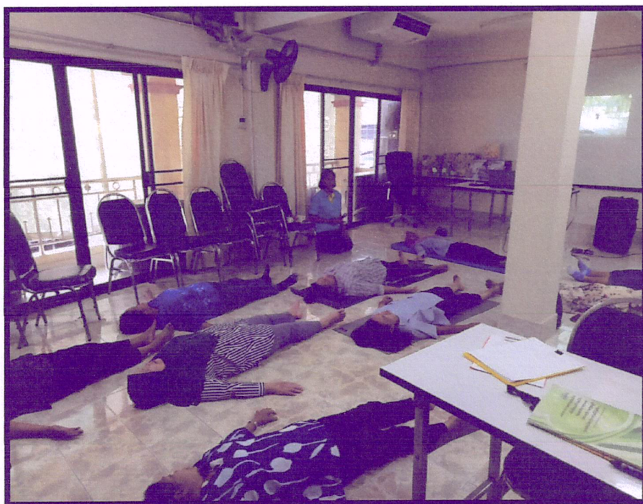
ภาพที่ 4 จัดอบรมและฝึกปฏิบัติการทำโยคะ