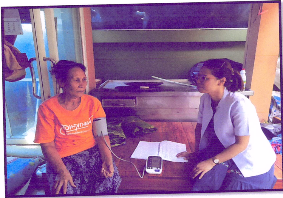
ภาพที่ 1 ติดตามเยี่ยมบ้านผู้เข้าร่วมโครงการ(สาขารัตนอุทิศ)