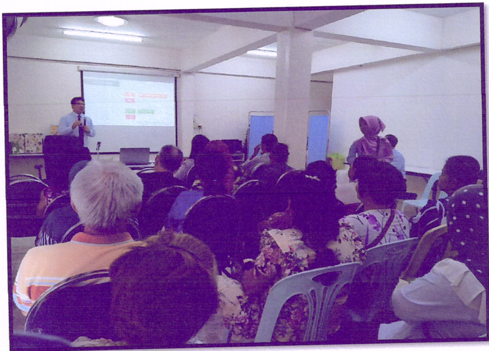
ภาพที่ 2 จัดอบรมเรื่องสมุนไพรเพื่อสุขภาพ