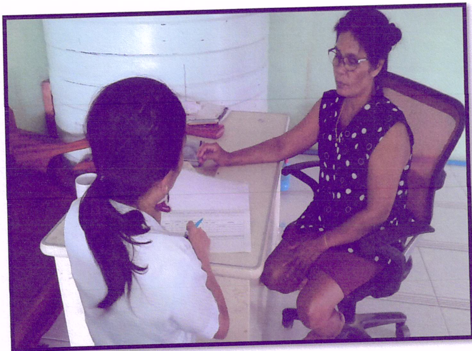
ภาพที่ 4 ติดตามเยี่ยมบ้านผู้เข้าร่วมโครงการ(สาขารัตนอุทิศ)