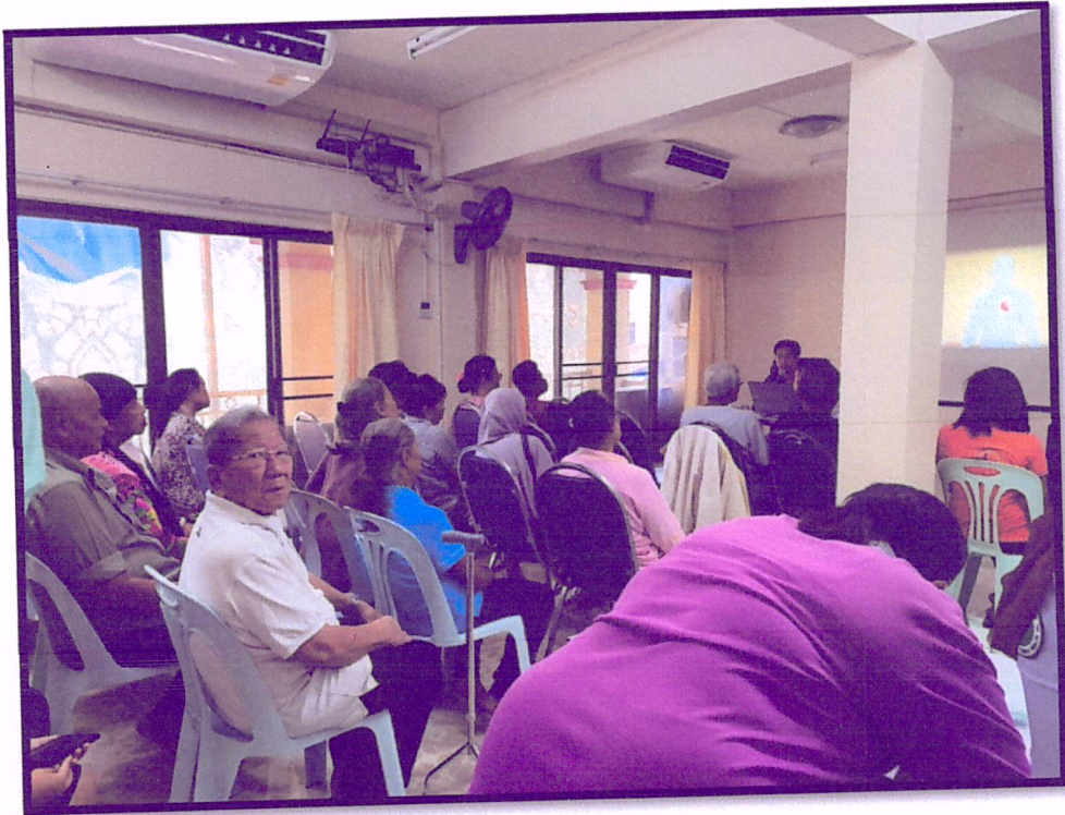
ภาพที่ 5 จัดอบรมปรับเปลี่ยนพฤติกรรมตามหลัก 3 อ. 2 ส.