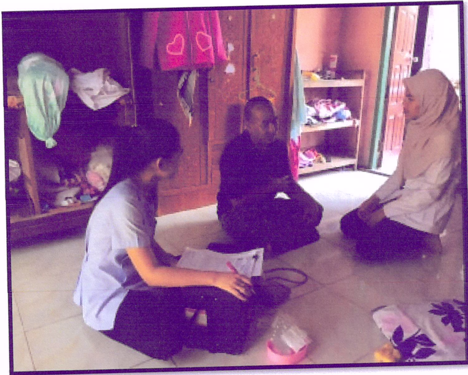
ภาพที่ 7 ติดตามเยี่ยมบ้านผู้เข้าร่วมโครงการ(สาขาหาดใหญ่ใน)