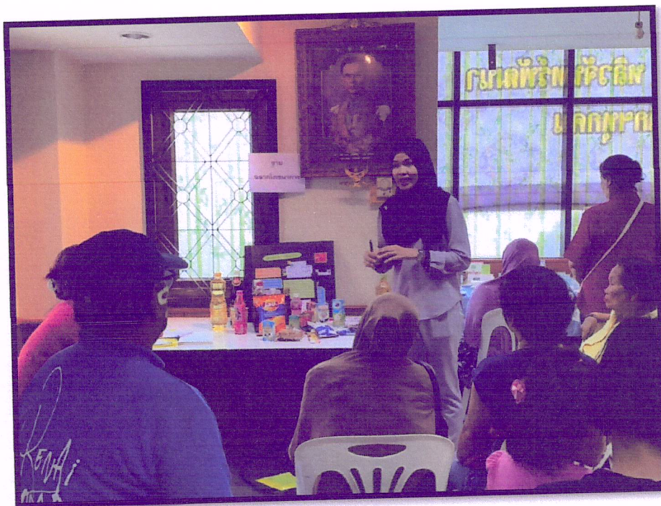
ภาพที่ 6 จัดอบรมปรับเปลี่ยนพฤติกรรมตามหลัก 3 อ. 2 ส. (สาขาหาดใหญ่)