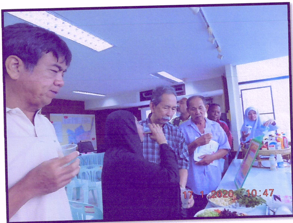
ภาพที่ 6 จัดอบรมปรับเปลี่ยนพฤติกรรมตามหลัก 3 อ. 2 ส. (สาขาหาดใหญ่)