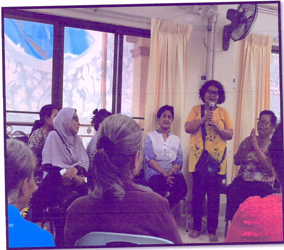
ภาพที่ 3 แลกเปลี่ยนเรียนรู้ ตามหลัก 3 อ. 2 ส.