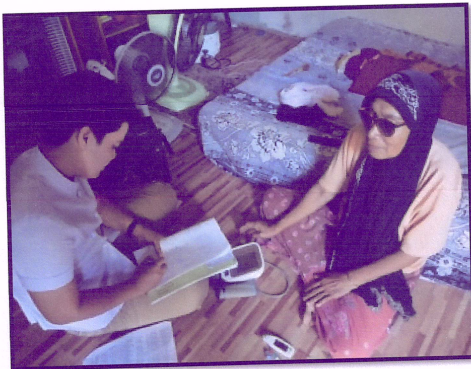
ภาพที่ 6 ติดตามเยี่ยมบ้านผู้เข้าร่วมโครงการ(สาขาหาคีใหญ่โน)