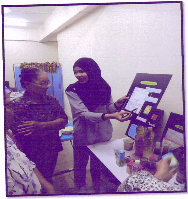
ภาพที่ 4 จัดอบรมปรับเปลี่ยนพฤติกรรมตามหลัก 3 อ. 2 ส. (สาขารัตนอุทิศ)