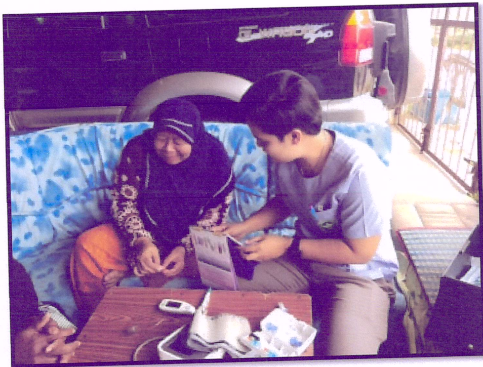
ภาพที่ 8 ติดตามเยี่ยมบ้านผู้เข้าร่วมโครงการ(สาขาหาดใหญ่ใน)