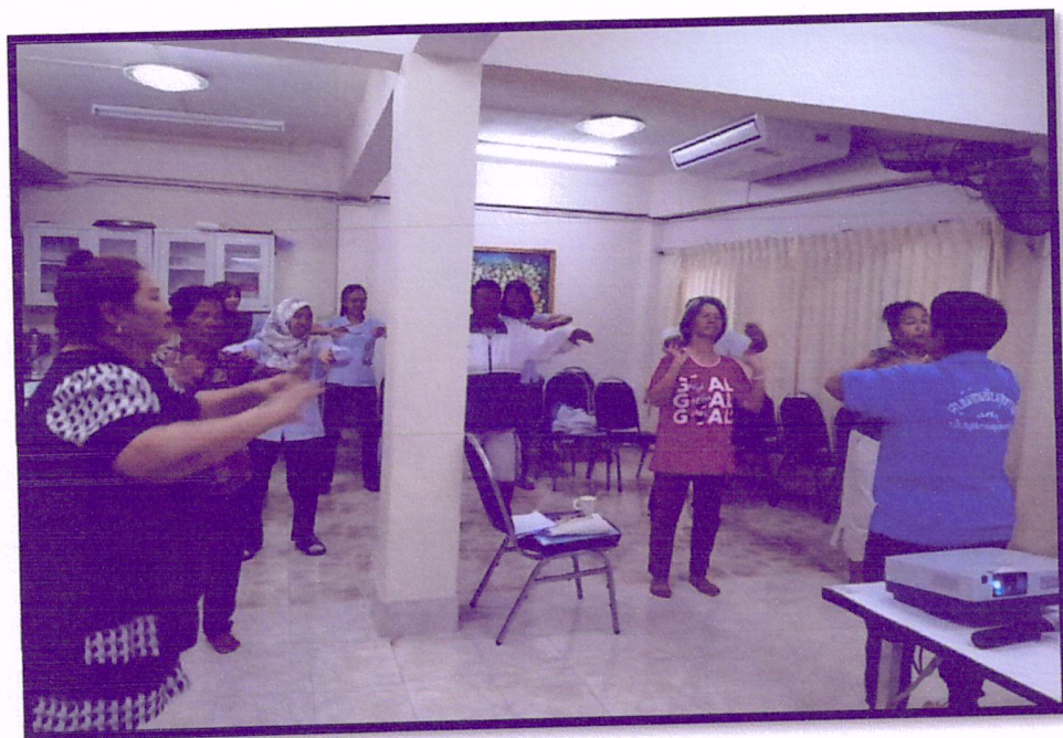
ภาพที่ 2 จัดอบรมปรับเปลี่ยนพฤติกรรมตามหลัก 3 อ. 2 ส. (สาขารัตนอุทิศ)