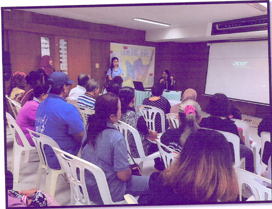
ภาพที่ 5 จัดอบรมปรับเปลี่ยนพฤติกรรมตามหลัก 3 อ. 2 ส. (สาขาหาดใหญ่)